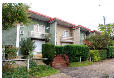
Vue d'ensemble des immeubles en R+1 au nord de la parcelle IVR82_20086902820NUCA