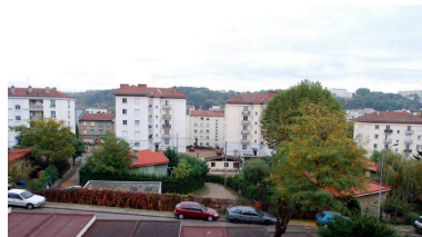
Vue d'ensemble depuis l'ouest IVR82_20086902818NUCA