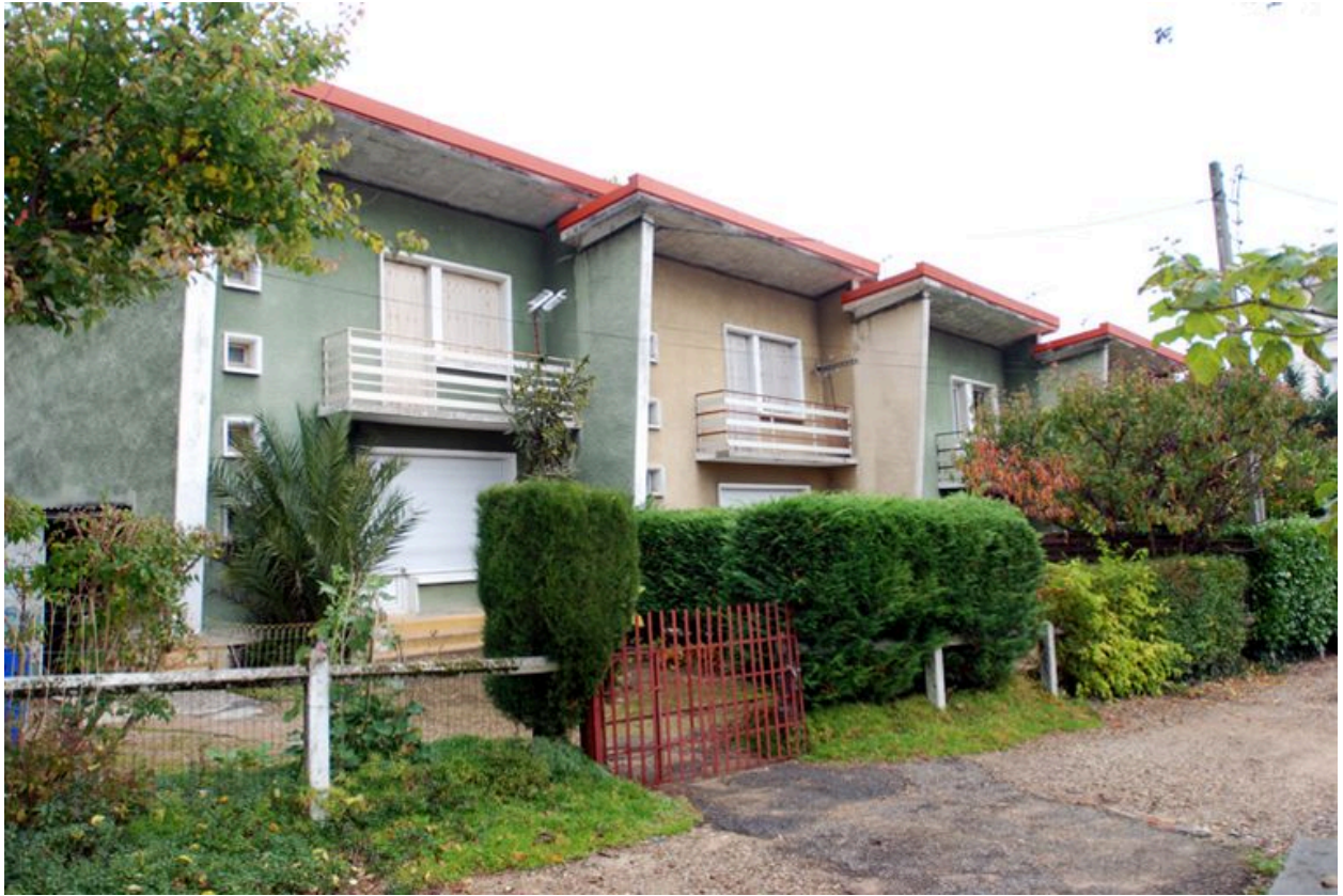
Vue d'ensemble des immeubles en R+1 au nord de la parcelle