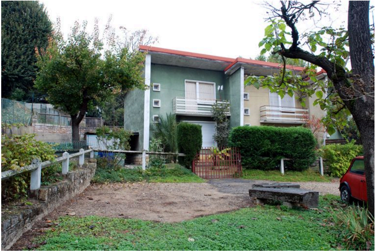
Immeubles en R+1 au nord de la parcelle, détail