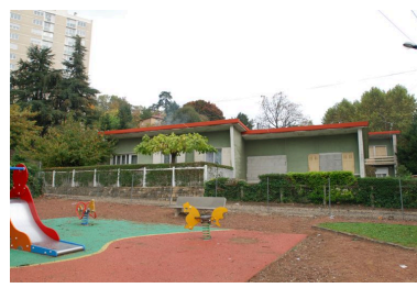
Vue du square en coeur d'îlot IVR82_20086902822NUCA