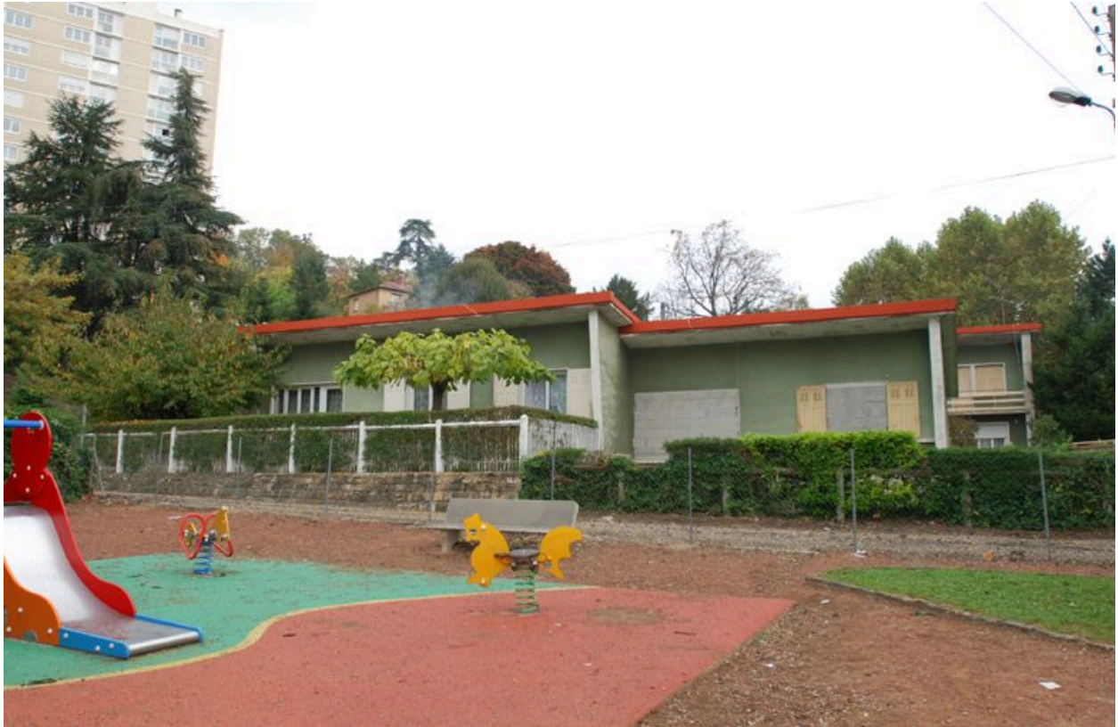
Vue du square en coeur d'îlot