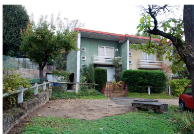
Immeubles en R+1 au nord de la parcelle, détail IVR82_20086902821NUCA