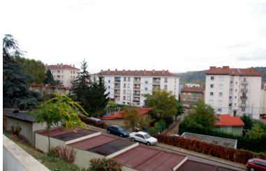
Vue d'ensemble depuis le sud-ouest IVR82_20086902817NUCA