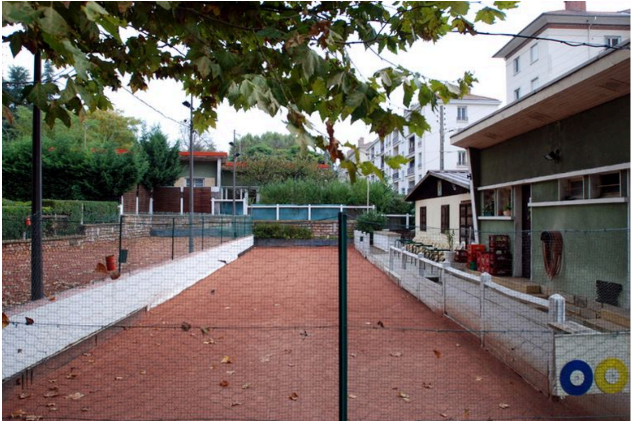
Vue du bouledrome