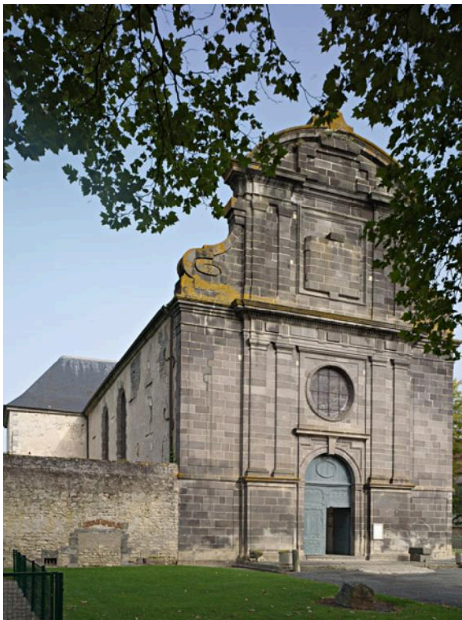
Vue sud sud-est de l'église