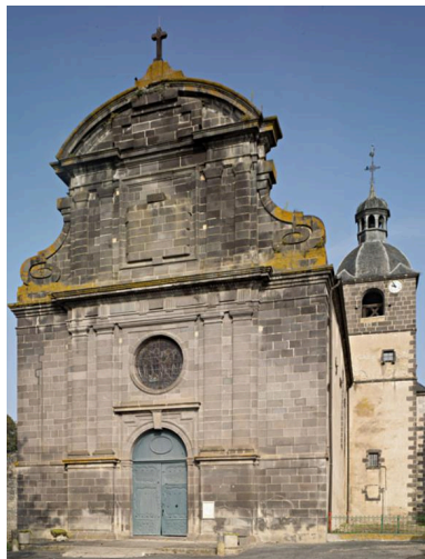
Vue de la façade orientée sud-est.