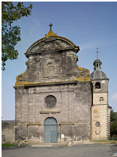
Vue générale de la façade orientée sud-est.