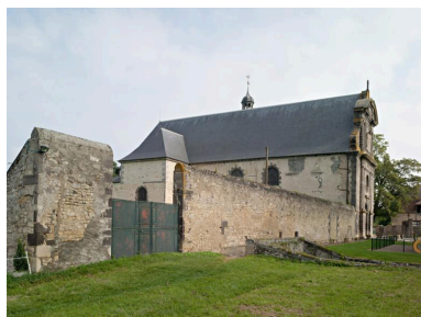
Vue du sud ouest de l'église. IVR83_20146300652NUC4A