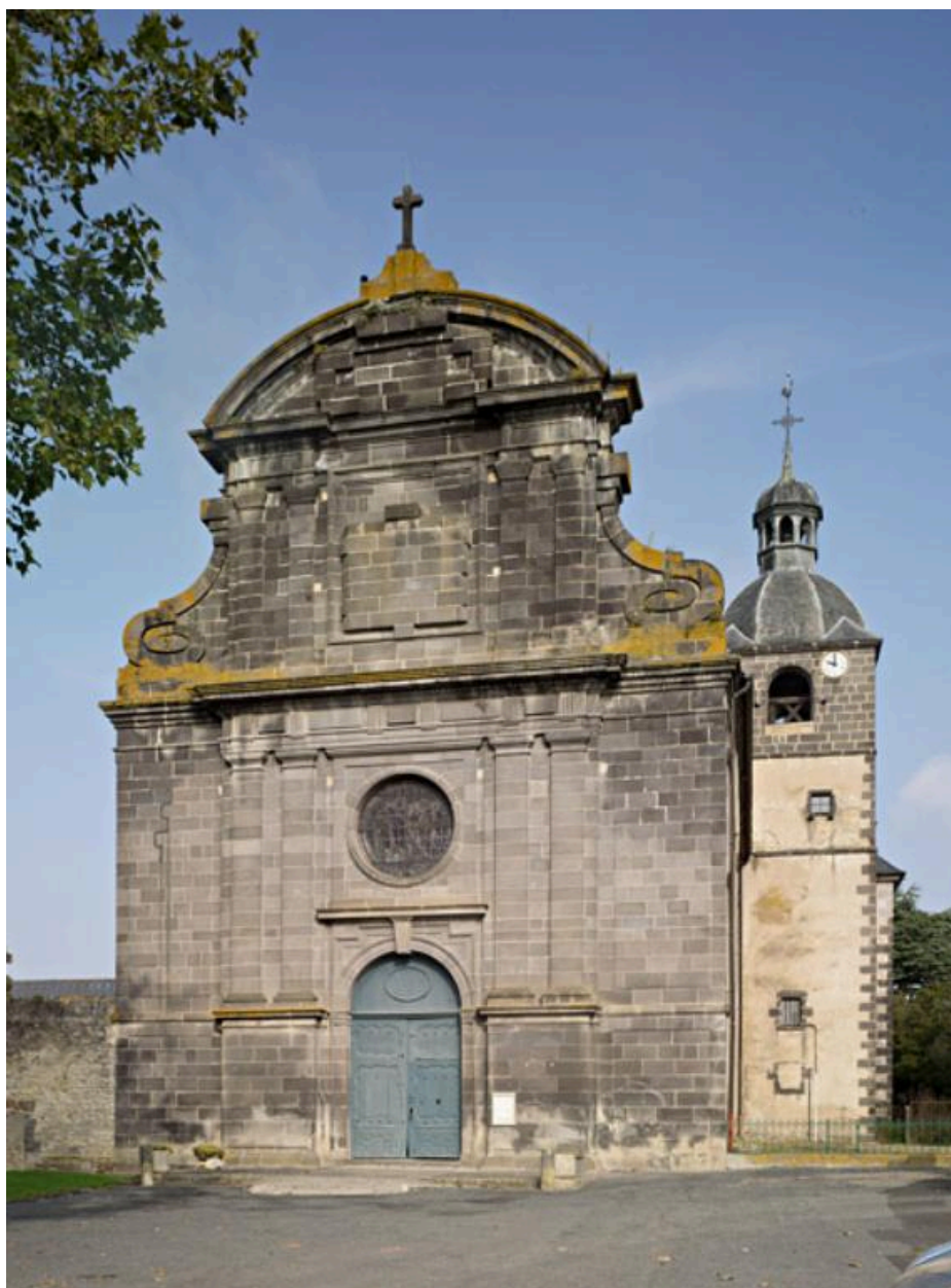
Vue générale de la façade orientée sud-est.