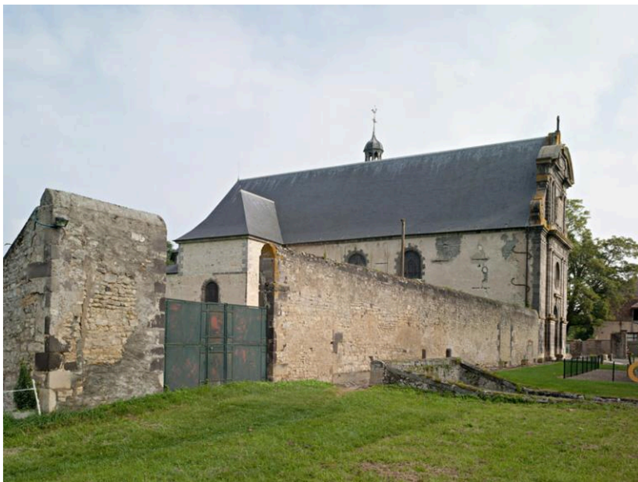
Vue du sud ouest de l'église.