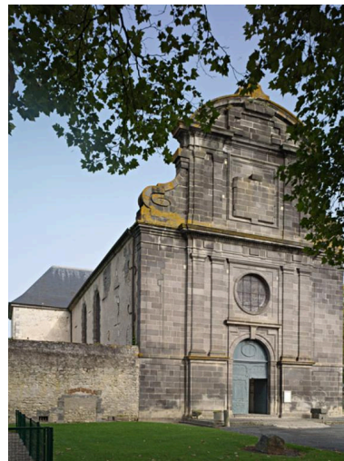
Vue sud sud-est de l'église