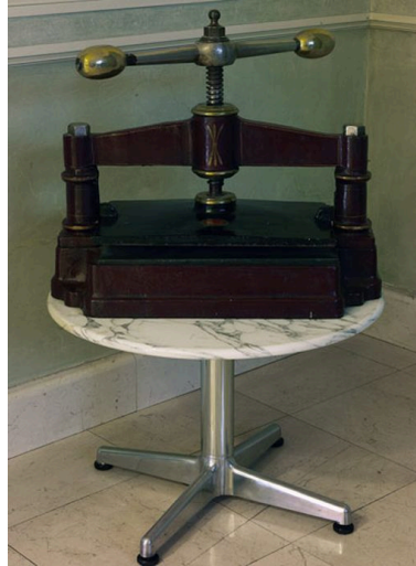
Vue générale. IVR82_20116901453NUCA