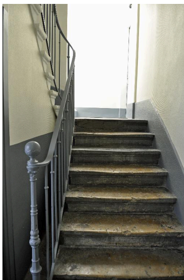
Vue intérieure : le départ de l'escalier IVR82_20156901050NUCA