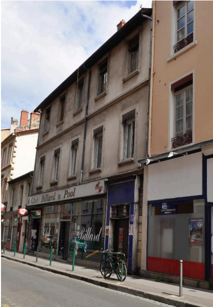
Vue générale de l'élévation sur rue