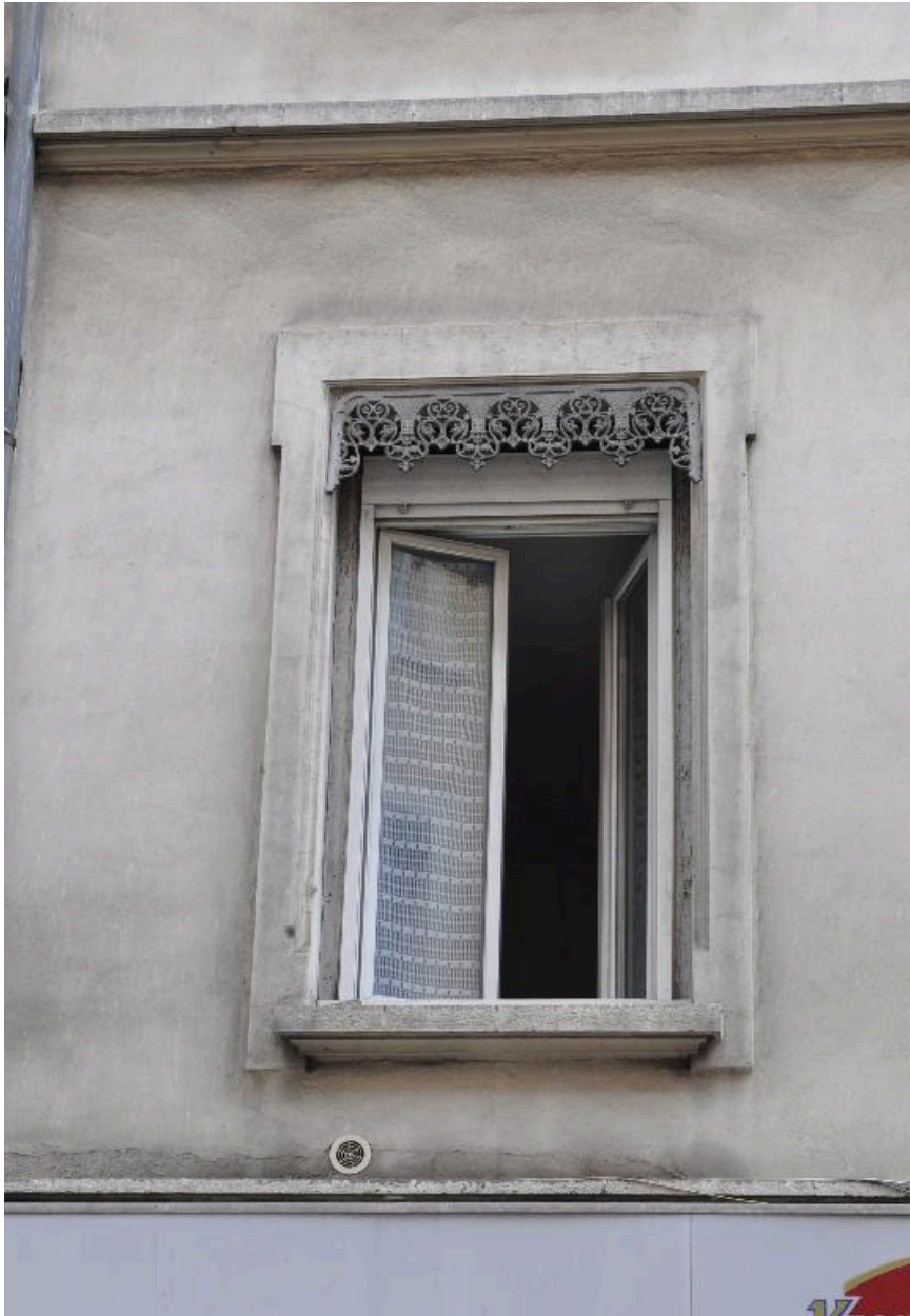
Vue rapprochée de l'élévation sur rue : décor d'une fenêtre