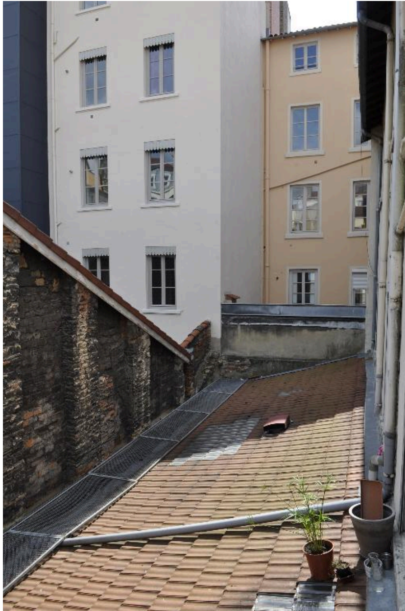
Vue de la toiture du bâtiment occupant la cour