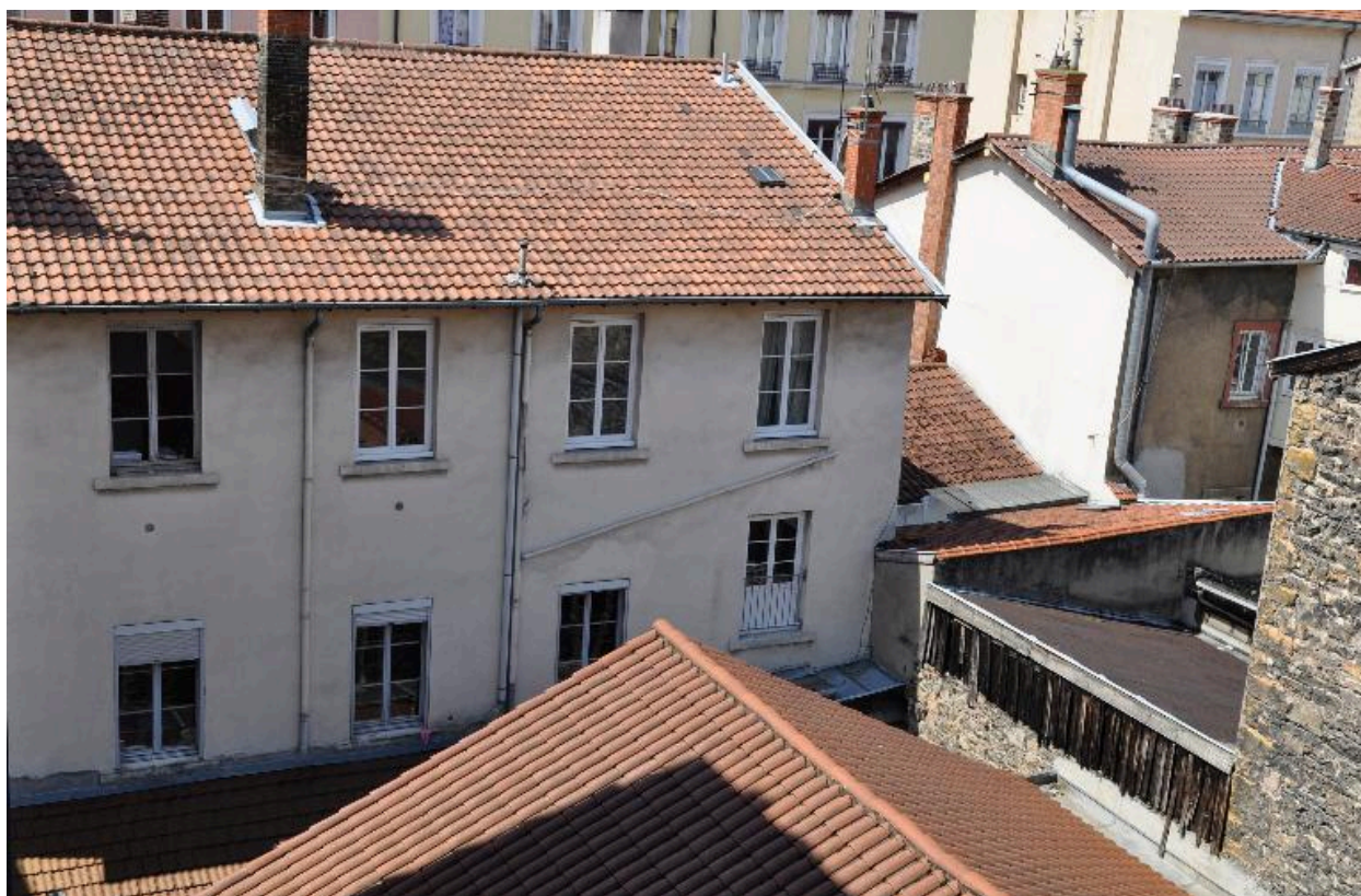
Vue partielle de l'élévation sur cour