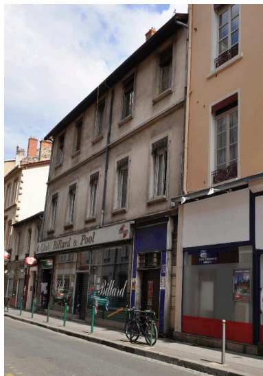
Vue générale de l'élévation sur rue