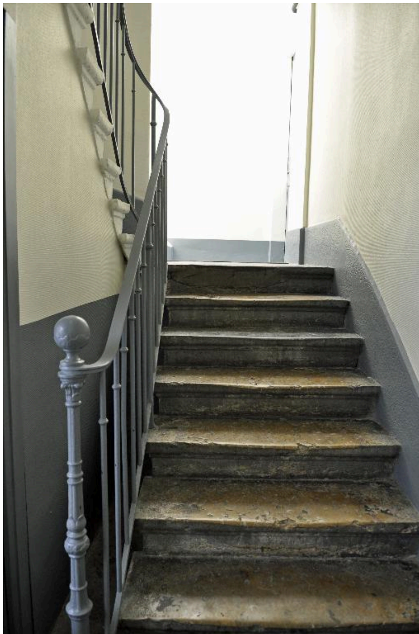
Vue intérieure : le départ de l'escalier