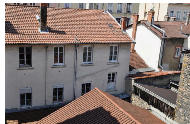
Vue partielle de l'élévation sur cour IVR82_20156901051NUCA