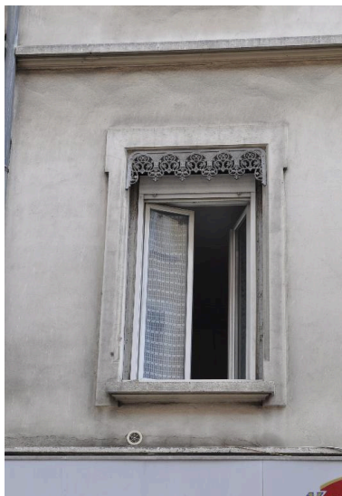
Vue rapprochée de l'élévation sur rue : décor d'une fenêtre