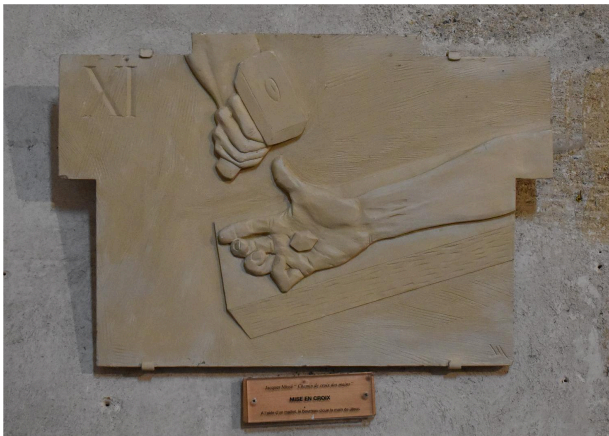
Station XI : La mise en croix