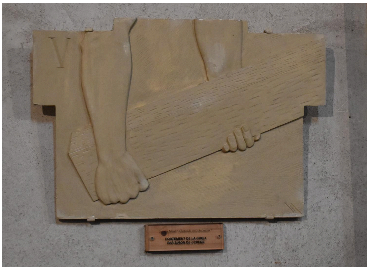
Station V : Portement de la croix par Simon de Cyrène