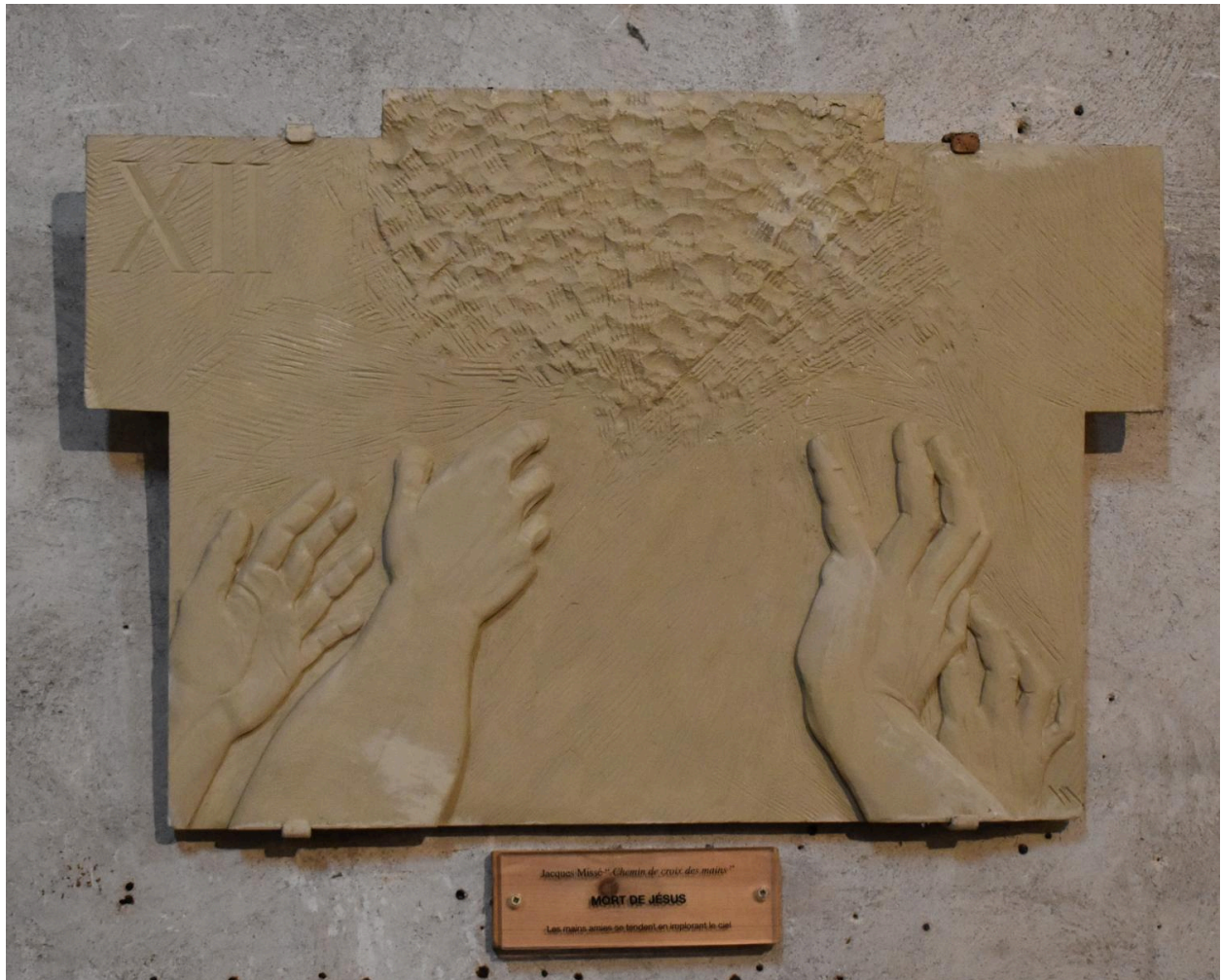
Station XII : La mort de Jésus