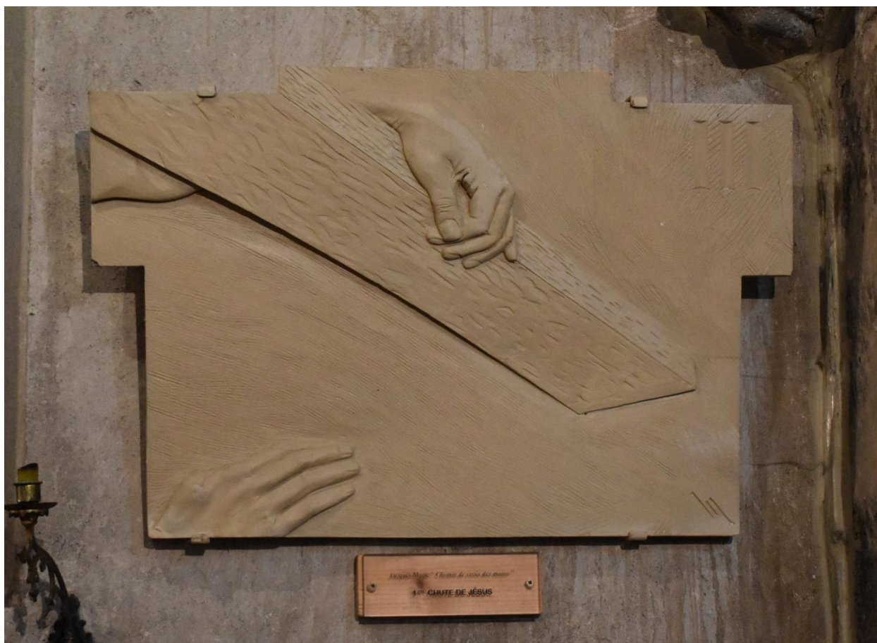
Station III : Chute de Jésus