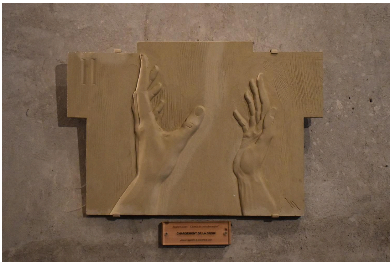
Station II : chargement de la croix