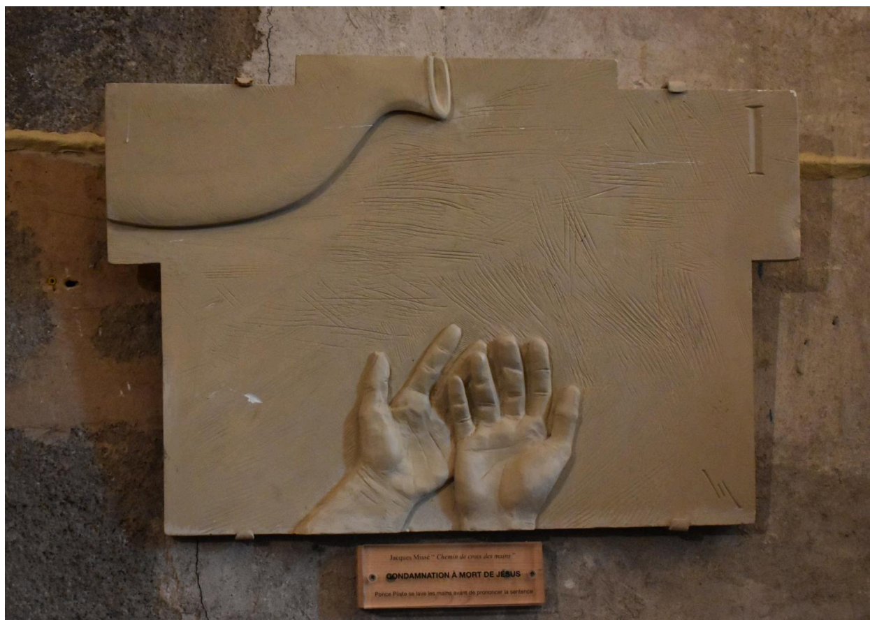
Station I : Condamnation à mort de Jésus