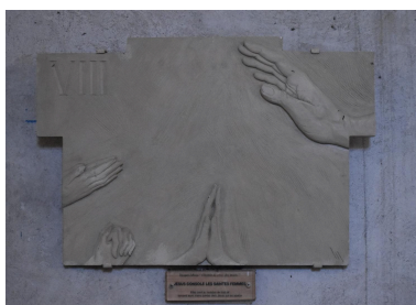
Station VIII : Jésus console les saintes femmes.