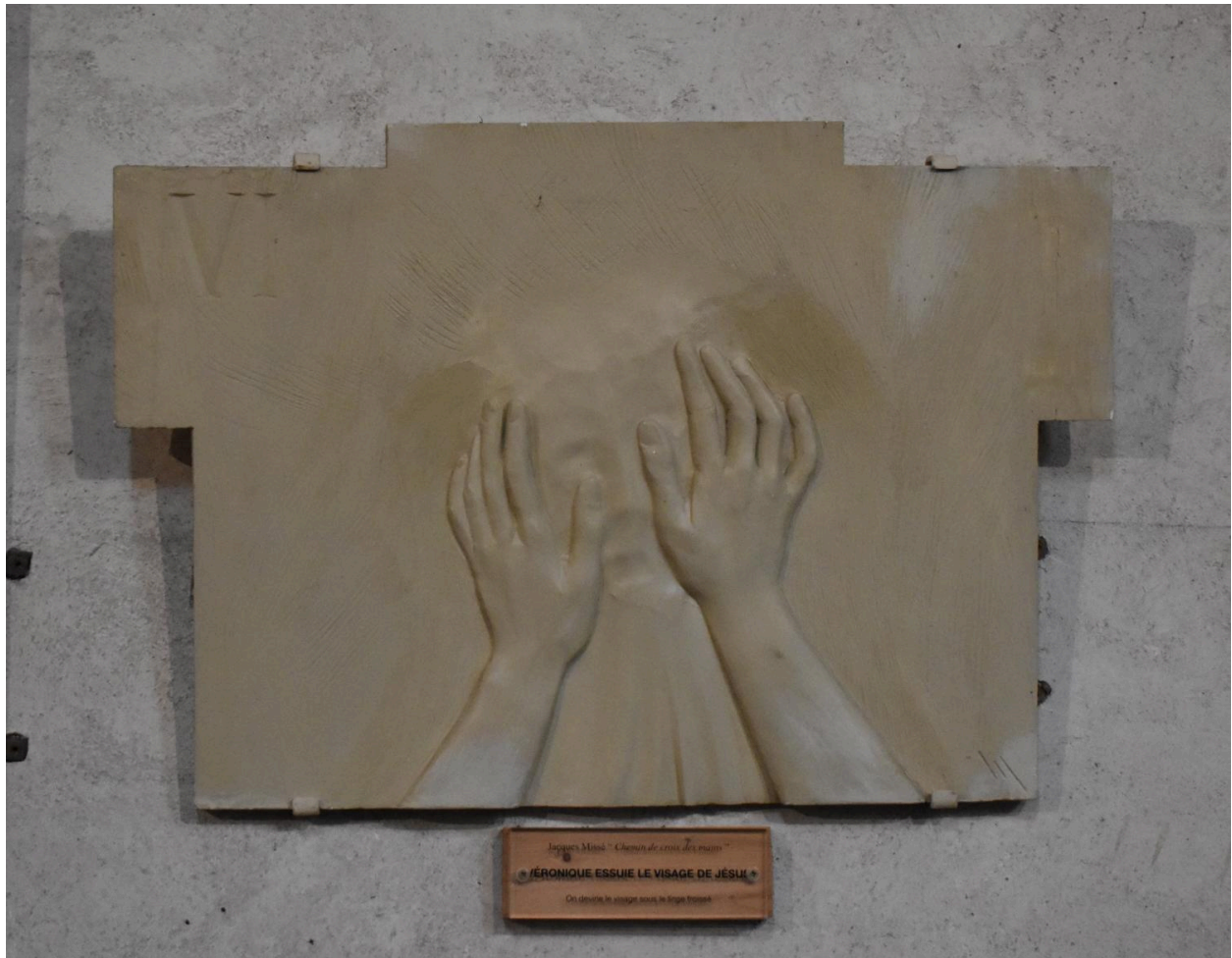
Station VI : Véronique essuie le visage de Jésus.