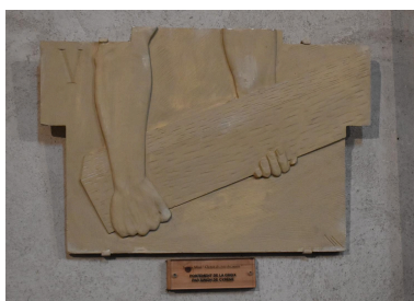
Station V : Portement de la croix par Simon de Cyrène IVR84_20250300156NUCA