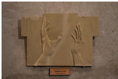
Station II : chargement de la croix IVR84_20250300153NUCA