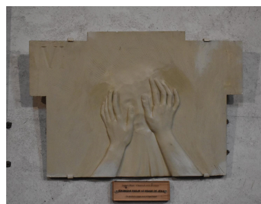
Station VI : Véronique essuie le visage de Jésus.