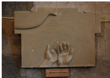
Station I : Condamnation à mort de Jésus IVR84_20250300152NUCA