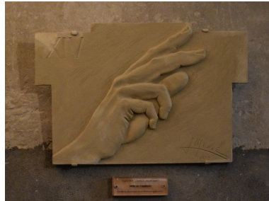
Station XIV : La mise au tombeau.