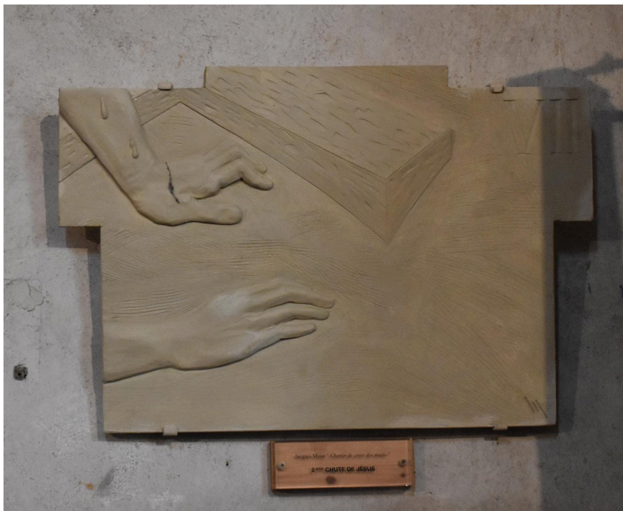
Station VII : Chute de Jésus