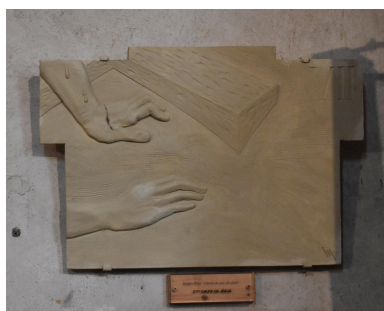
Station VII : Chute de Jésus IVR84_20250300158NUCA