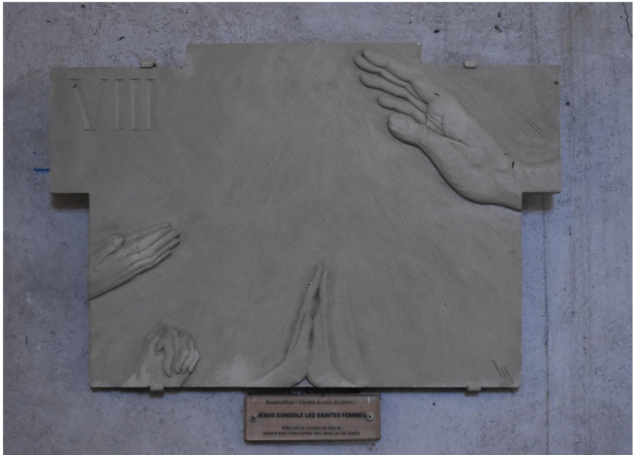
Station VIII : Jésus console les saintes femmes.