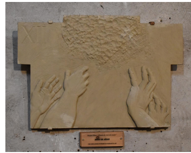
Station XII : La mort de Jésus IVR84_20250300163NUCA