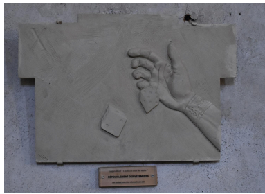
Station X : Le dépouillement des vêtements