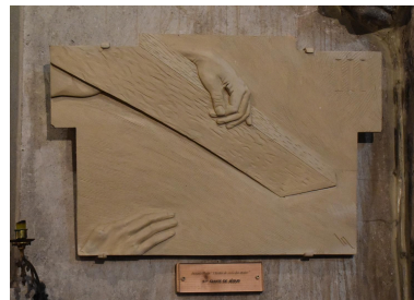
Station III : Chute de Jésus IVR84_20250300154NUCA