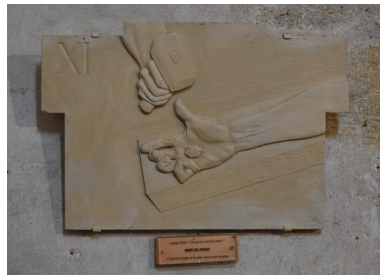
Station XI : La mise en croix IVR84_20250300162NUCA