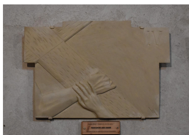
Station IV : Rencontre avec Marie IVR84_20250300155NUCA