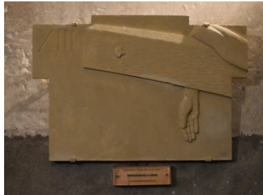
Station XIII : La déposition de la croix.