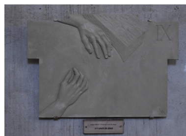
Station IX : Troisième chute de Jésus IVR84_20250300160NUCA