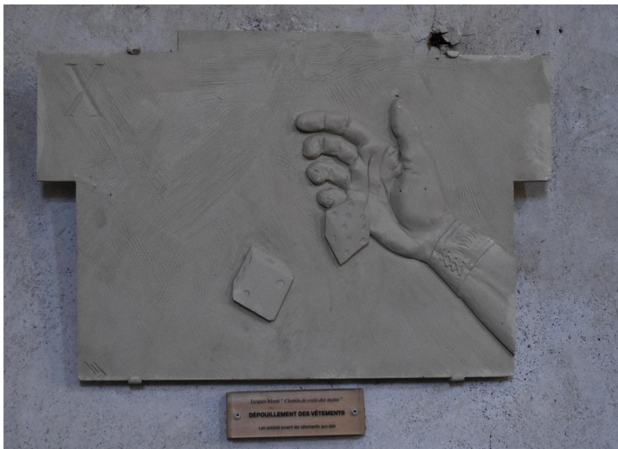
Station X : Le dépouillement des vêtements