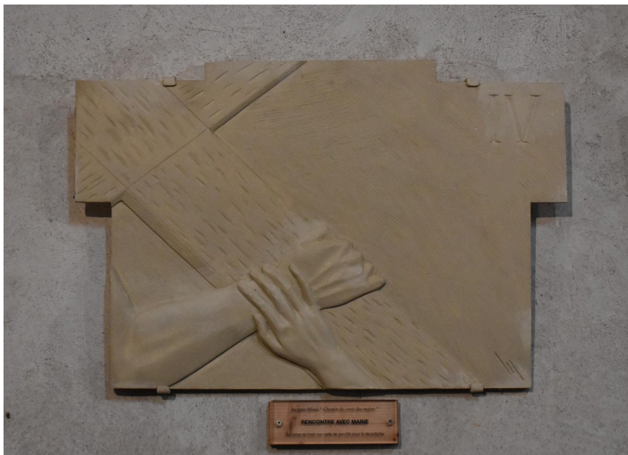
Station IV : Rencontre avec Marie