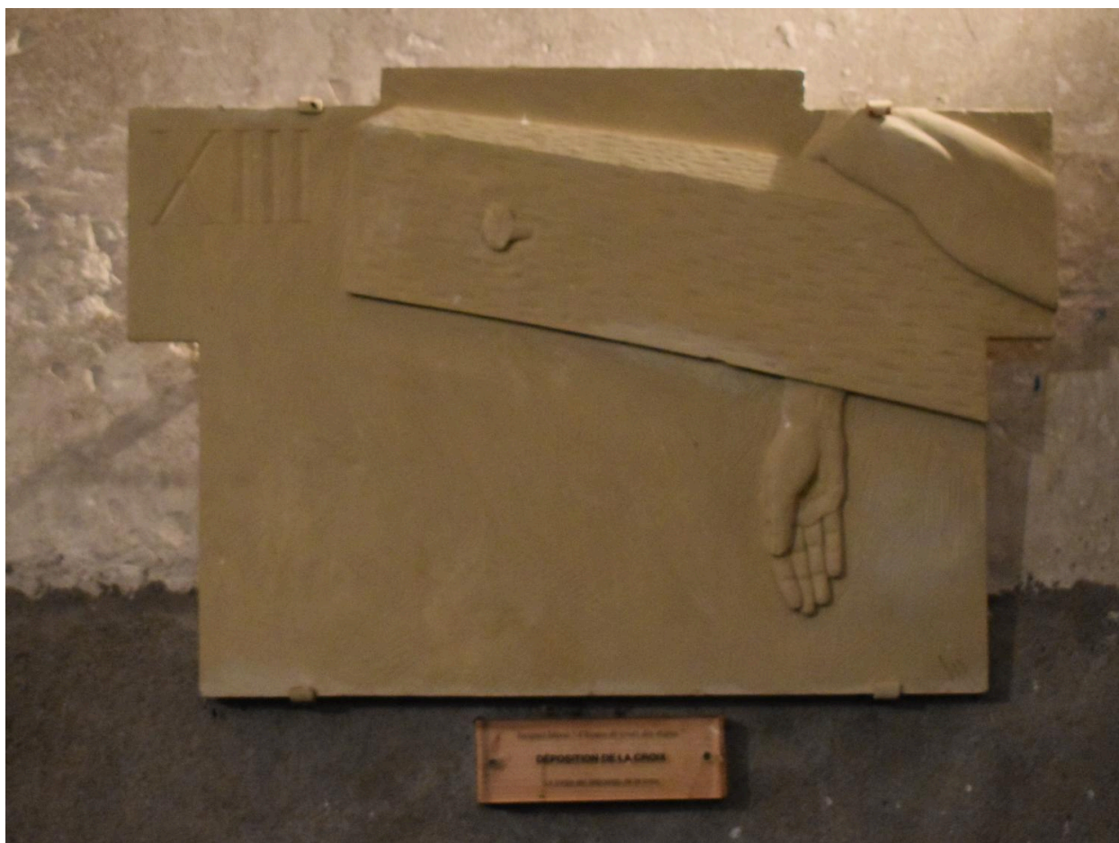
Station XIII : La déposition de la croix.