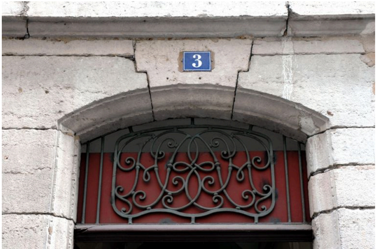
Détail de l'imposte