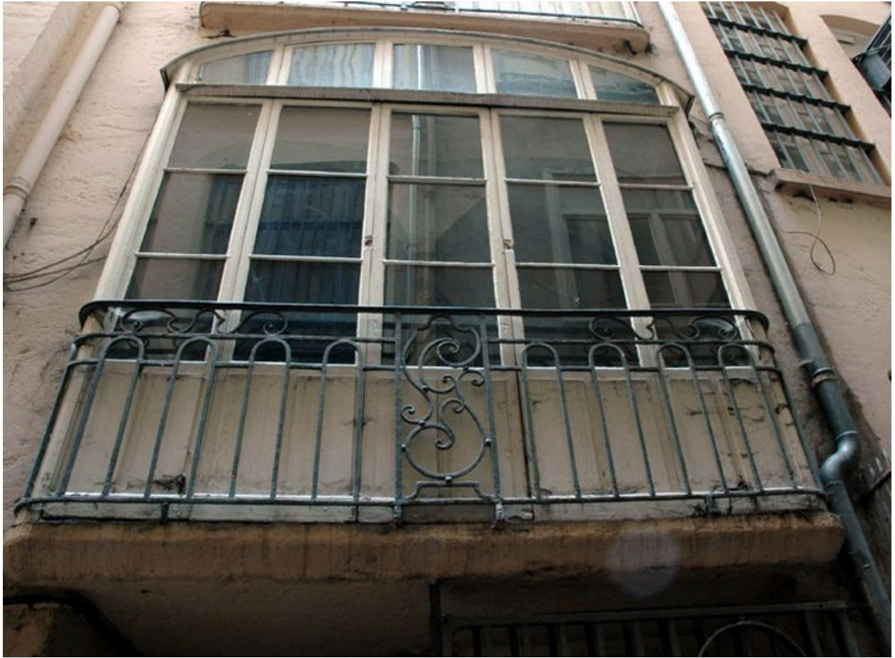
Détail de la baie du premier palier de l'escalier vue depuis la cour