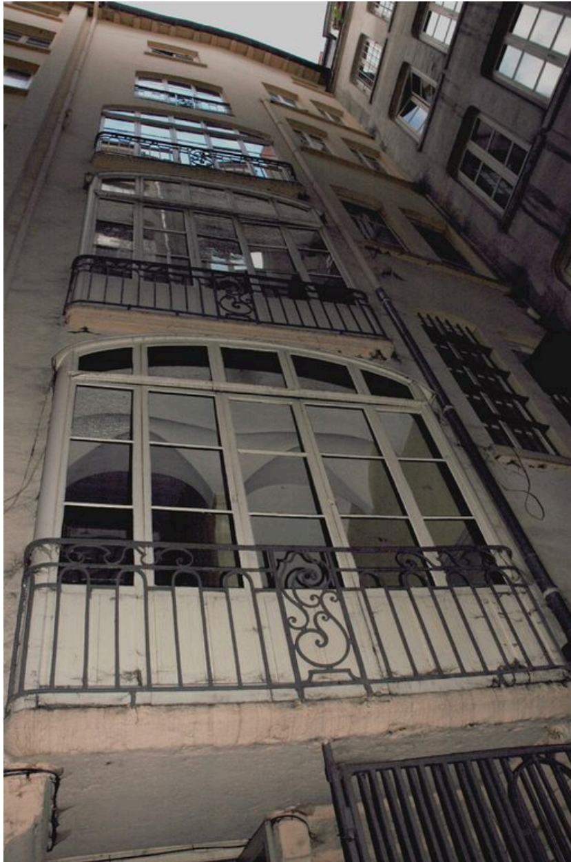
Vue de l'élévation sur cour