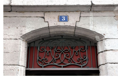
Détail de l'imposte