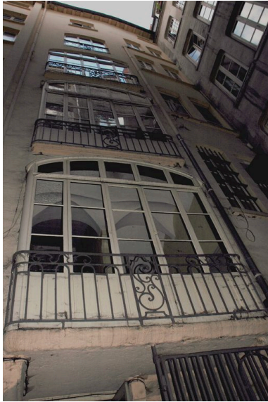
Vue de l'élévation sur cour IVR82_20066900769NUCA