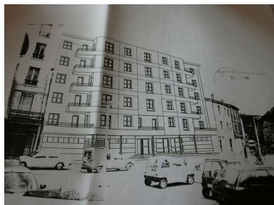
Projet 67 rue Victor Faugier IVR82_20123800244NUCA