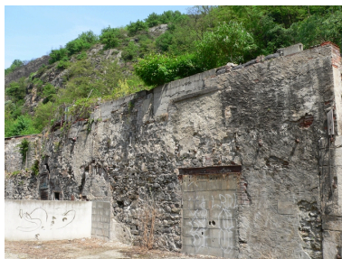
Mur à l'arrière IVR82_20093800474NUCA