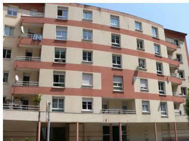
Façade sur rue IVR82_20093800473NUCA