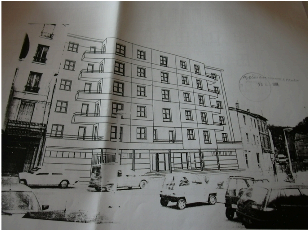
Projet 67 rue Victor Faugier