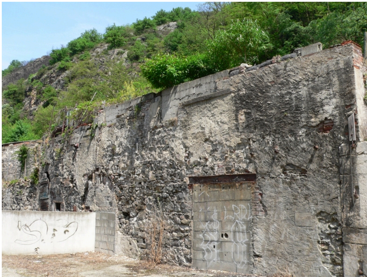
Mur à l'arrière