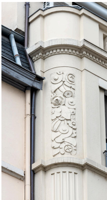
Détail du décor de la partie haute du surplomb