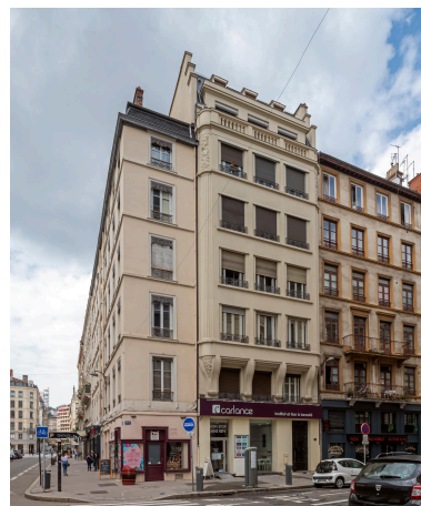
Vue de situation IVR84_20216900983NUCA