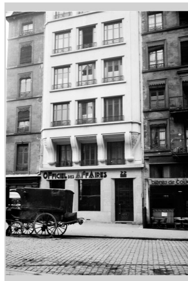
L'élévation antérieure dans les années 1930-1940