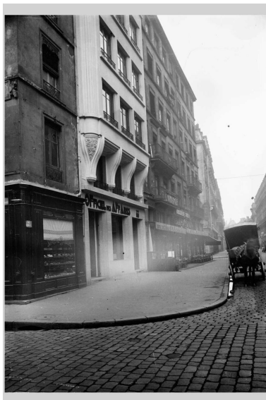
Vue de situation dans les années 1930-1940 IVR84_20216900392NUC