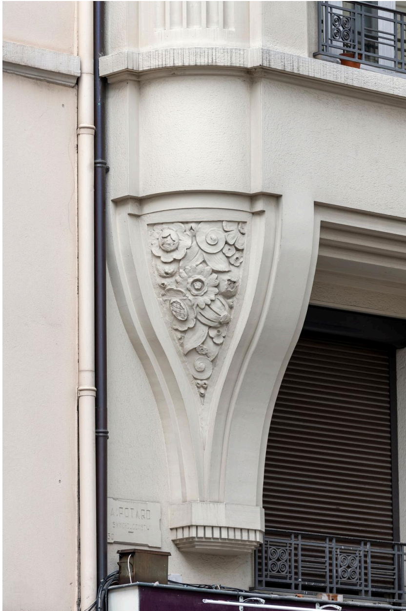
Détail de la base du surplomb, côté gauche. On distingue l'inscription, rare, qui mentionne A. POTARD Syndic-Constructeur, 1930