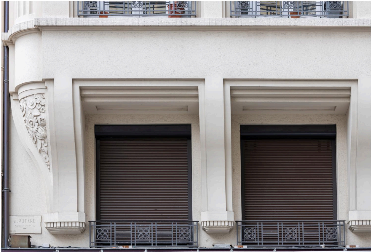
Vue partielle du premier étage carré