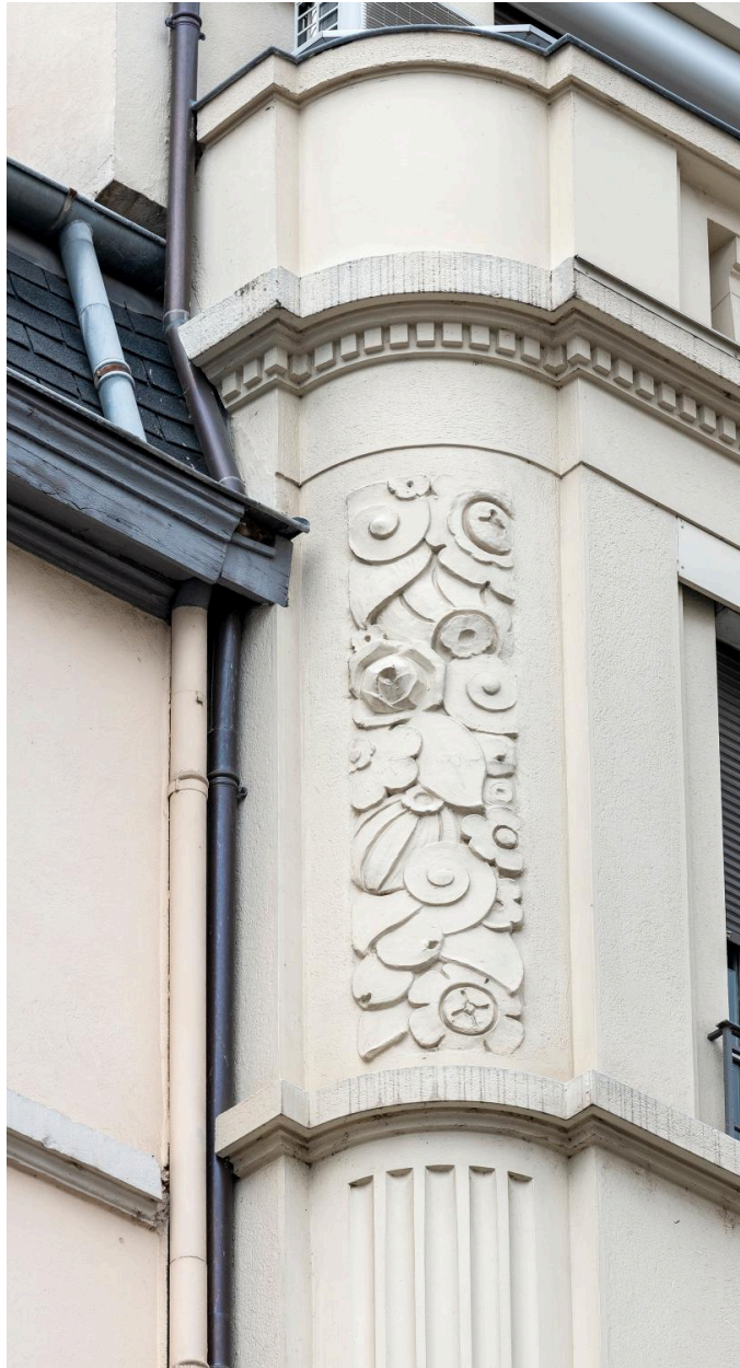
Détail du décor de la partie haute du surplomb