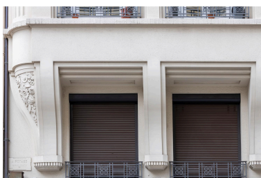
Vue partielle du premier étage carré