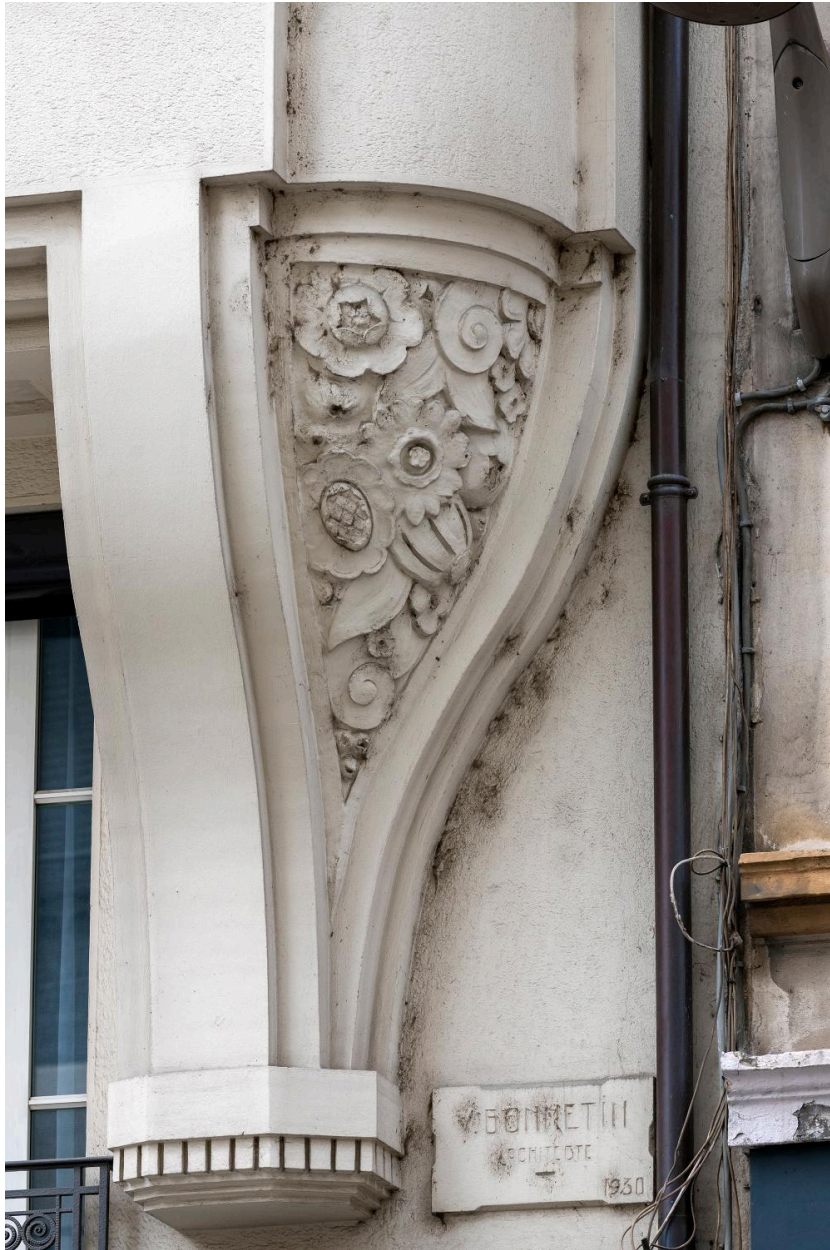
Détail de la base du surplomb, côté droit, avec la signature de V. Bonnetin architecte 1930