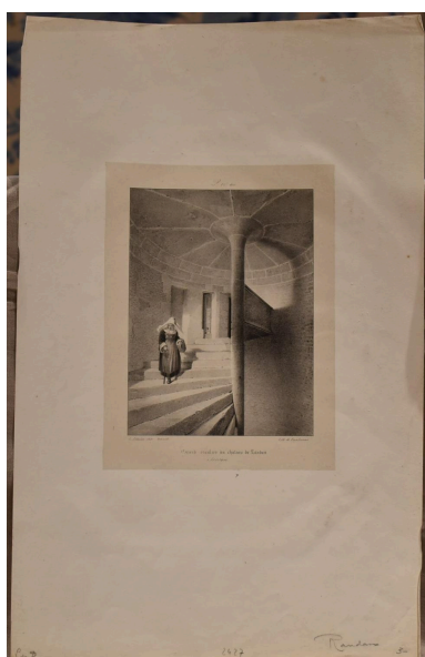
Vue générale