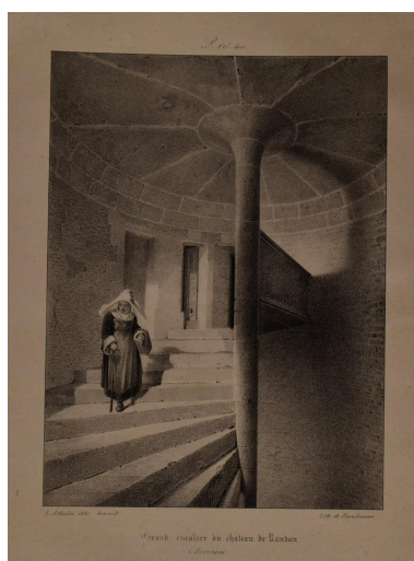
Gros plan IVR84_20216301047NUCA