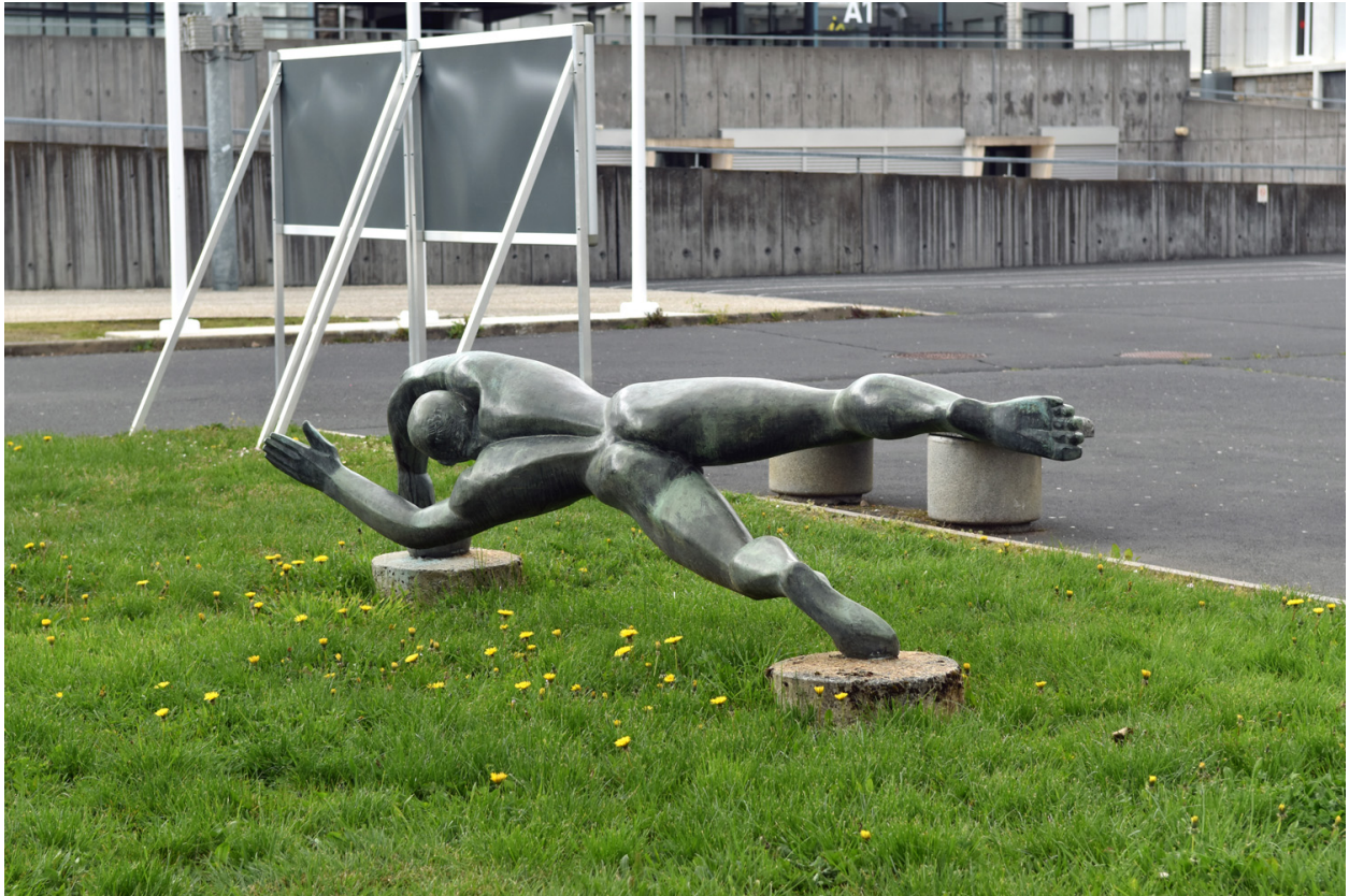
Autre vue de dos