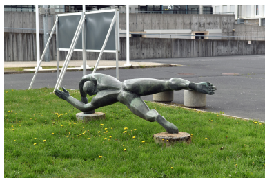
Autre vue de dos IVR84_20231500116NUCA