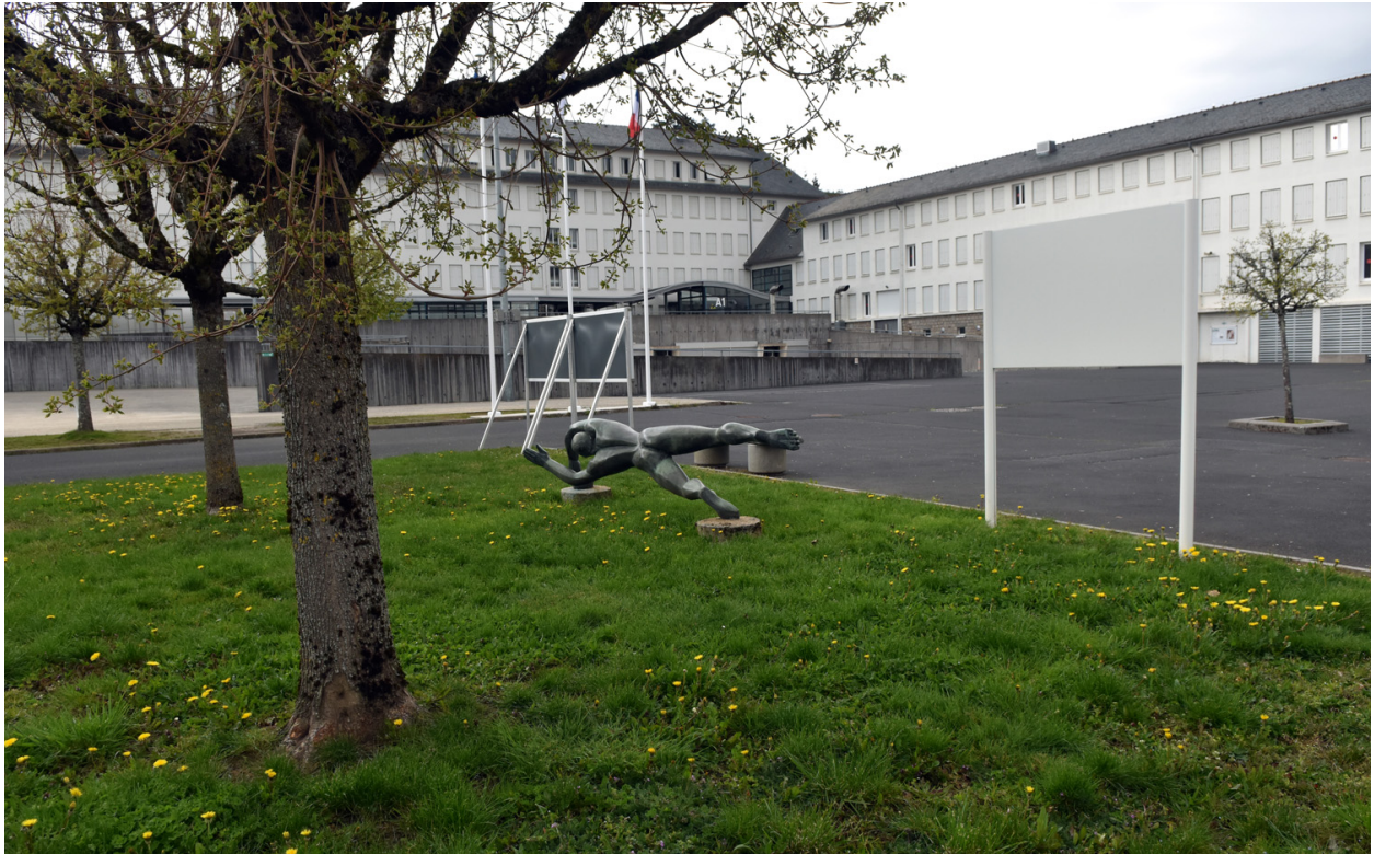
Vue d'ensemble, de dos