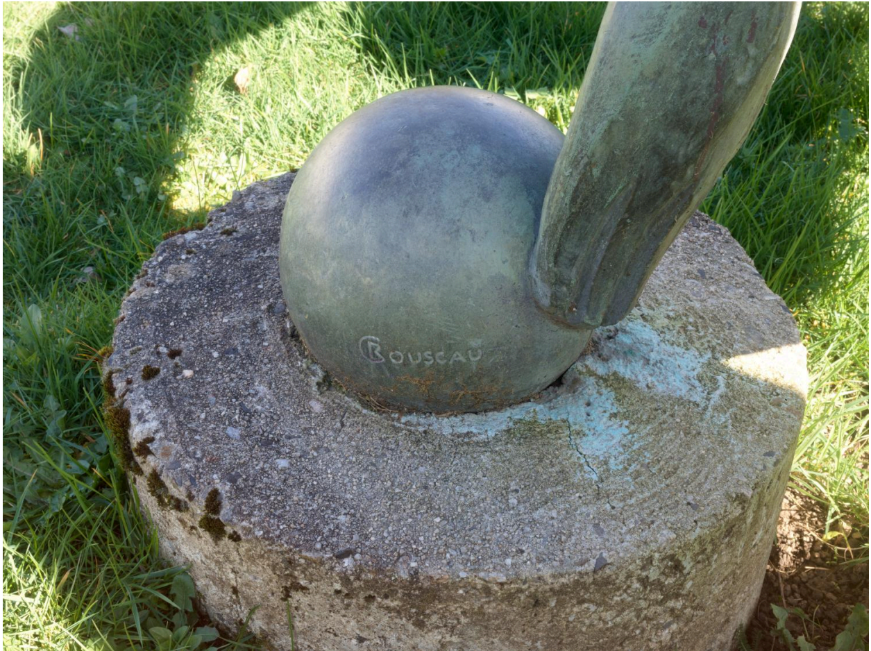
Détail : signature du sculpteur Claude Bouscau