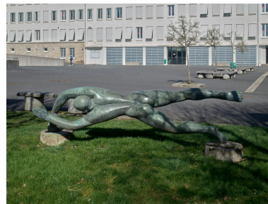
Vue de dos IVR84_20241500114NUCA