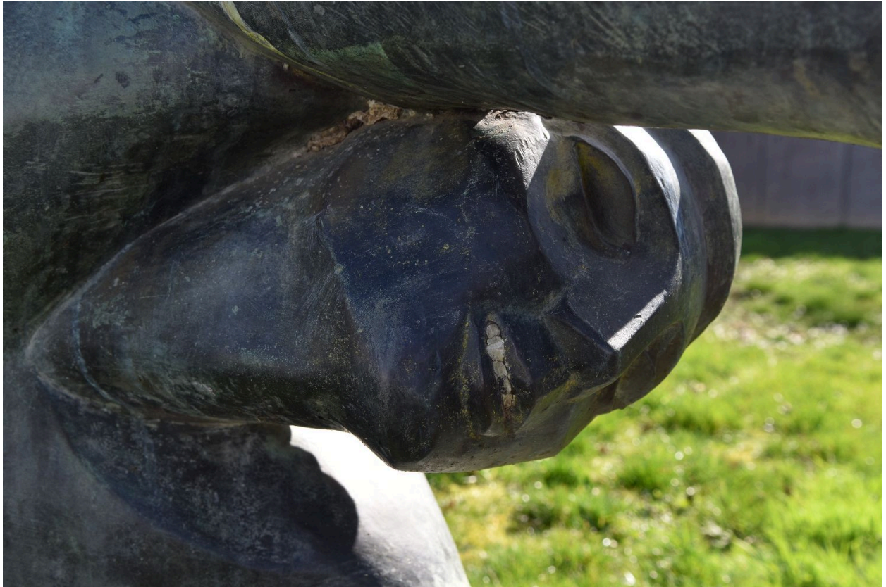
Détail du visage