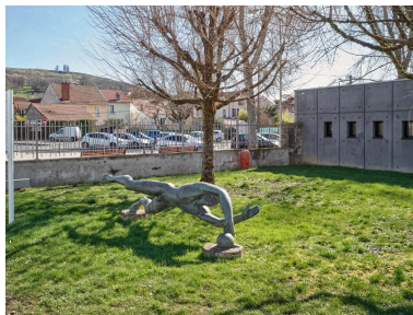
Vue de face IVR84_20241500117NUCA