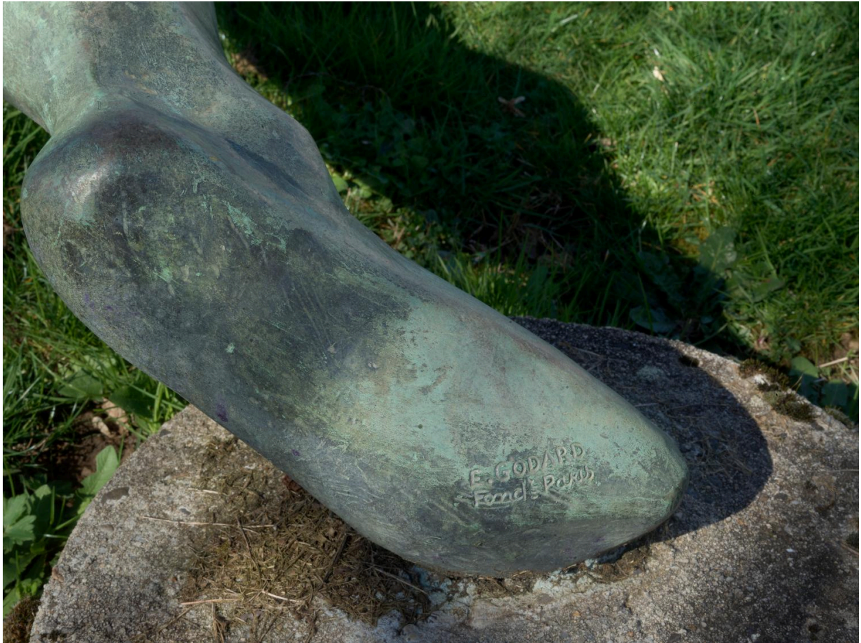
Détail : signature du fondeur Emile Godard