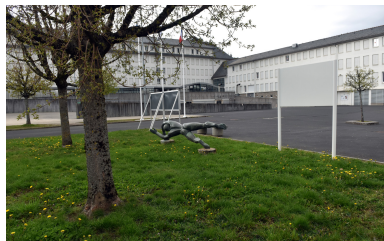
Vue d'ensemble, de dos IVR84_20231500117NUCA