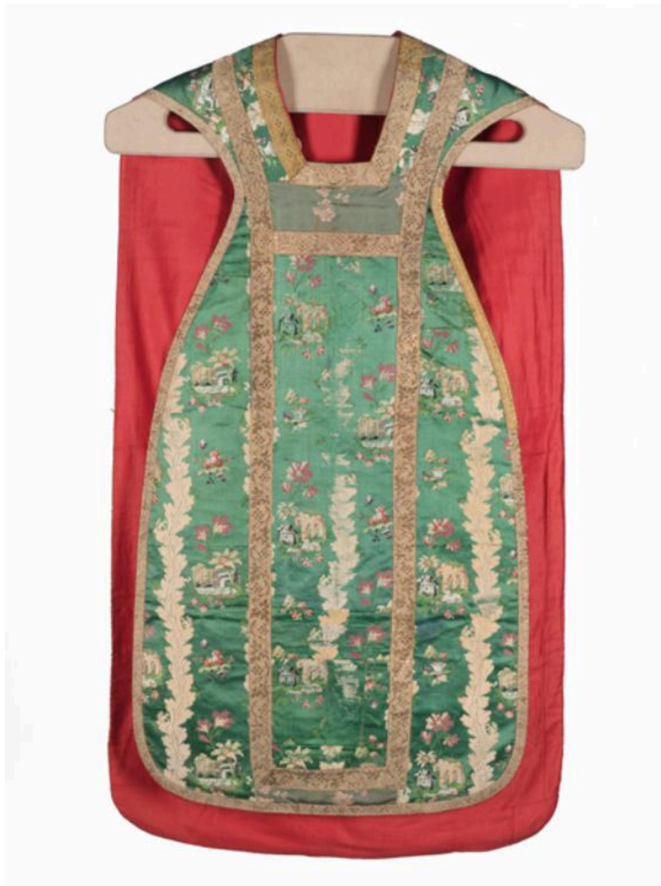
Devant de la chasuble, vue générale.