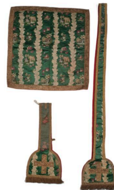
Vue générale de l'étole, du manipule, du voile de calice