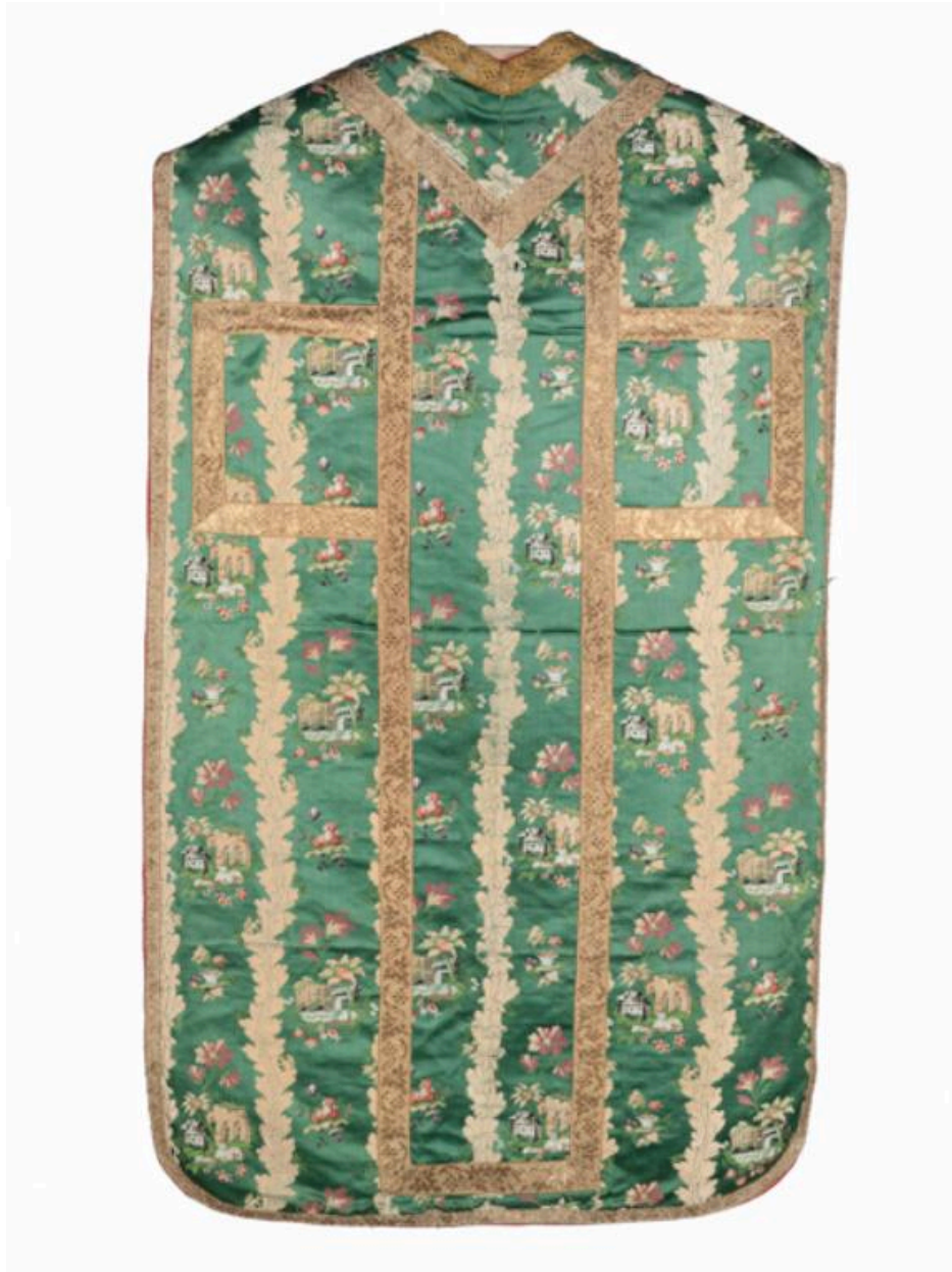
Vue générale du dos de la chasuble.