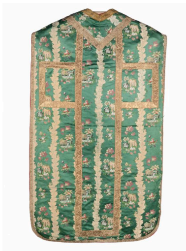
Vue générale du dos de la chasuble.