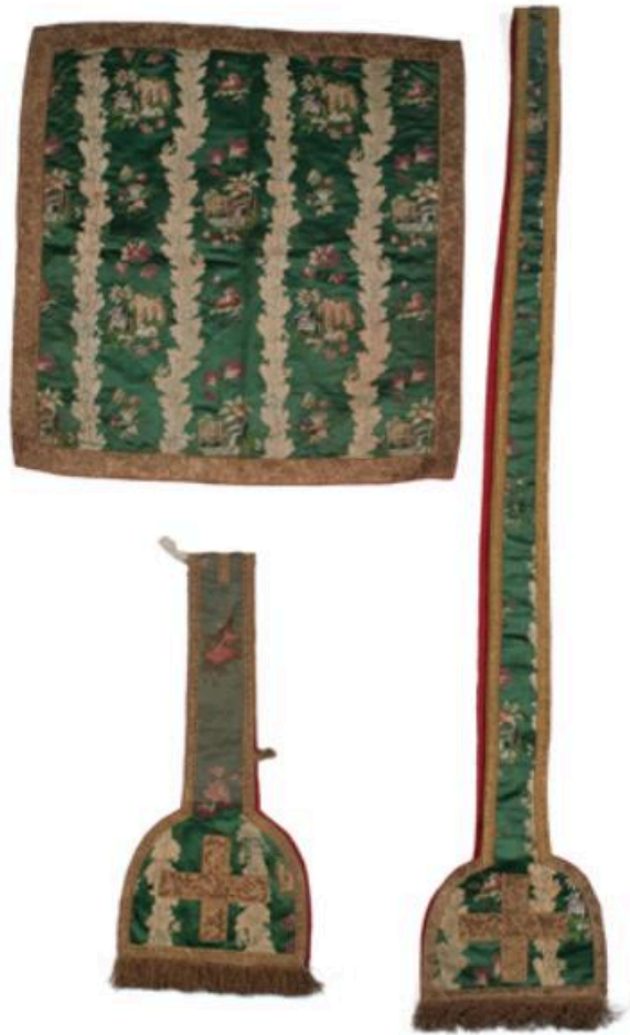
Vue générale de l'étole, du manipule, du voile de calice