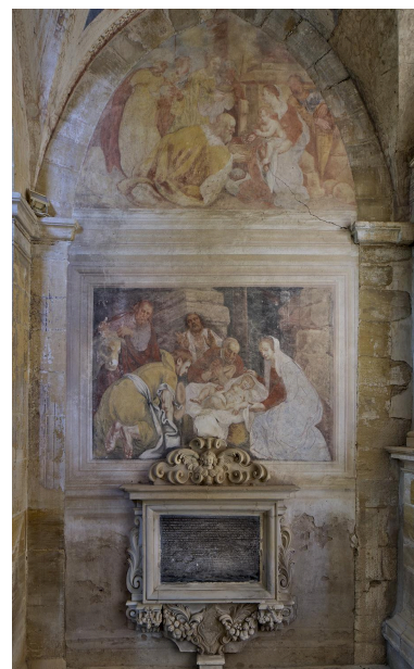
Chapelle de Néréstang, première travée, paroi de gauche : peintures monumentales l'Adoration des Mages et l'Adoration des Bergers IVR84_20234200272NUCA