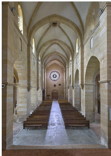
Vue intérieure de la nef, depuis le chœur IVR84_20234200299NUCAQ