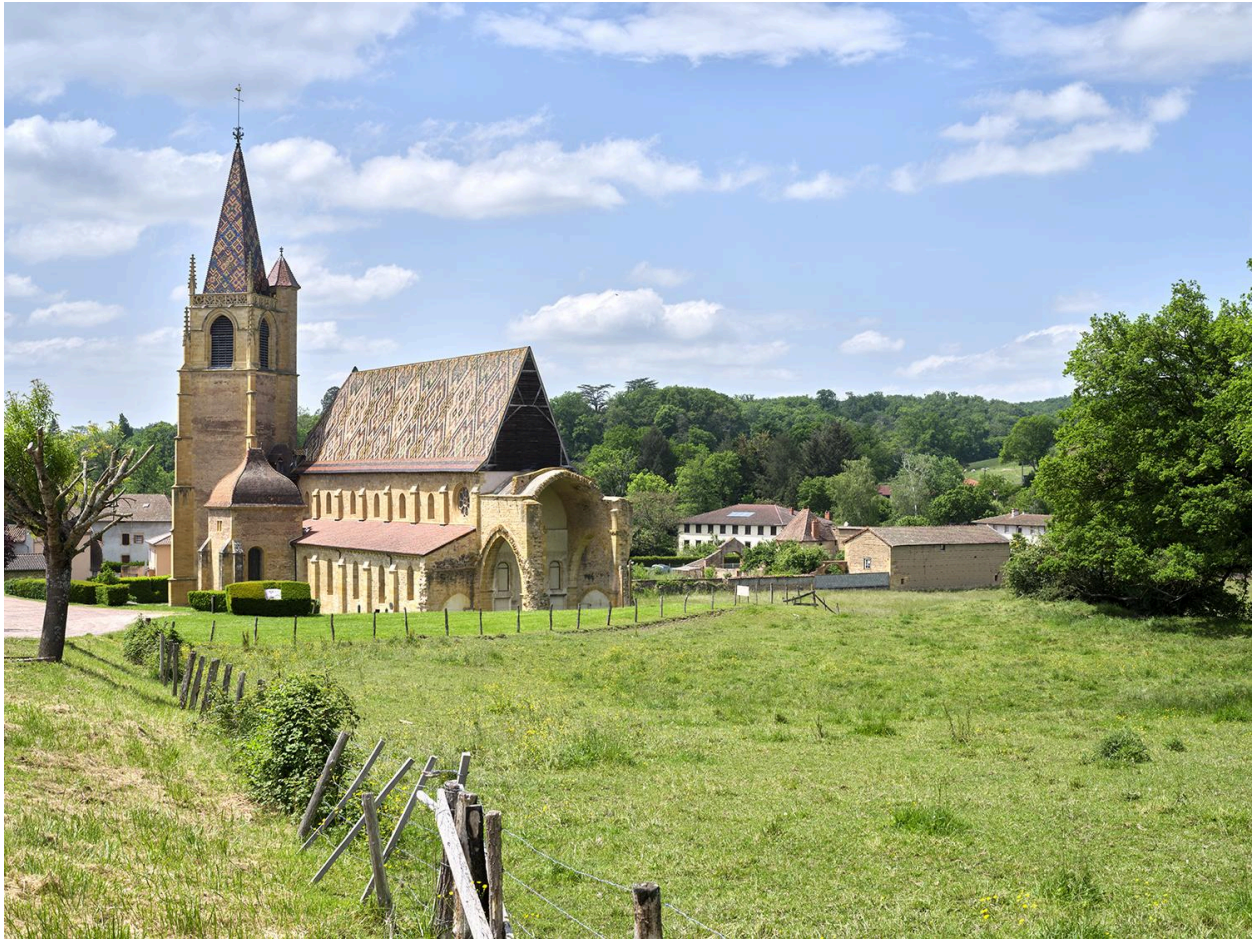
Vue de situation, depuis le nord-est