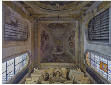
Chapelle de Nérestang, deuxième travée : peinture monumentale en trompe-l'oeil, l'Assomption de la Vierge