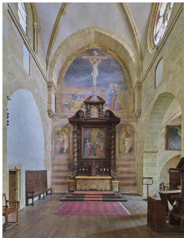
Vue générale du chœur, avec le retable de l'Annonciation (classé MH) et la peinture monumentale de la Crucifixion