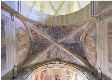
Chapelle de Nérestang, peintures monumentales de la voûte de la première travée : anges musiciens