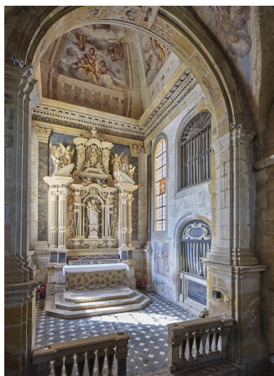
Chapelle de Néréstang, vue intérieure légèrement axée vers la droite