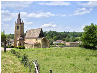
Vue de situation, depuis le nord-est