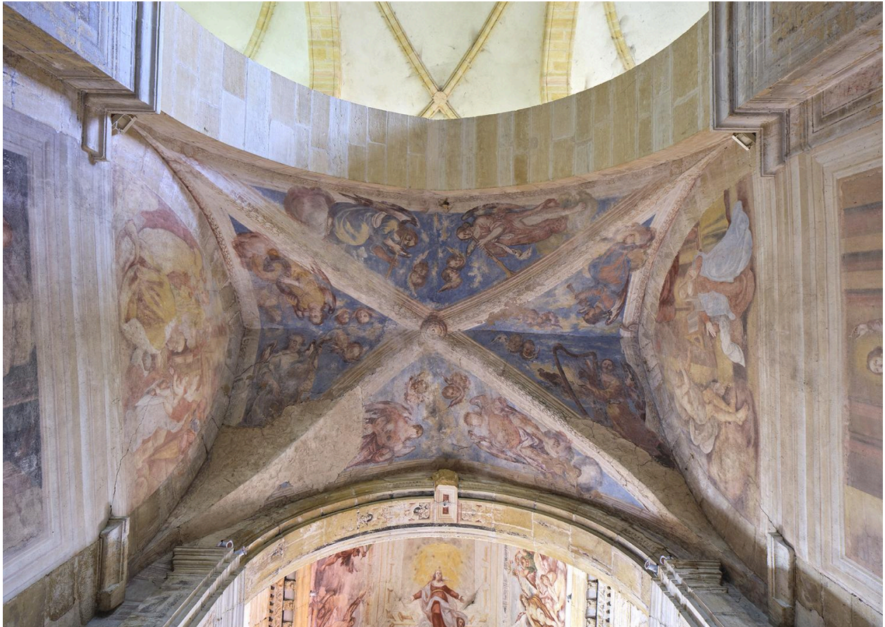
Chapelle de Nérestang, peintures monumentales de la voûte de la première travée : anges musiciens