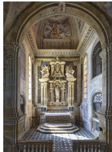
Chapelle de Néréstang, vue intérieure IVR84_20234200273NUCA