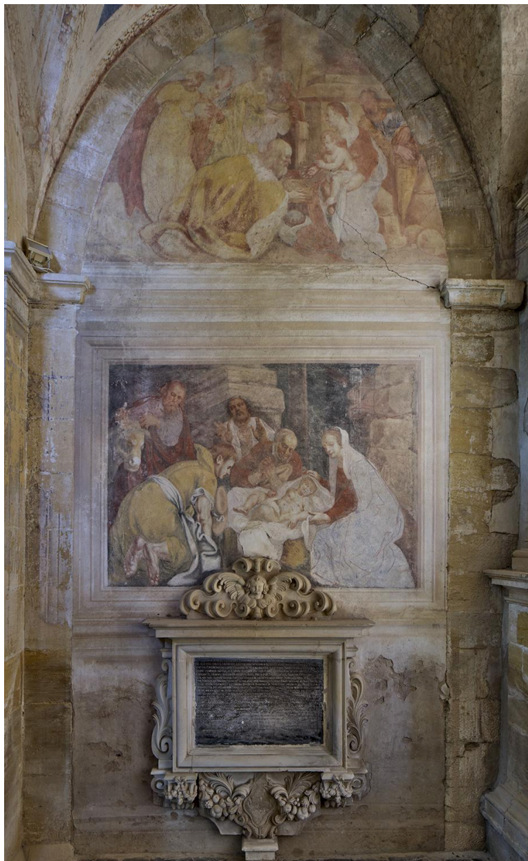
Chapelle de Nérestang, première travée, paroi de gauche : peintures monumentales l'Adoration des Mages et l'Adoration des Bergers