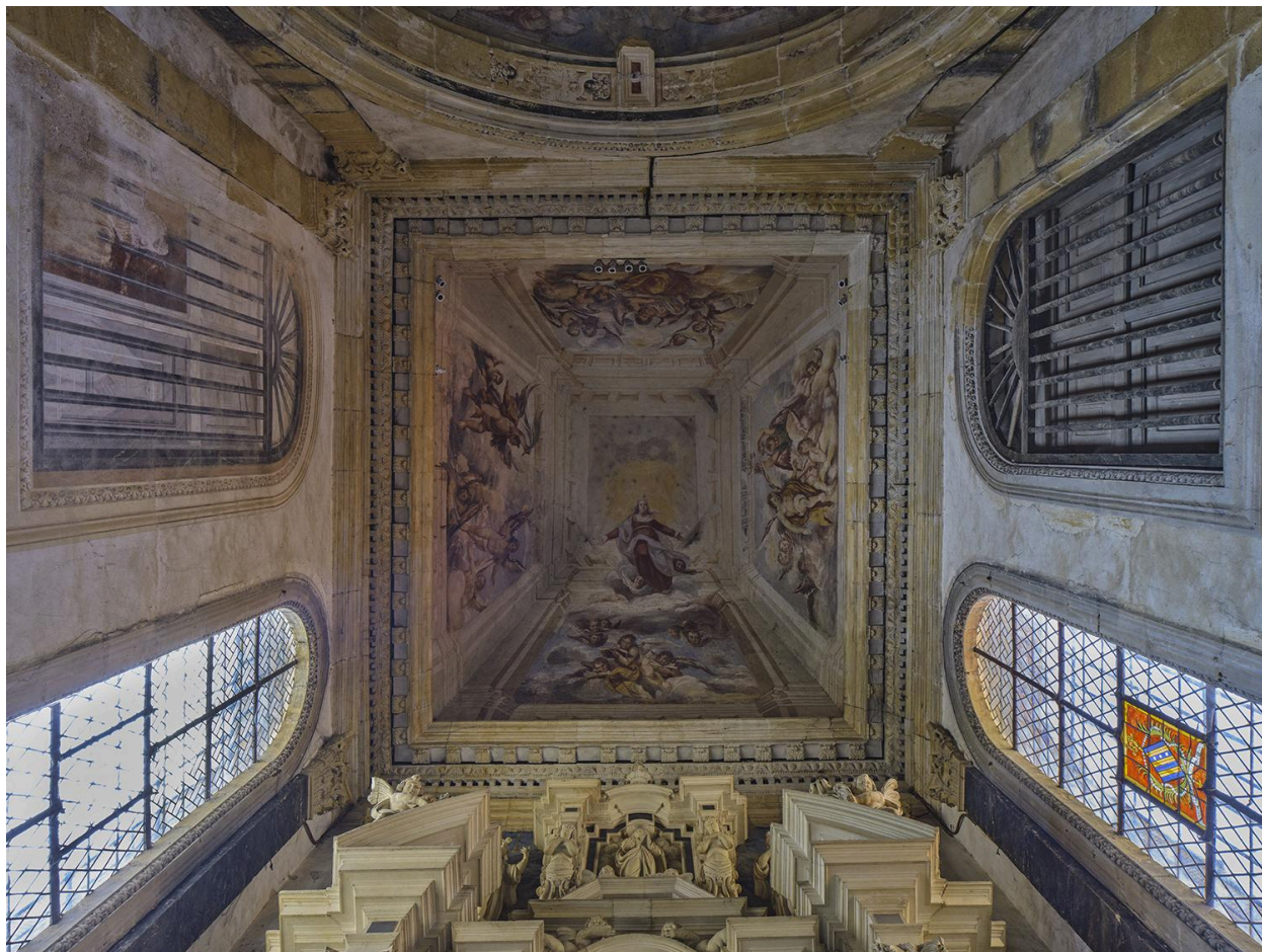
Chapelle de Nérestang, deuxième travée : peinture monumentale en trompe-l'oeil, l'Assomption de la Vierge