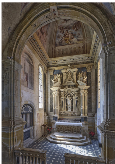
Chapelle de Néréstang, vue intérieure légèrement axée vers la gauche IVR84_20234200275NUCA