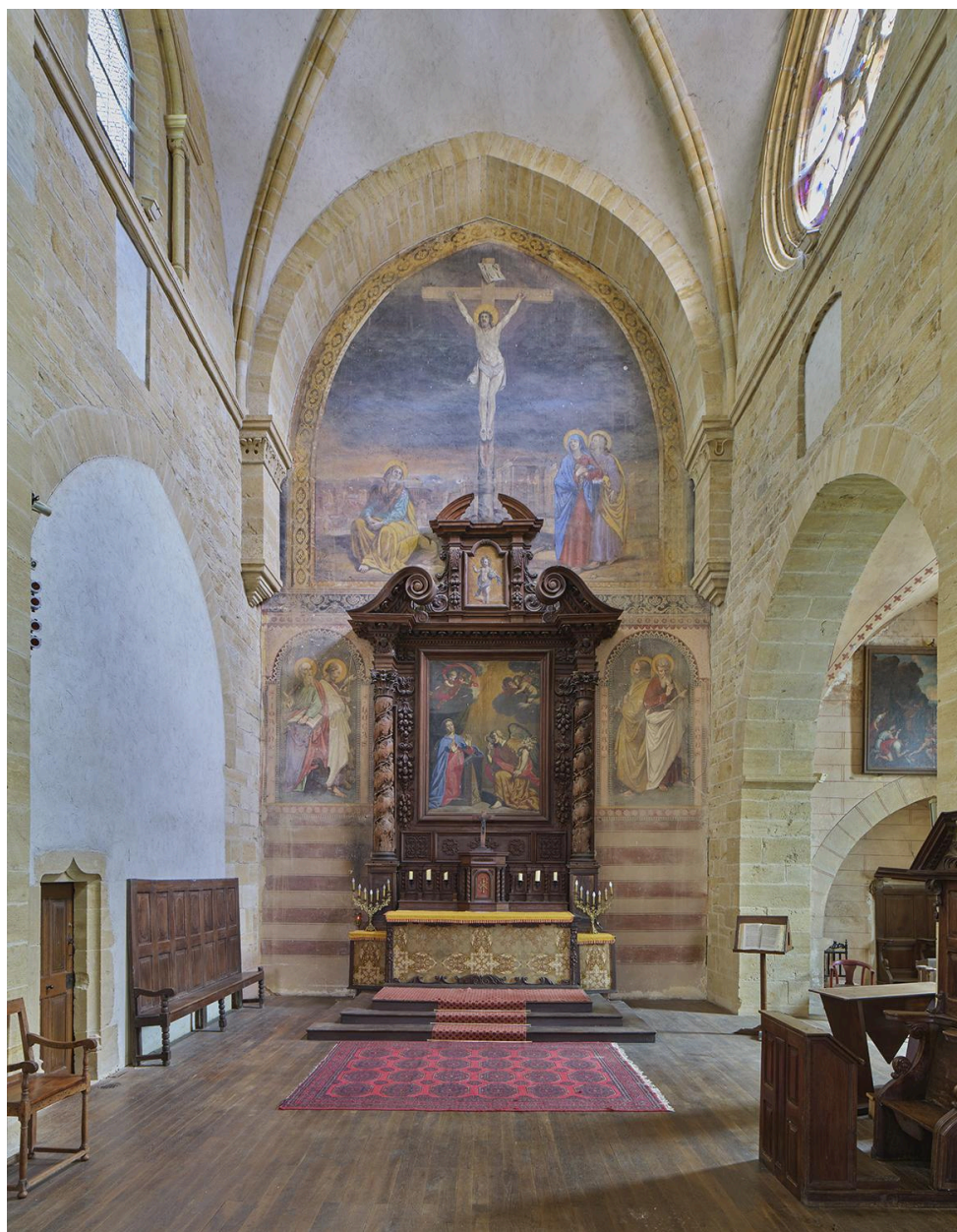
Vue générale du chœur, avec le retable de l'Annonciation (classé MH) et la peinture monumentale de la Crucifixion