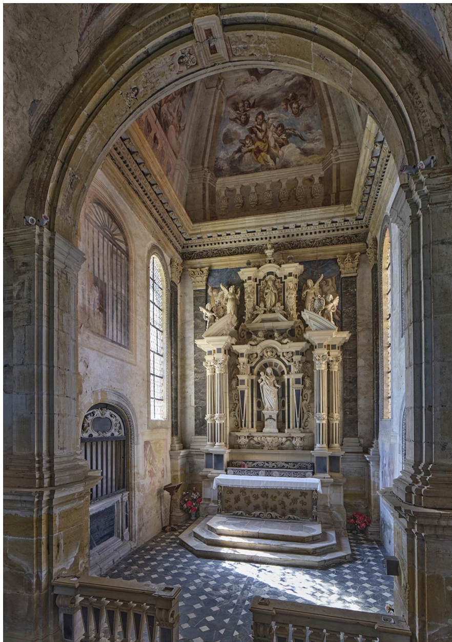
Chapelle de Nérestang, vue intérieure légèrement axée vers la gauche