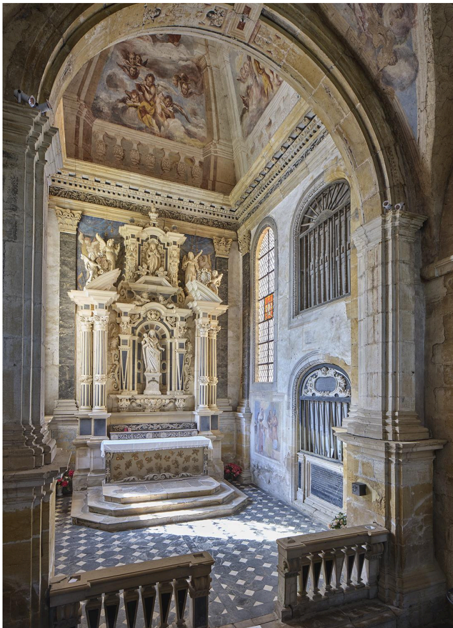
Chapelle de Nérestang, vue intérieure légèrement axée vers la droite