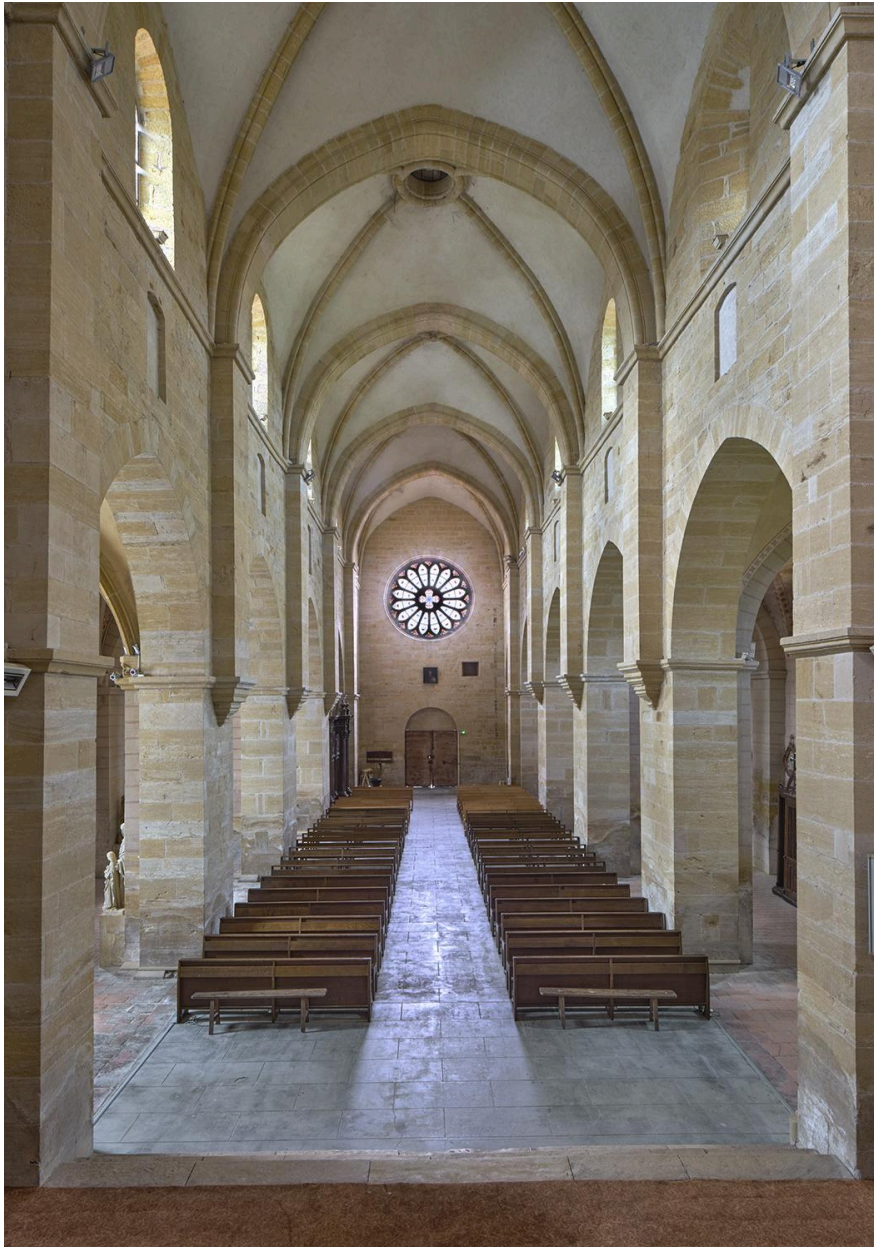
Vue intérieure de la nef, depuis le chœur