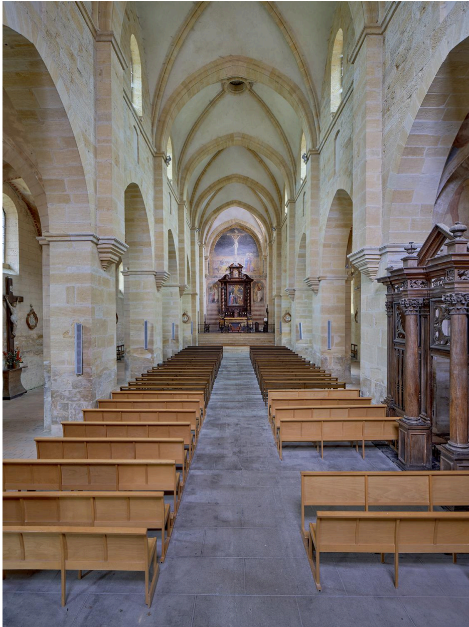
Vue intérieure de la nef, depuis l'entrée