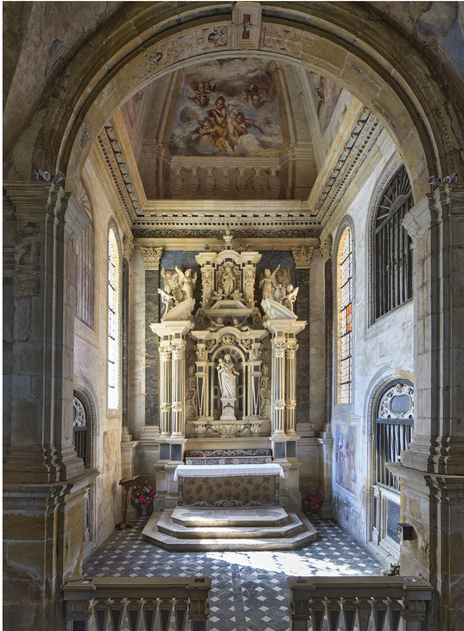
Chapelle de Nérestang, vue intérieure