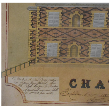
Détail bas gauche IVR84_20216300493NUCA