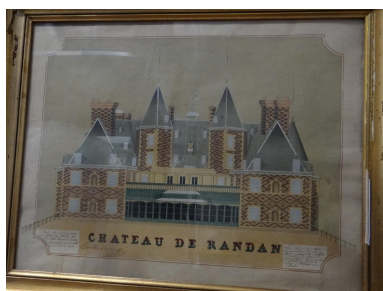
Vue générale IVR84_20216300492NUCA