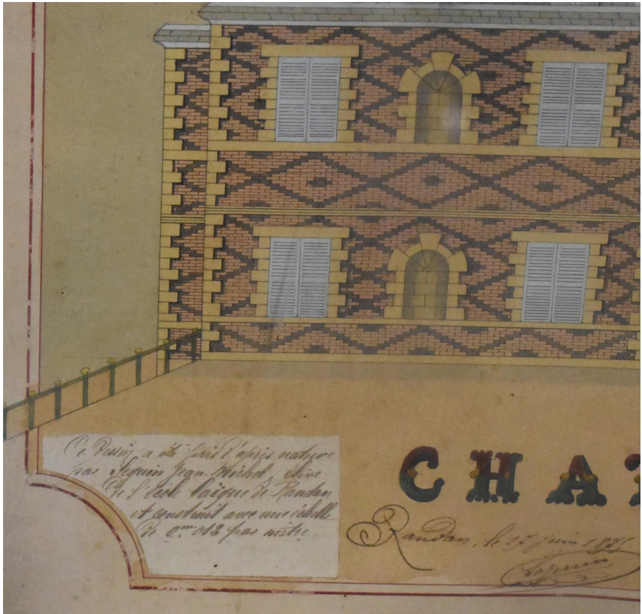
Détail bas gauche