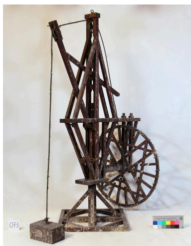
Modèle de grue, vue de côté