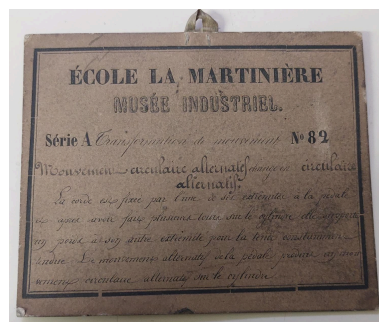
Cartel objet B49 IVR84_20256902045NUCA