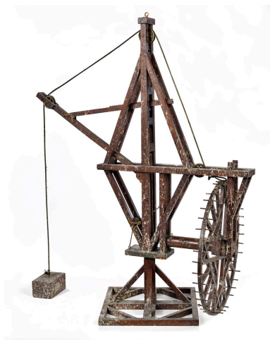
Grue, vue 1 IVR84_20256901851NUCA