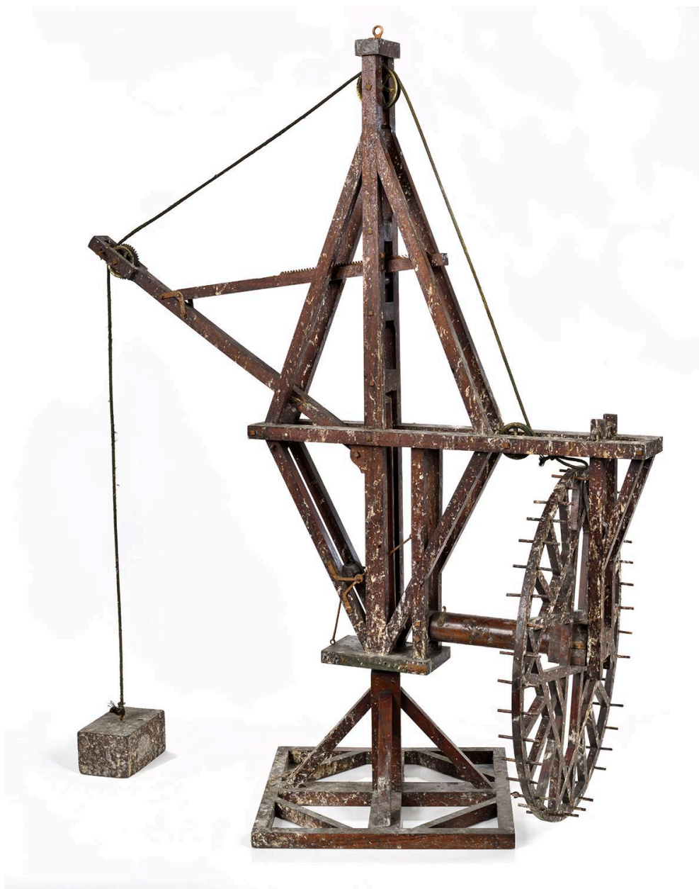
Grue, vue 1