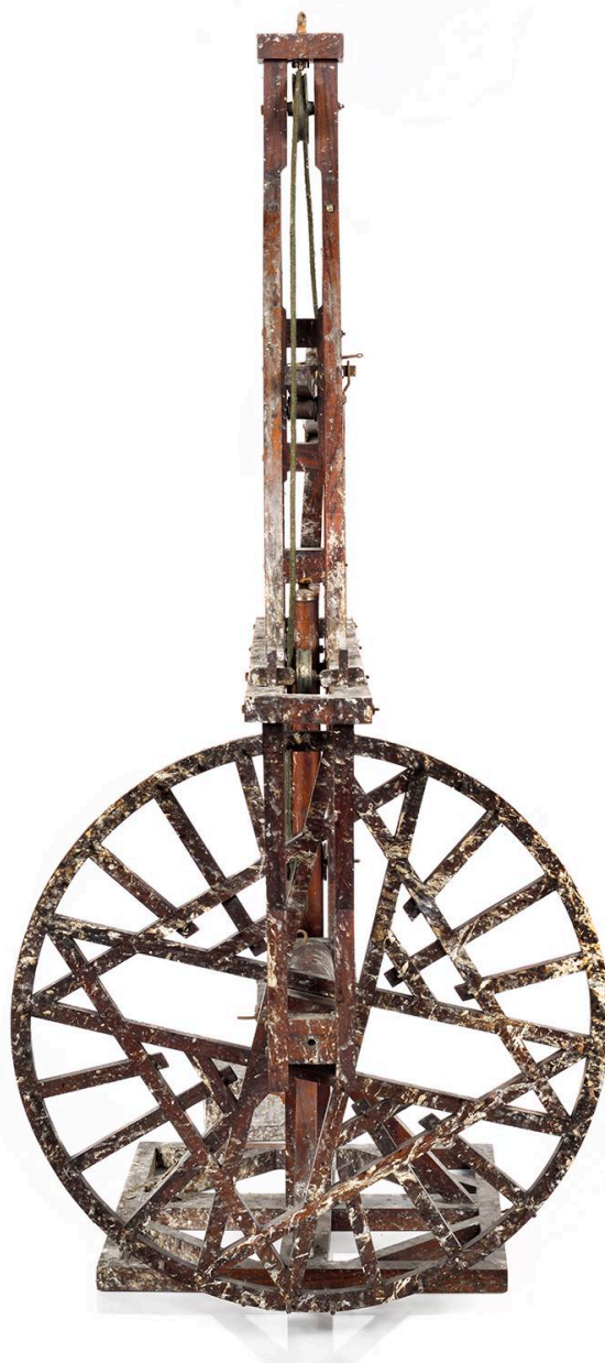
Grue, vue 2