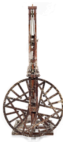
Grue, vue 2 IVR84_20256901850NUCA