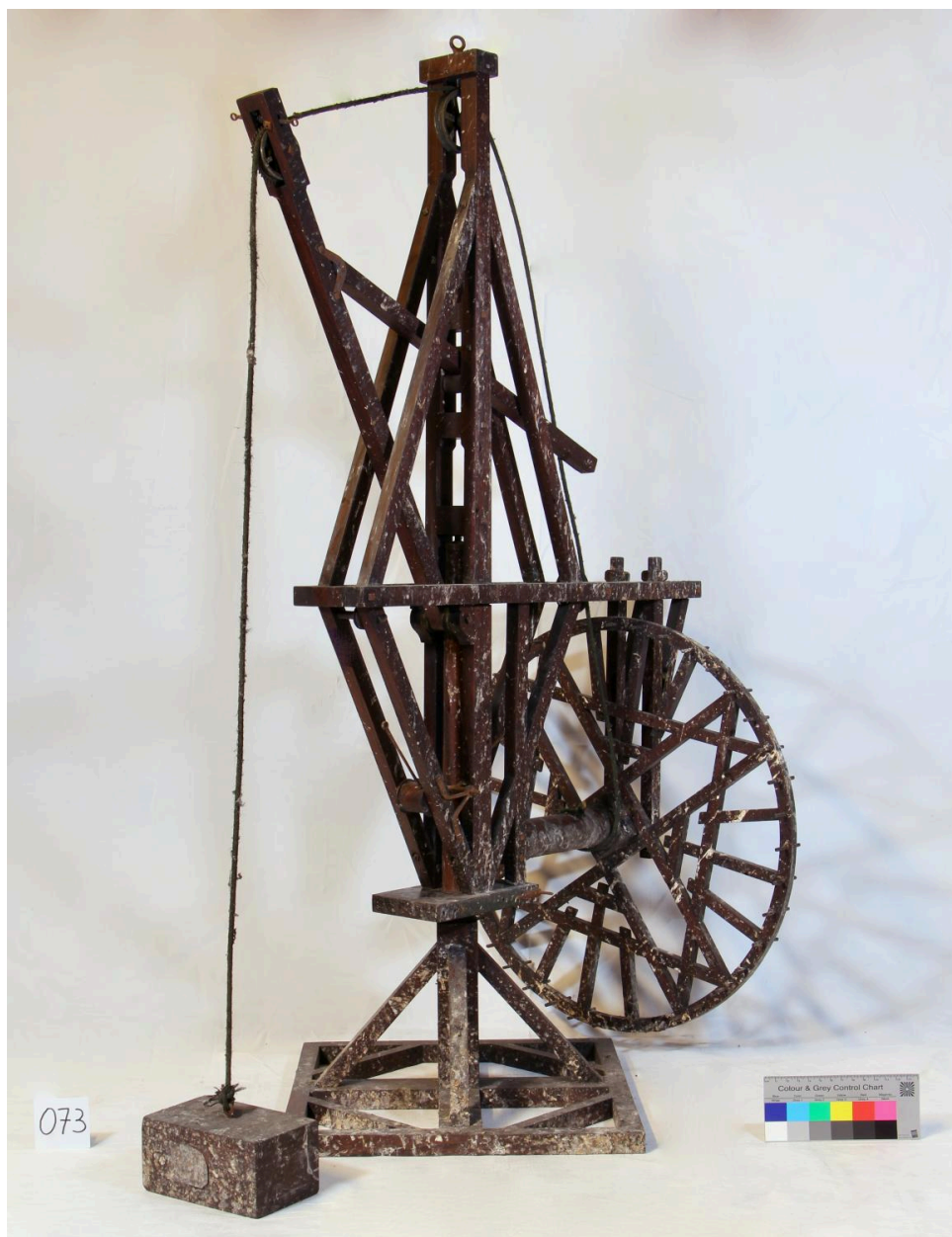
Modèle de grue, vue de côté