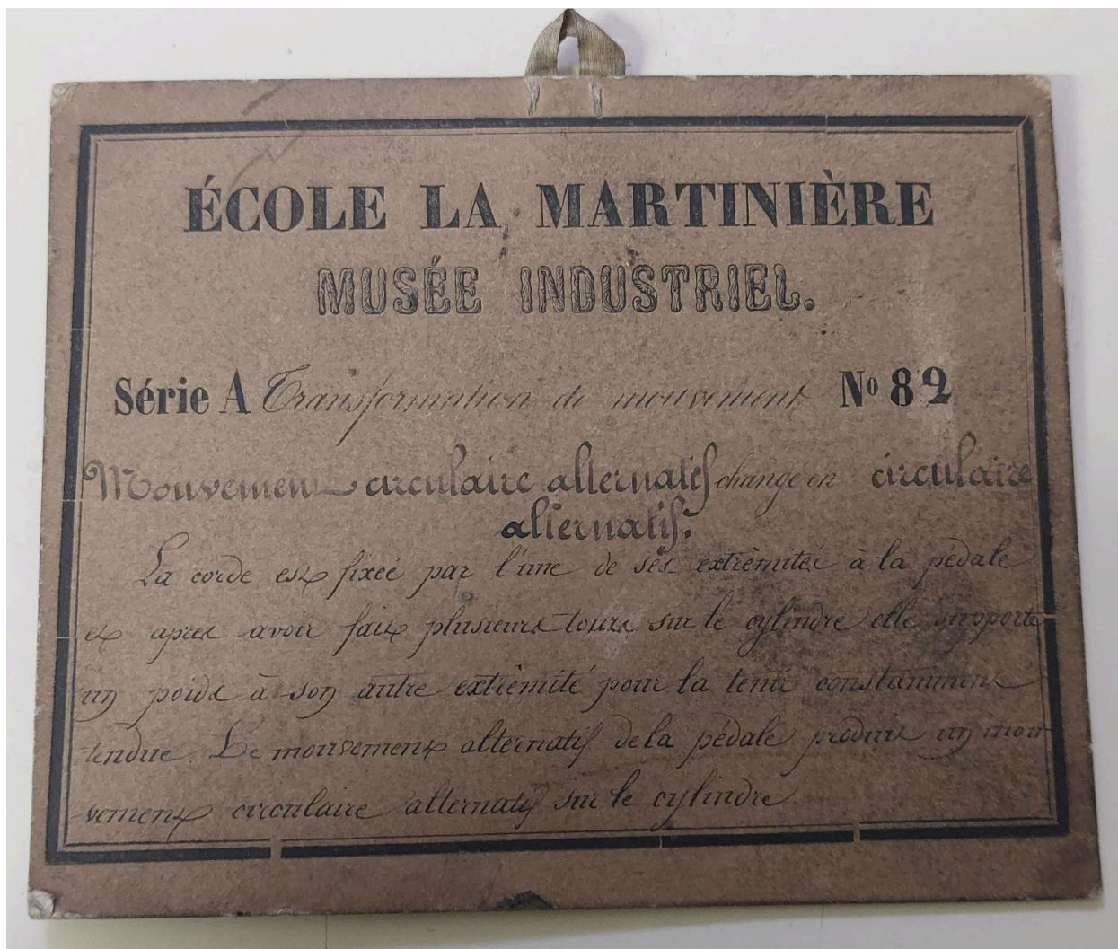
Cartel objet B49