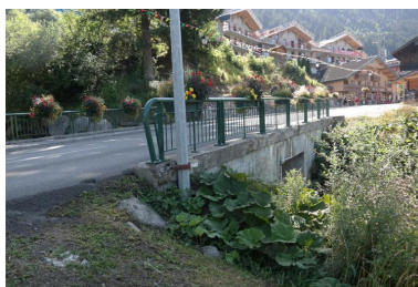
Vue générale du pont de Fiolle IVR84_20197401202NUCA