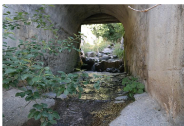
Pont de Fiolle, vue de dessous IVR84_20207400944NUCA