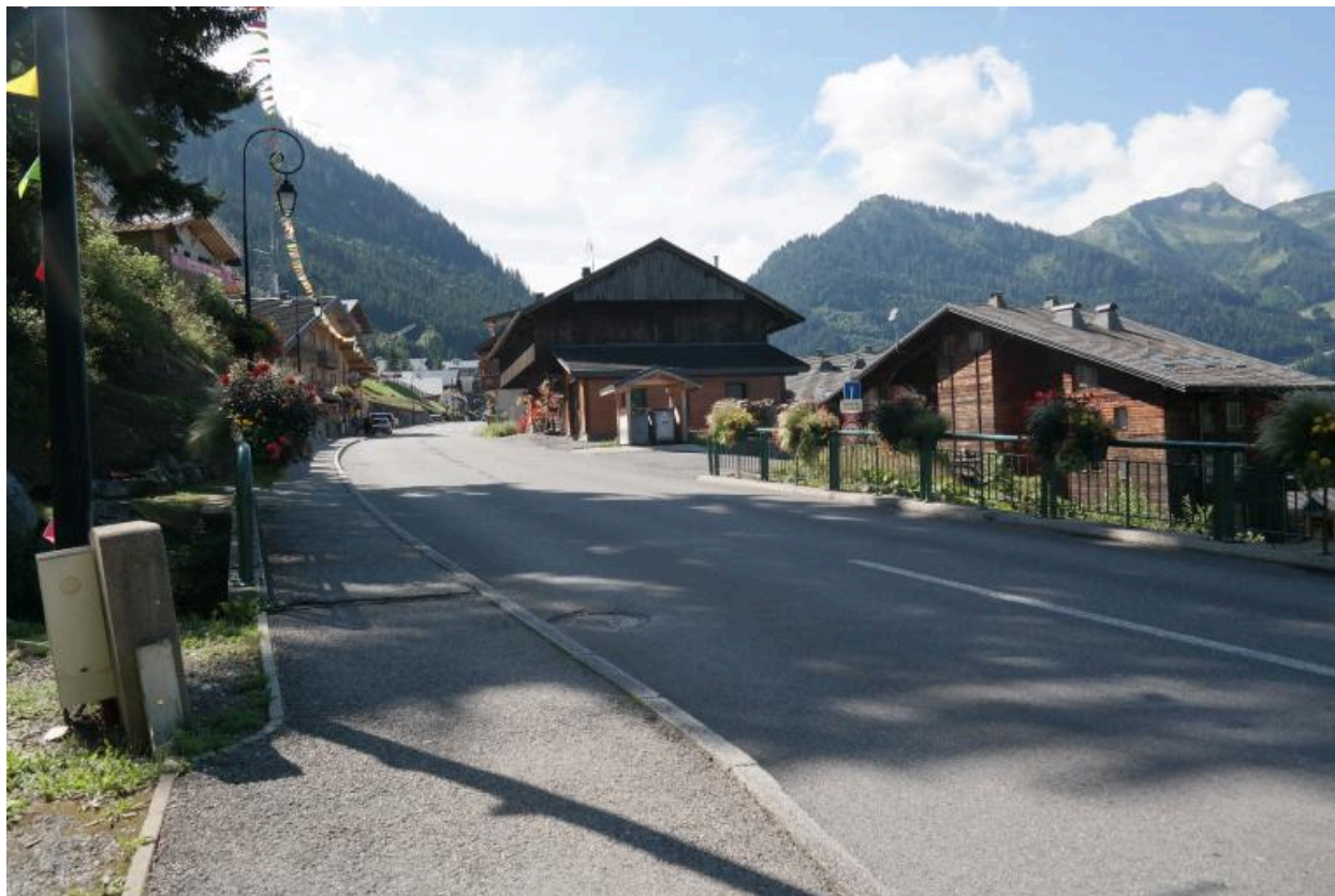
Pont de Fiolle, contexte et revêtement