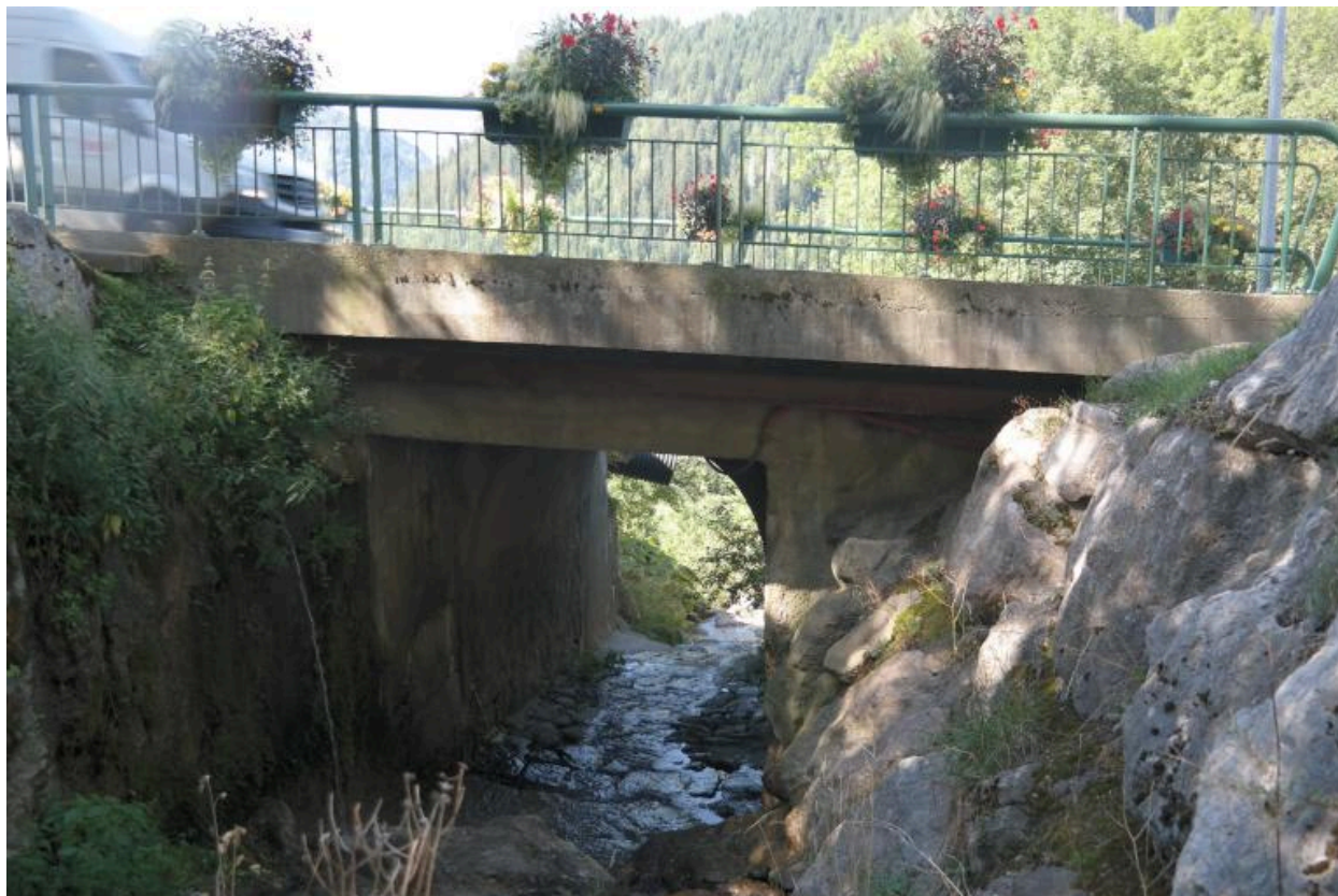
Pont de Fiolle, face amont