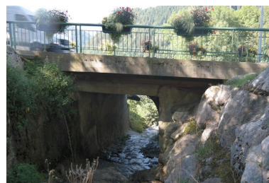
Pont de Fiolle, face amont