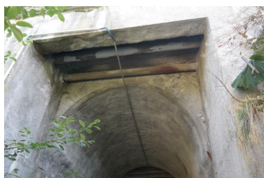
Pont de Fiolle, face aval IVR84_20207400943NUCA