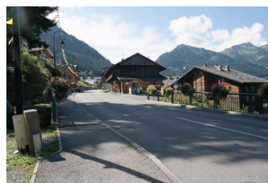
Pont de Fiolle, contexte et revêtement IVR84_20207400945NUCA