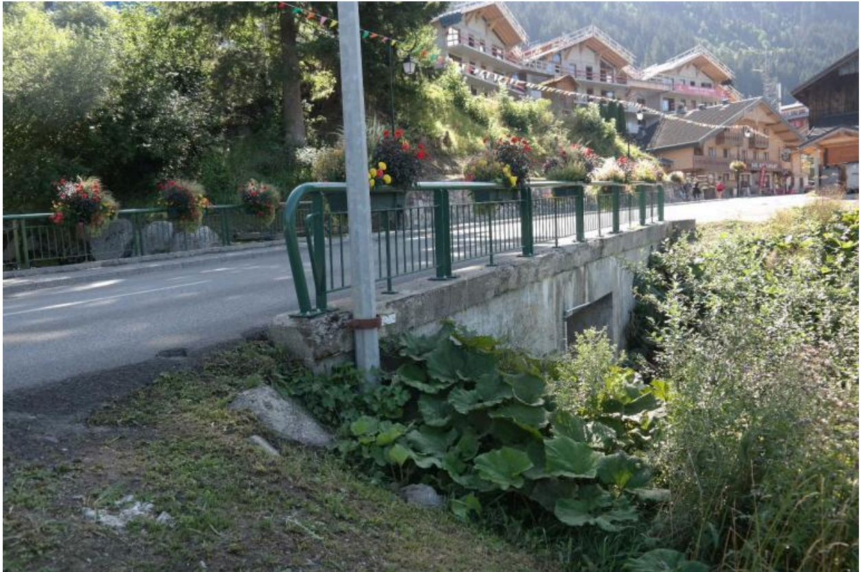
Vue générale du pont de Fiolle