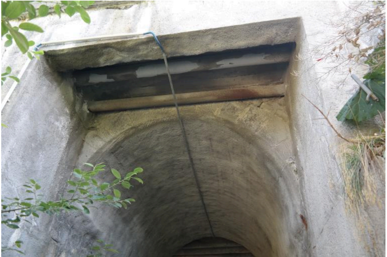
Pont de Fiolle, face aval