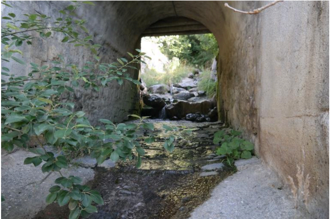
Pont de Fiolle, vue de dessous