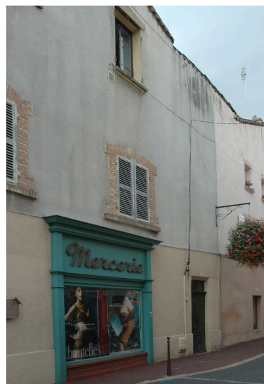
Vue partielle de l'élévation latérale, porte piétonne donnant sur l'ancienne venelle.