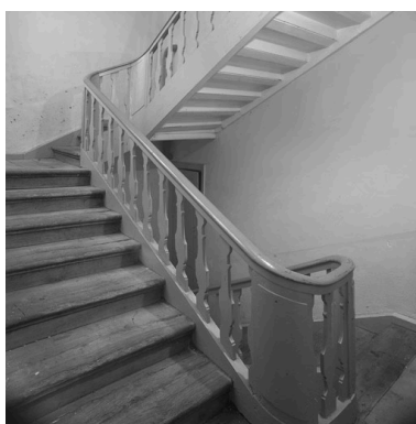
Vue partielle de l'escalier tournant à retours avec jour et rampe en bois découpé.