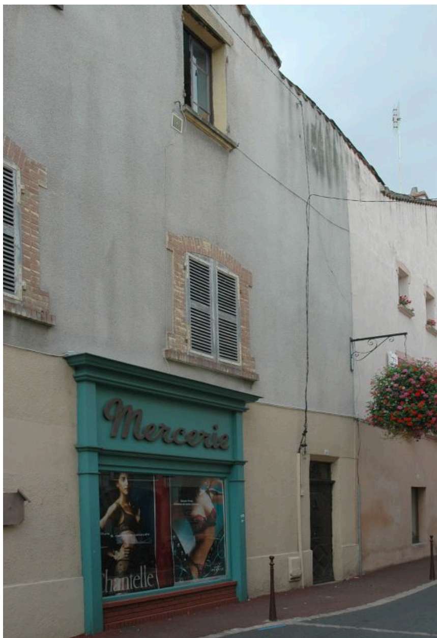
Vue partielle de l'élévation latérale, porte piétonne donnant sur l'ancienne venelle.