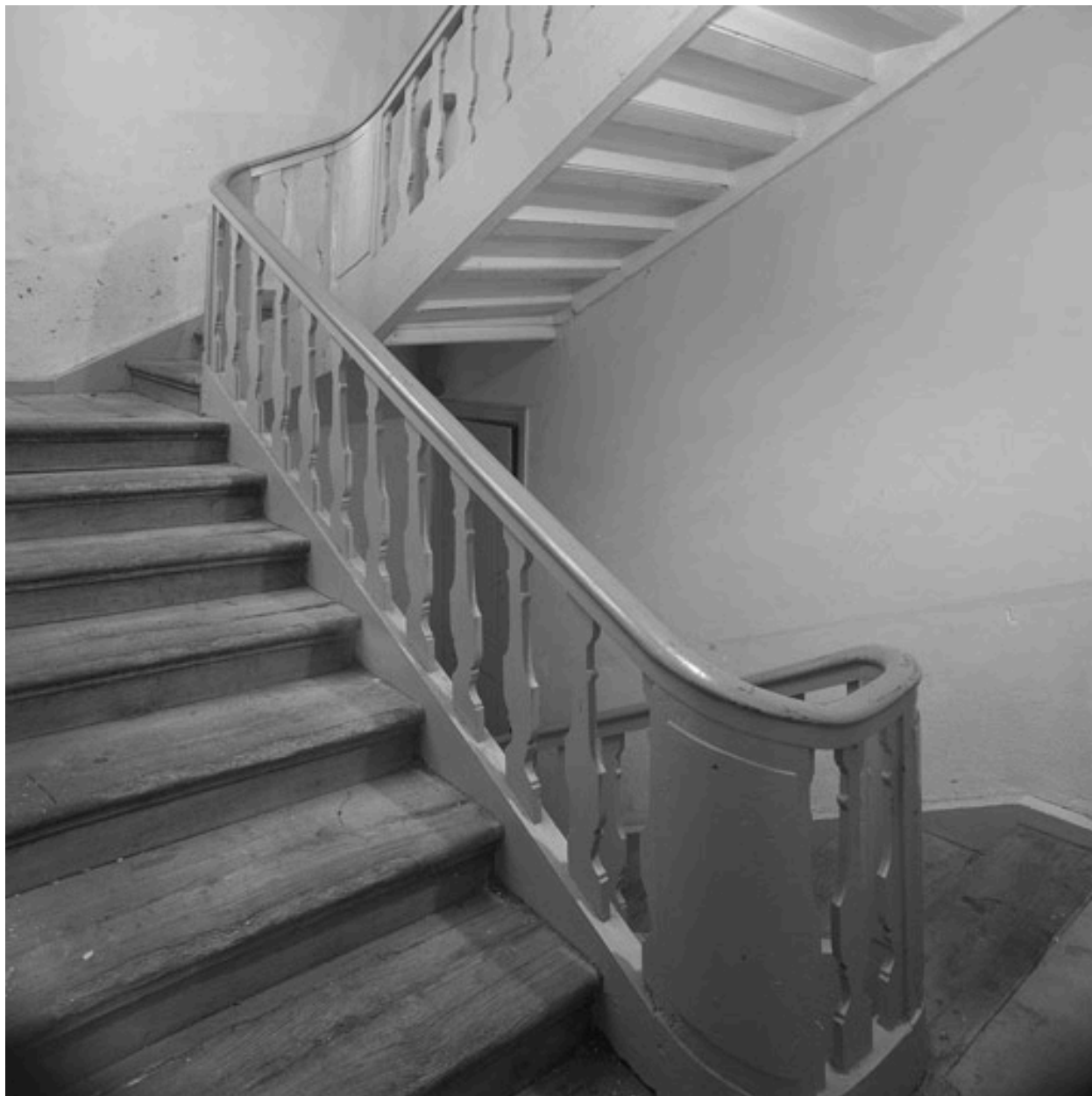
Vue partielle de l'escalier tournant à retours avec jour et rampe en bois découpé.