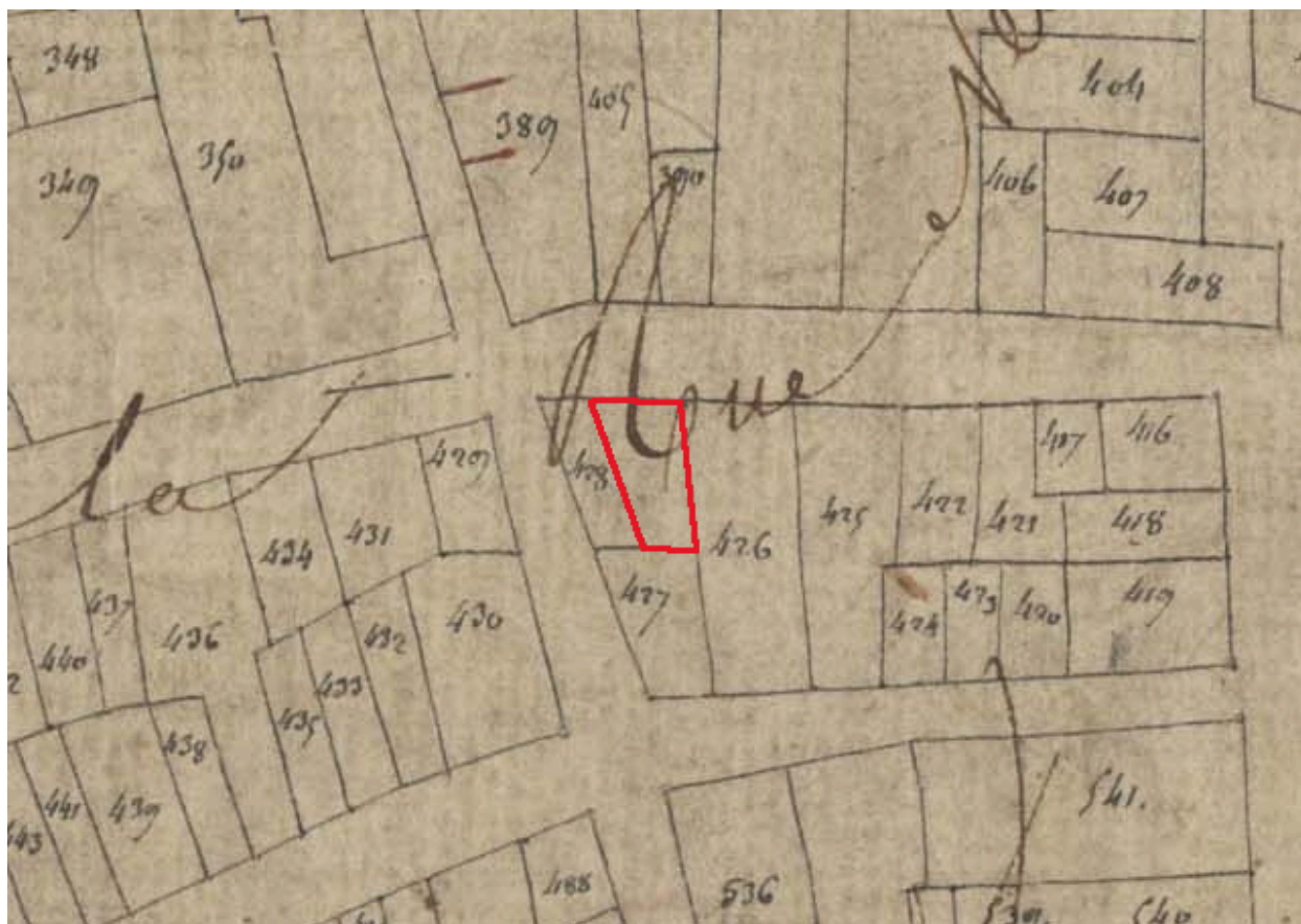
Extrait du plan cadastral de 1809, parcelle E 427 (partie est).