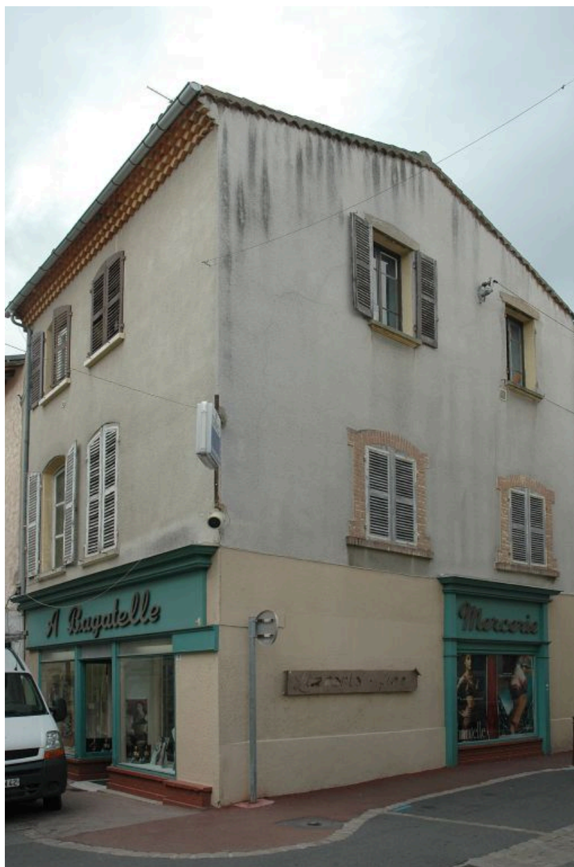
Vue générale de trois-quarts.