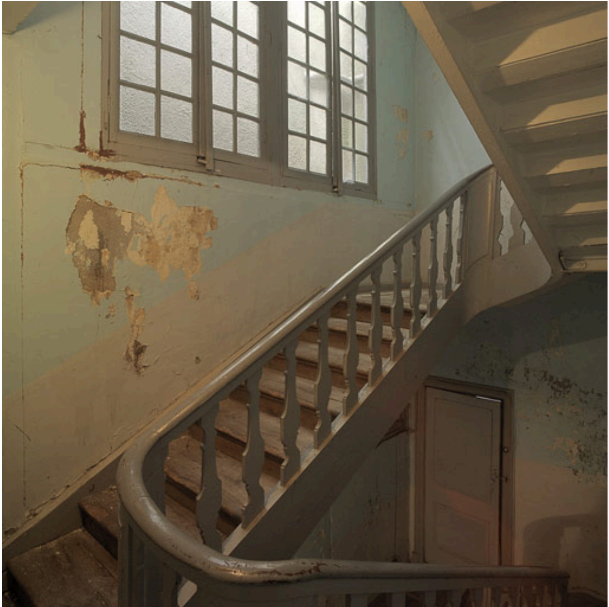
Vue partielle de la cage d'escalier.