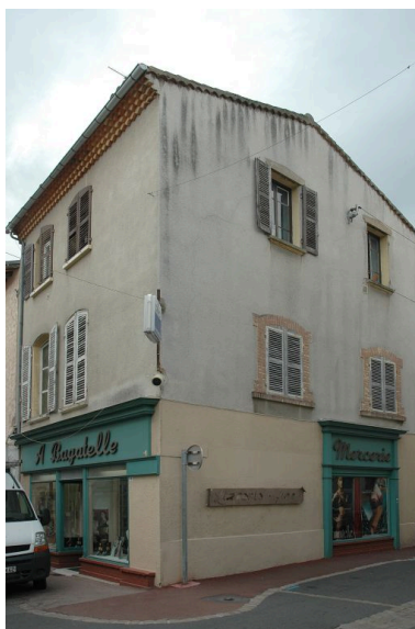
Vue générale de trois-quarts. IVR82_20134200574NUCA