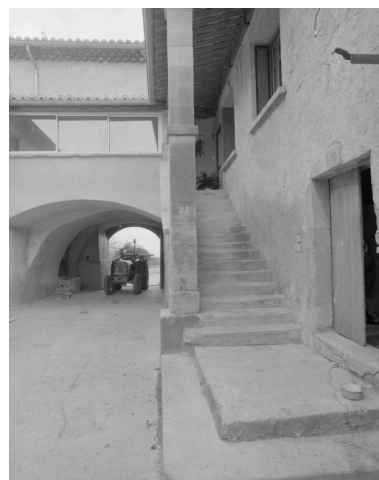
Les logis ancien et moderne, vus depuis la cour.