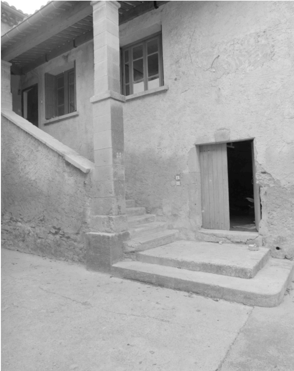
L'escalier conduisant au logis à l'étage.