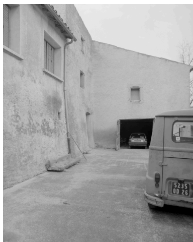
Vue partielle de la cour. IVR82_19982601043X