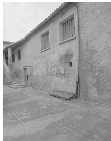
Une partie de l'élévation sur cour (logis).