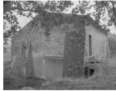
Une partie des dépendances, à l'extrémité nord-est. IVR82_19982601038X