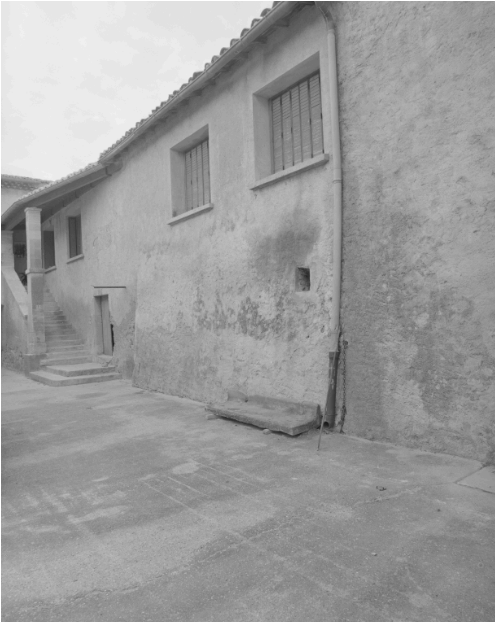
Une partie de l'élévation sur cour (logis).