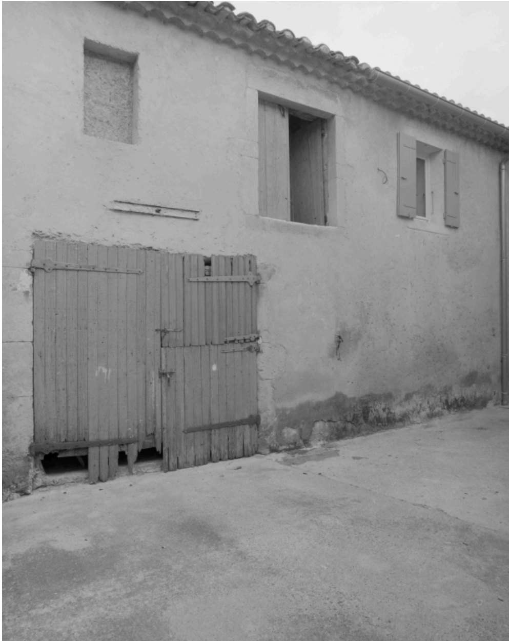
Vue de l'écurie et du fenil donnant sur la cour.