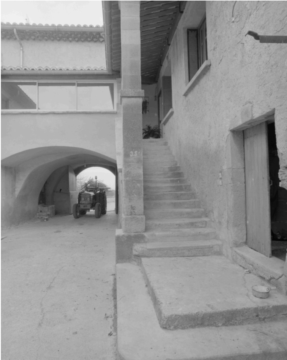
Les logis ancien et moderne, vus depuis la cour.