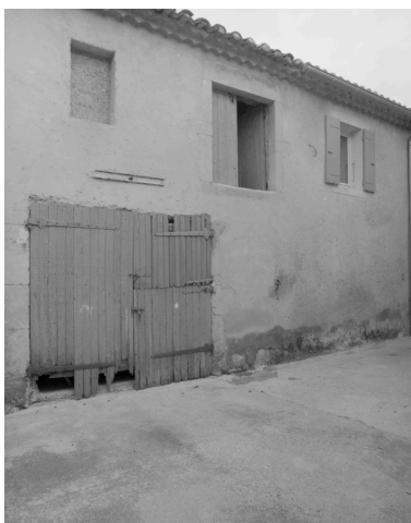
Vue de l'écurie et du fenil donnant sur la cour. IVR82_19982601045X