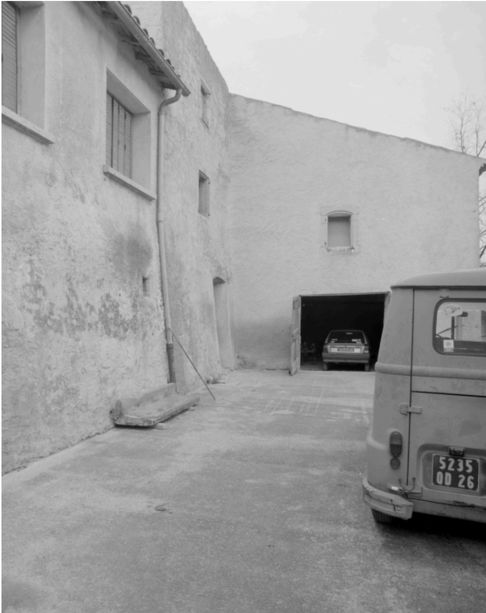
Vue partielle de la cour.