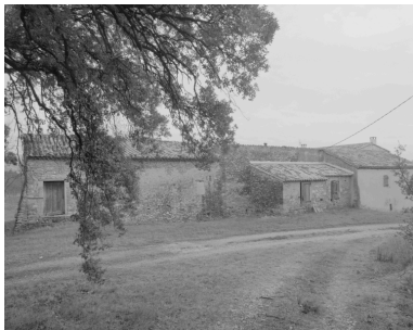
Elévation postérieure (nord-ouest) de la ferme. IVR82_19982601039X