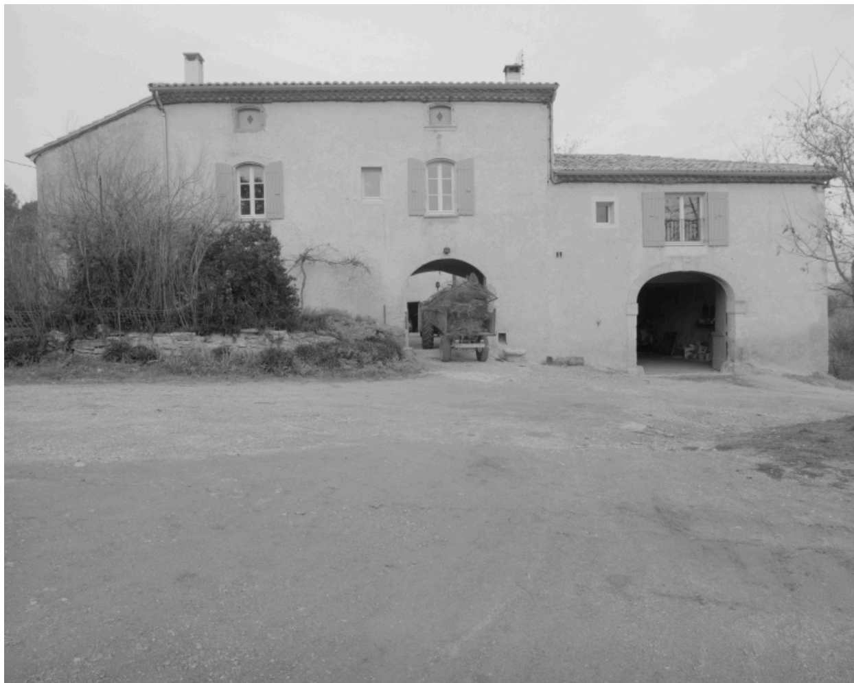
Elévation antérieure, au sud-ouest.