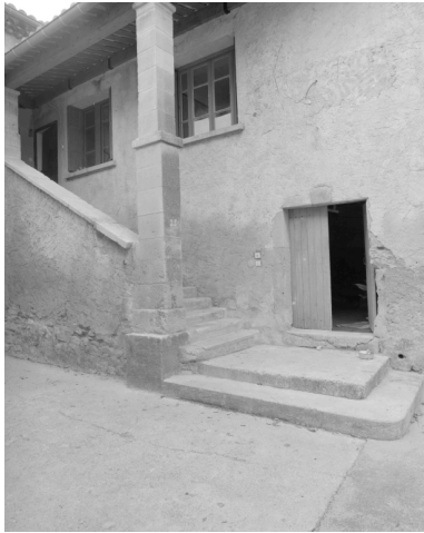
L'escalier conduisant au logis à l'étage.