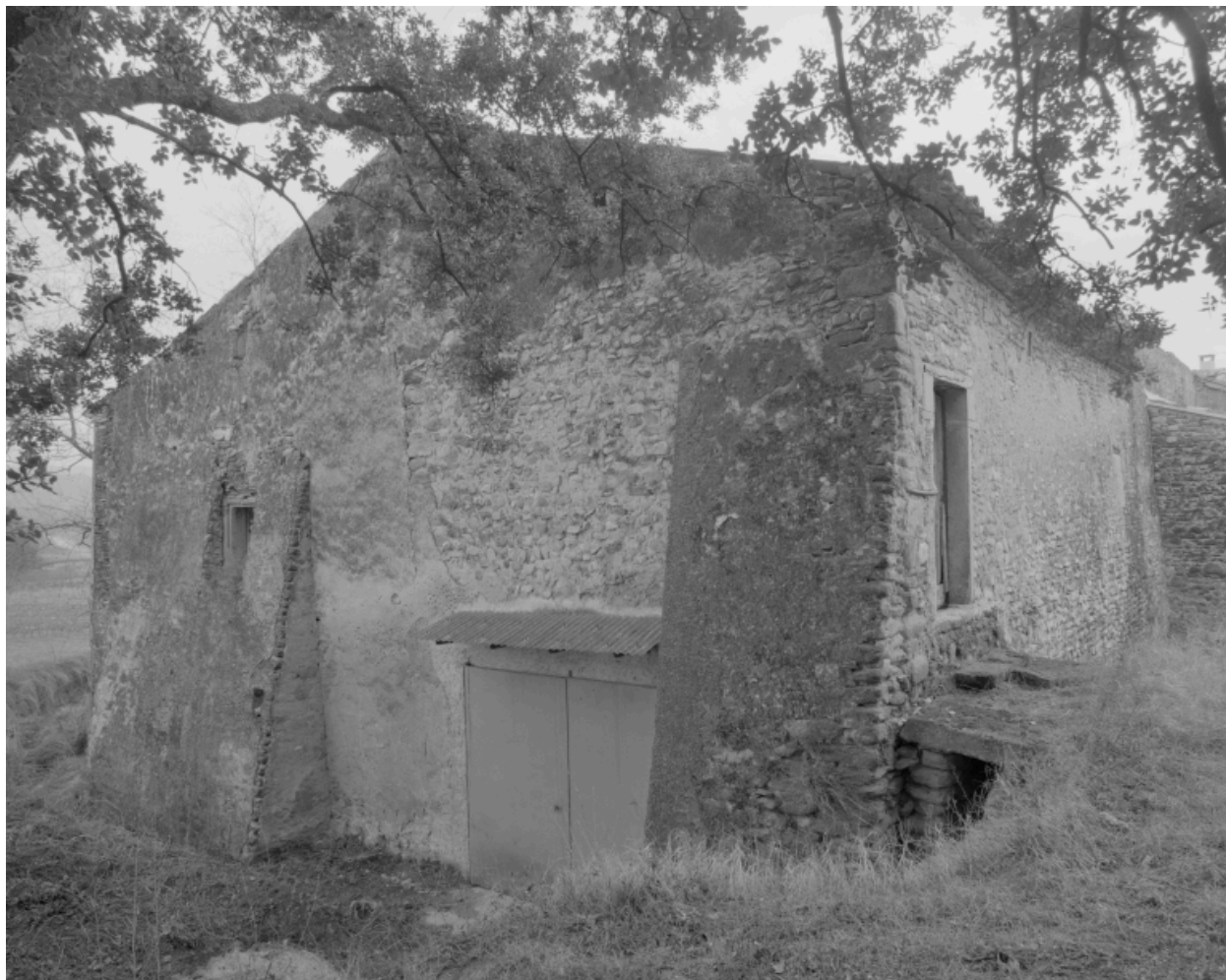
Une partie des dépendances, à l'extrémité nord-est.