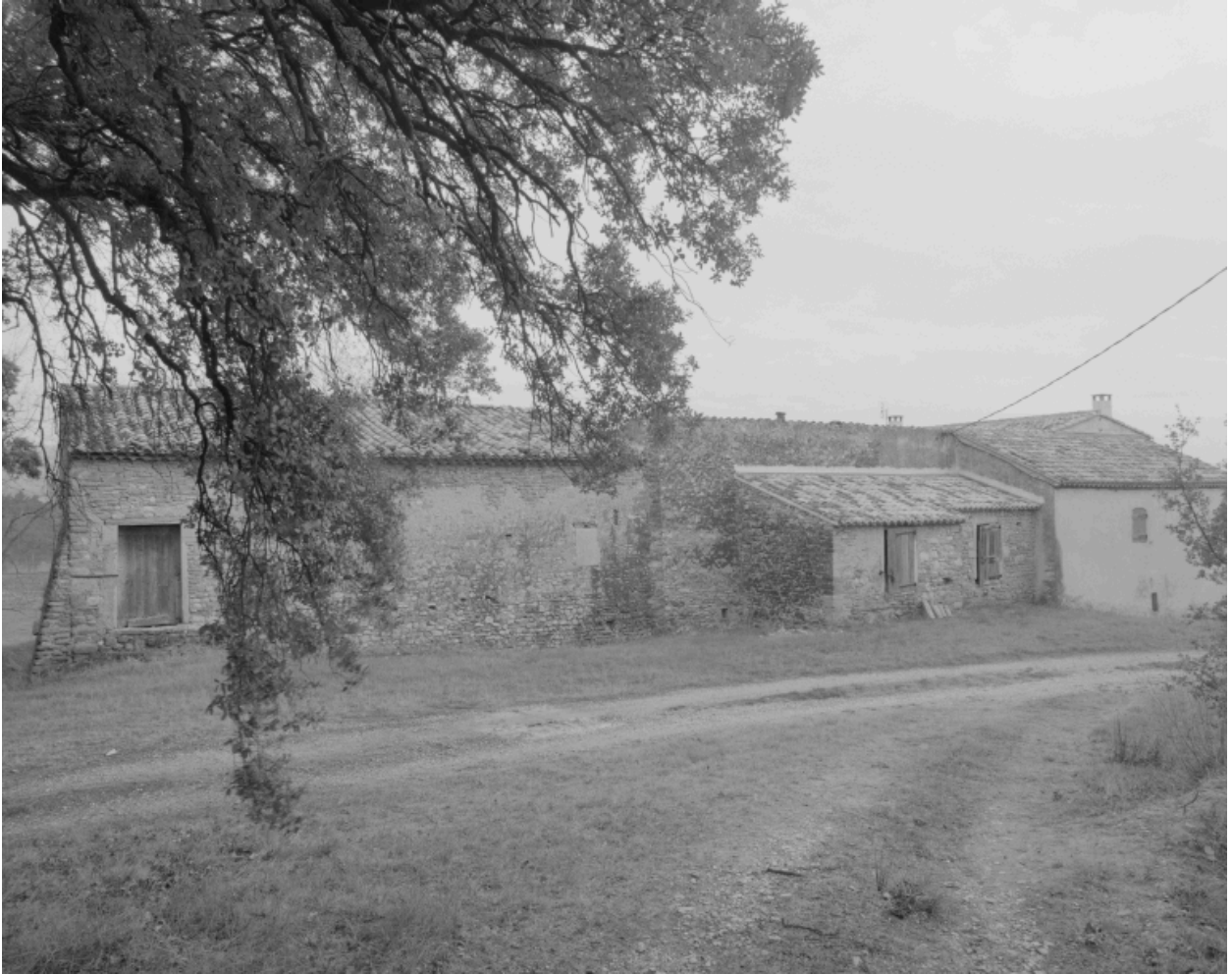
Elévation postérieure (nord-ouest) de la ferme.