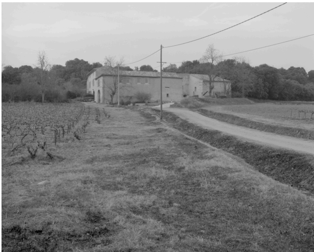
Vue d'ensemble de la ferme, prise du sud-est.