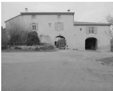
Élévation antérieure, au sud-ouest.