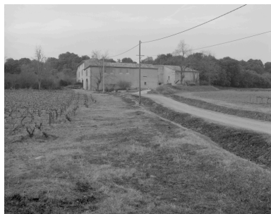
Vue d'ensemble de la ferme, prise du sud-est. IVR82_19982601037X