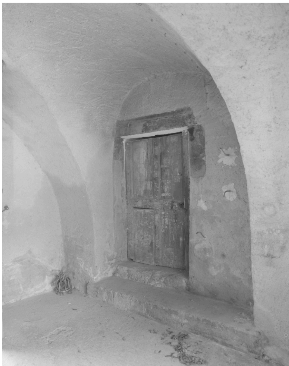
La porte d'entrée de l'ancien logis.