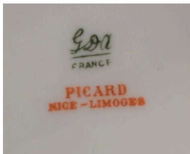
Détail - marque GDA IVR84_20226302693NUC4A