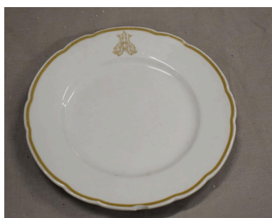
Vue générale IVR84_20226302690NUC4A