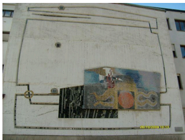
Vue d'ensemble, en 2010 IVR84_20227300611NUCA