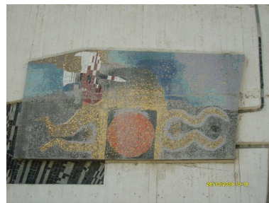
Vue rapprochée IVR84_20227300612NUCA