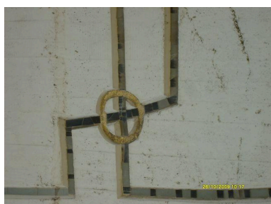
Détail IVR84_20227300613NUCA