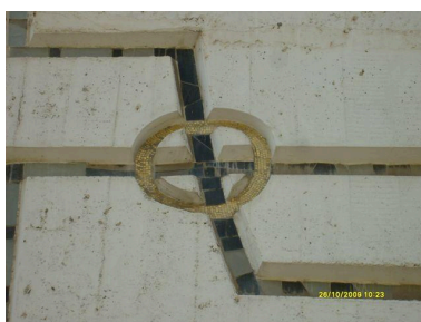
Autre détail IVR84_20227300614NUCA