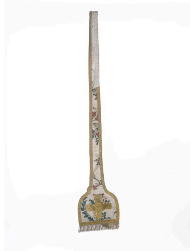
Vue générale de l'étole IVR83_20136300473NUC4A