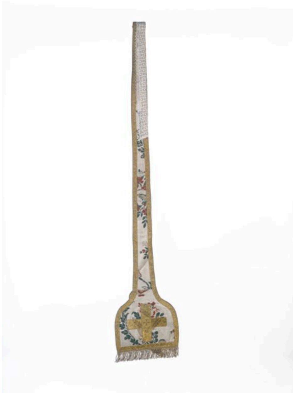
Vue générale de l'étole