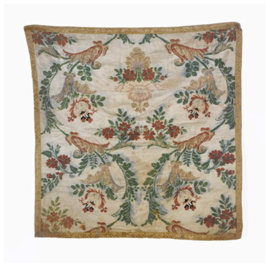
Vue générale du voile de calice IVR83_20136300476NUC4A