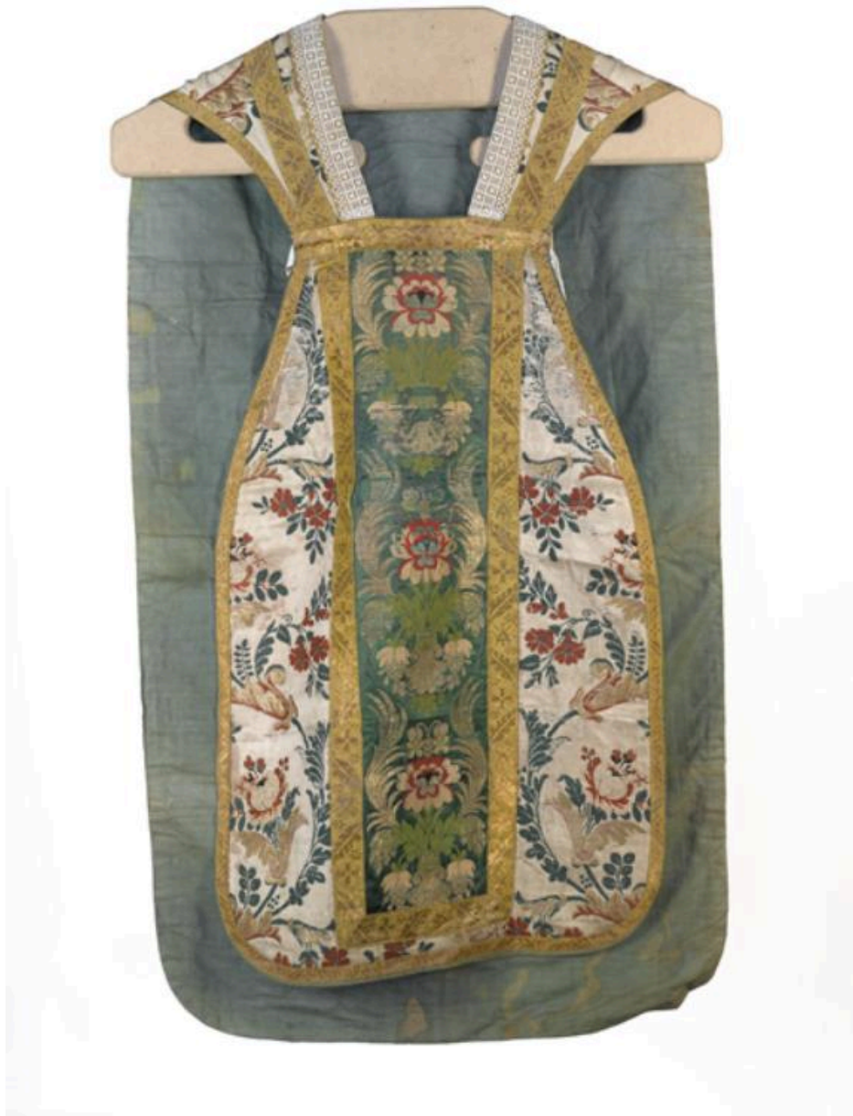
Devant de la chasuble, vue générale.