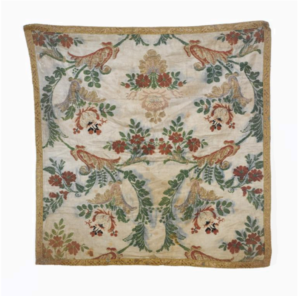
Vue générale du voile de calice