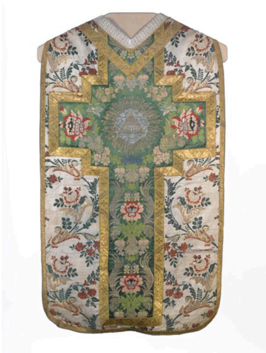
Dos de la chasuble, vue générale