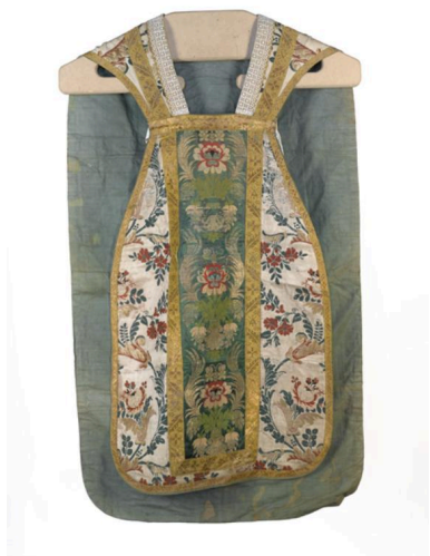
Devant de la chasuble, vue générale.