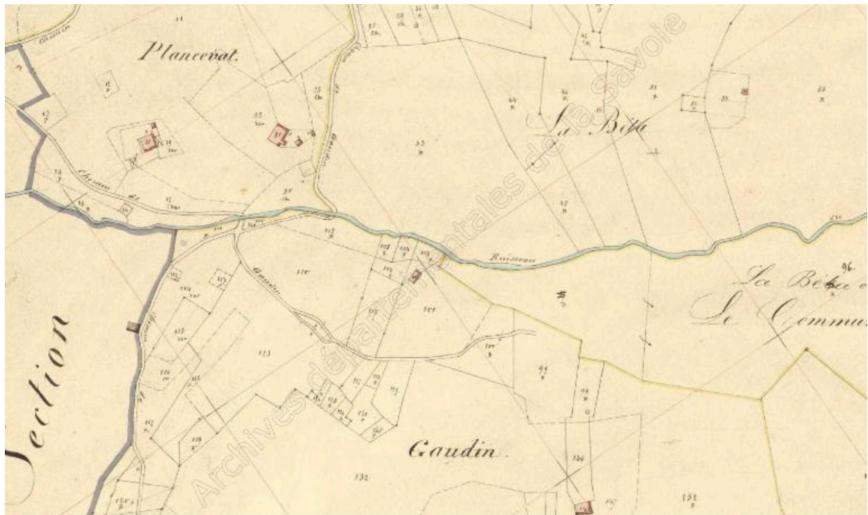
Premier cadastre français, Sainte-Hélène-sur-Isère, 1870, Section E, feuille 1 (FR.AD073, 3P 7503).