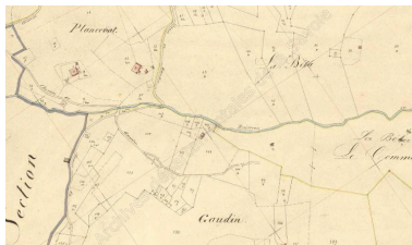
Premier cadastre français, Sainte-Hélène-sur-Isère, 1870, Section E, feuille 1 (FR.AD073, 3P 7503).