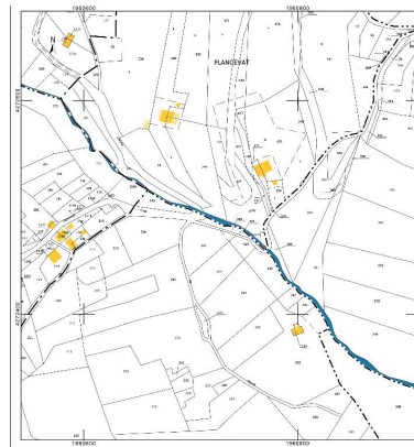
Cadastral actuel, 2014.