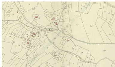
Cadastral napoléonien, Sainte-Hélène-sur-Isère, 1809 Section D, feuille unique (FR.AD073, L1006).