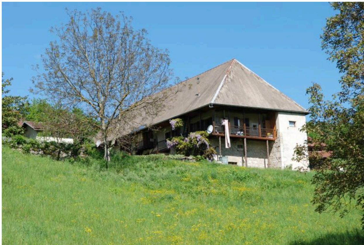
Vue d'ensemble de la ferme.