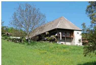
Vue d'ensemble de la ferme.