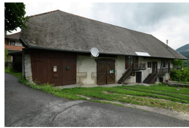
Vue d'ensemble de la façade principale.