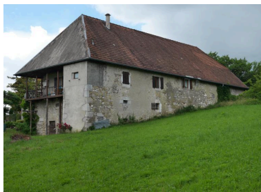
Vue d'ensemble de trois- quarts arrière gauche IVR82_20157402611NUCAQ