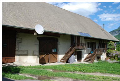
Vue d'ensemble de la façade principale de la ferme.