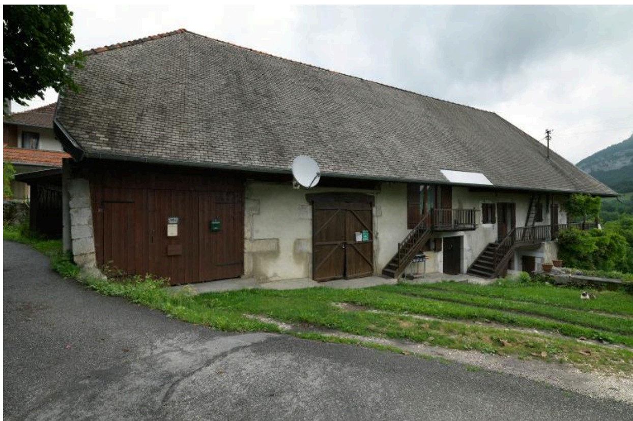
Vue d'ensemble de la façade principale.