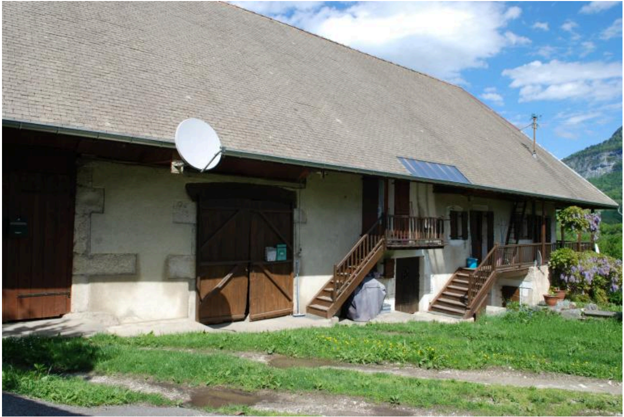
Vue d'ensemble de la façade principale de la ferme.