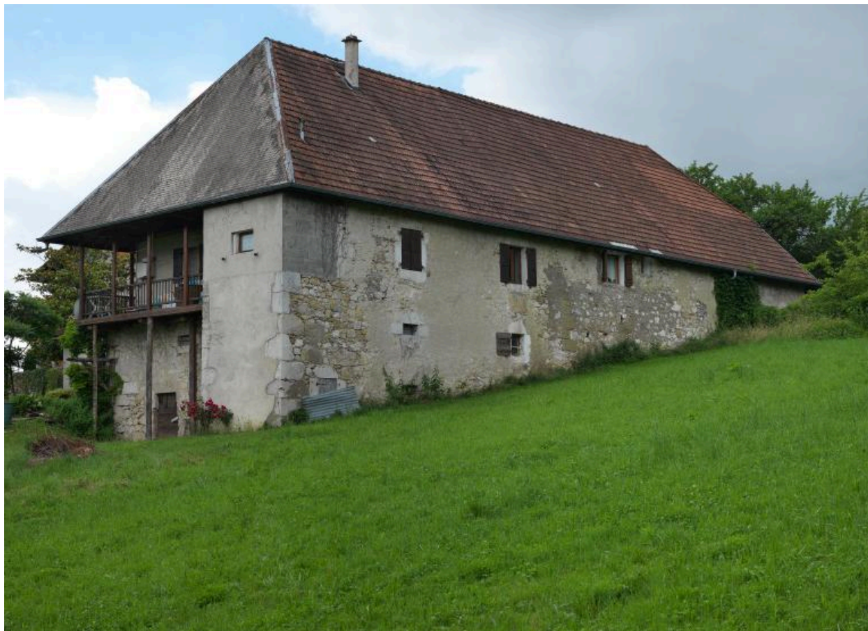
Vue d'ensemble de trois-quarts arrière gauche