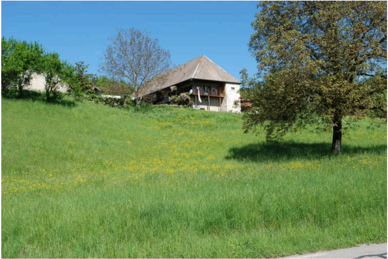
Vue générale de la ferme dans son site.