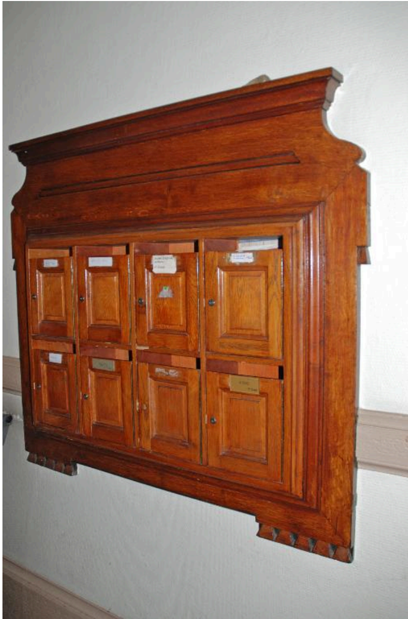
Détail : boîtes aux lettres, dans le vestibule-sas