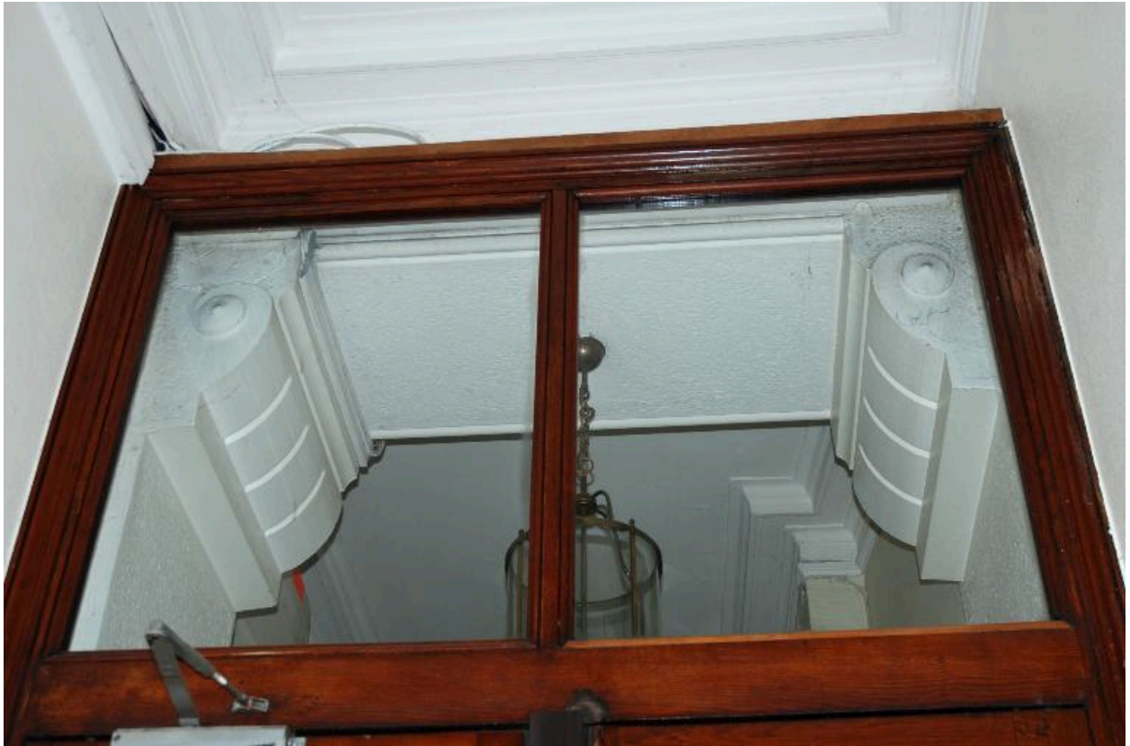
Détail : imposte de la porte du vestibule-sas et consoles