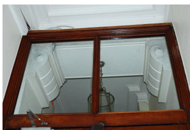
Détail : imposte de la porte du vestibule-sas et consoles IVR84_20166902290NUCA