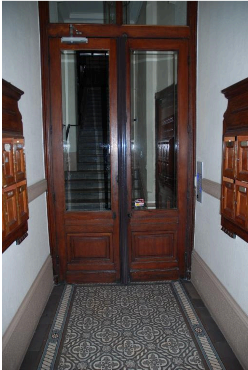
Vue intérieure : le vestibule-sas