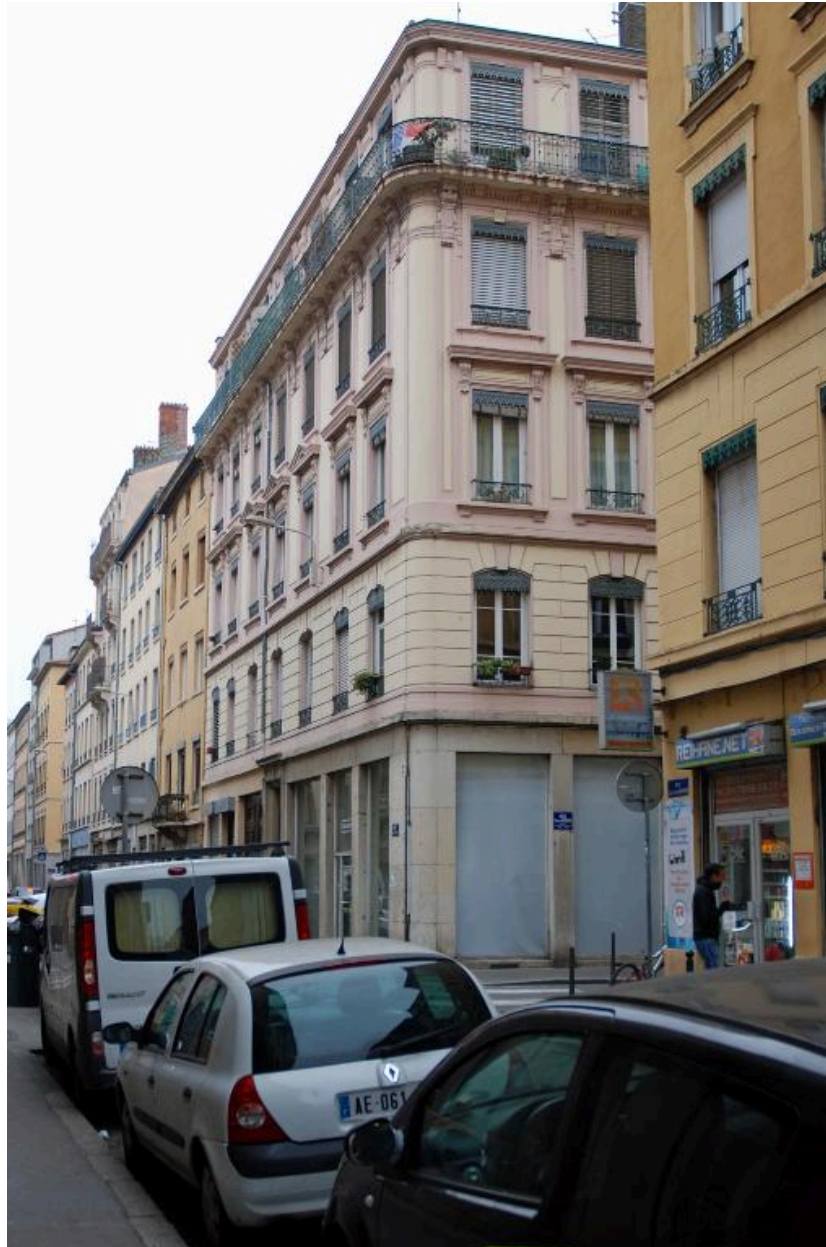
Elévation ouest, rue Sébastien-Gryphe