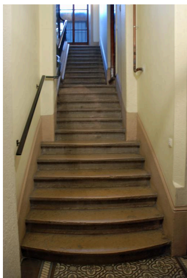
Vue intérieure : départ de l'escalier, première volée prolongée IVR84_20166902292NUCA