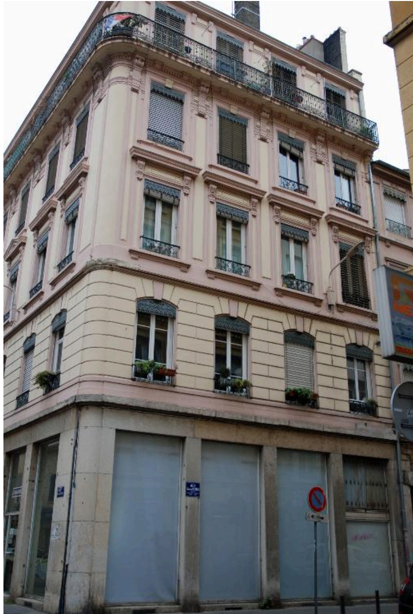
Elévation sud, rue Salomon-Reinach