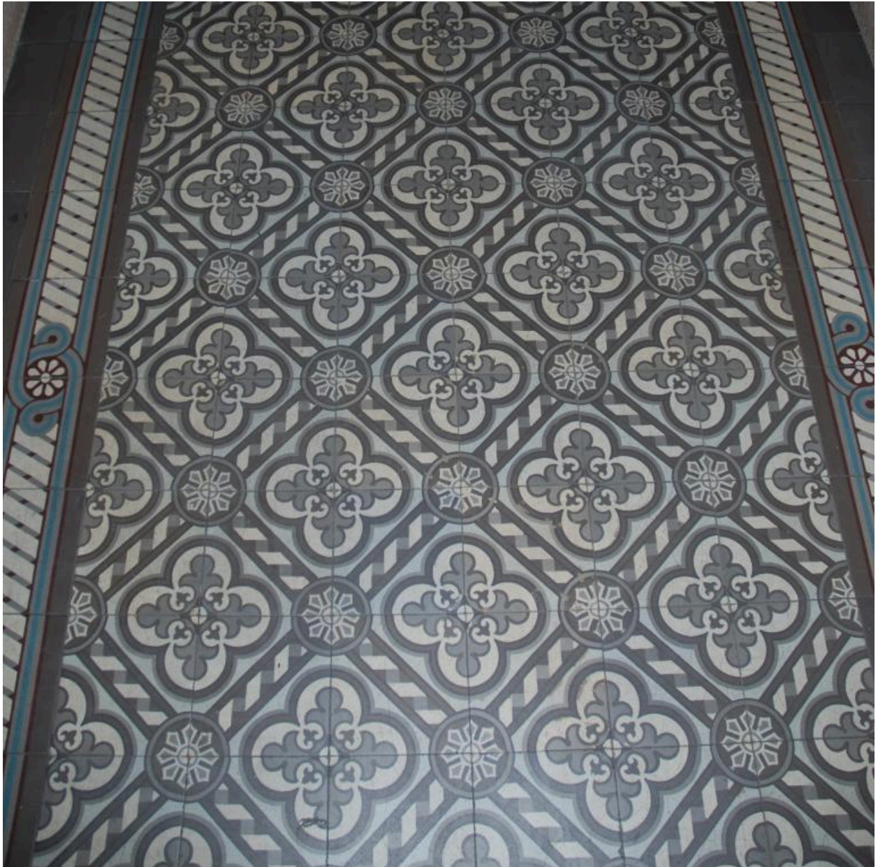
Détail : pavement du vestibule-sas en carreaux de ciment polychromes