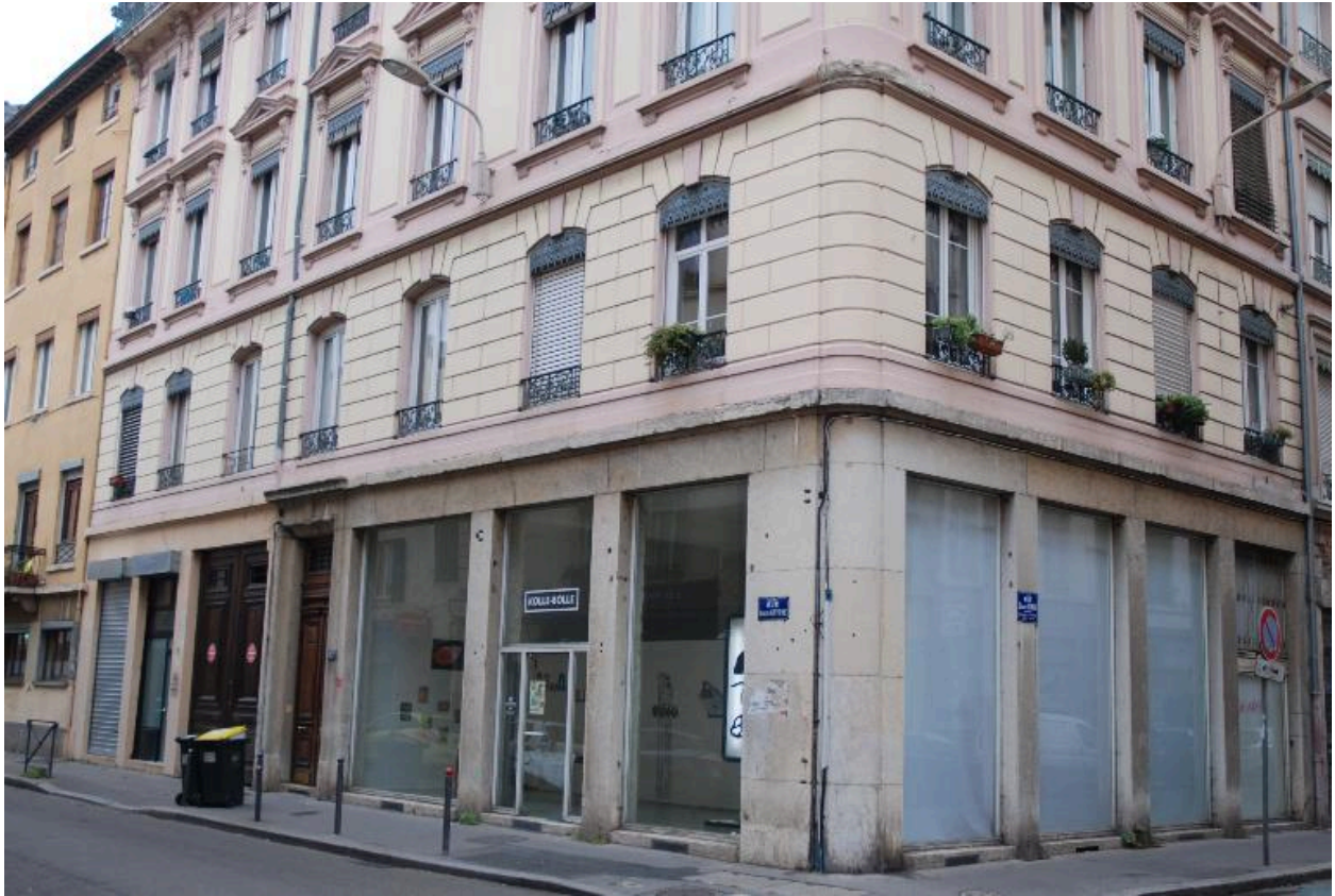
Vue rapprochée, rez-de-chaussée et premier étage en entresol