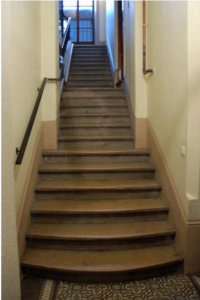
Vue intérieure : départ de l'escalier, première volée prolongée