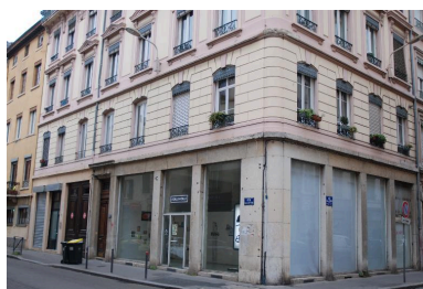
Vue rapprochée, rez-de-chaussée et premier étage en entresol