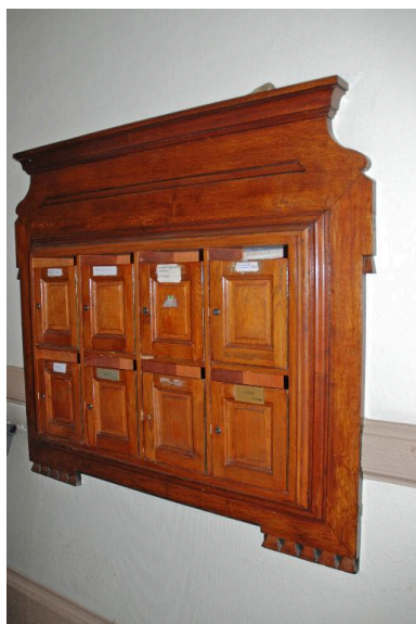
Détail : boîtes aux lettres, dans le vestibule-sas IVR84_20166902294NUCA