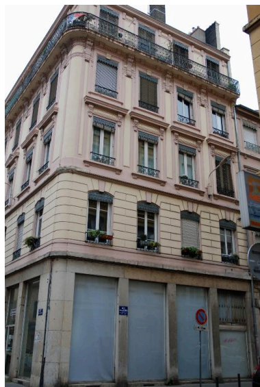
Elévation sud, rue Salomon-Reinach