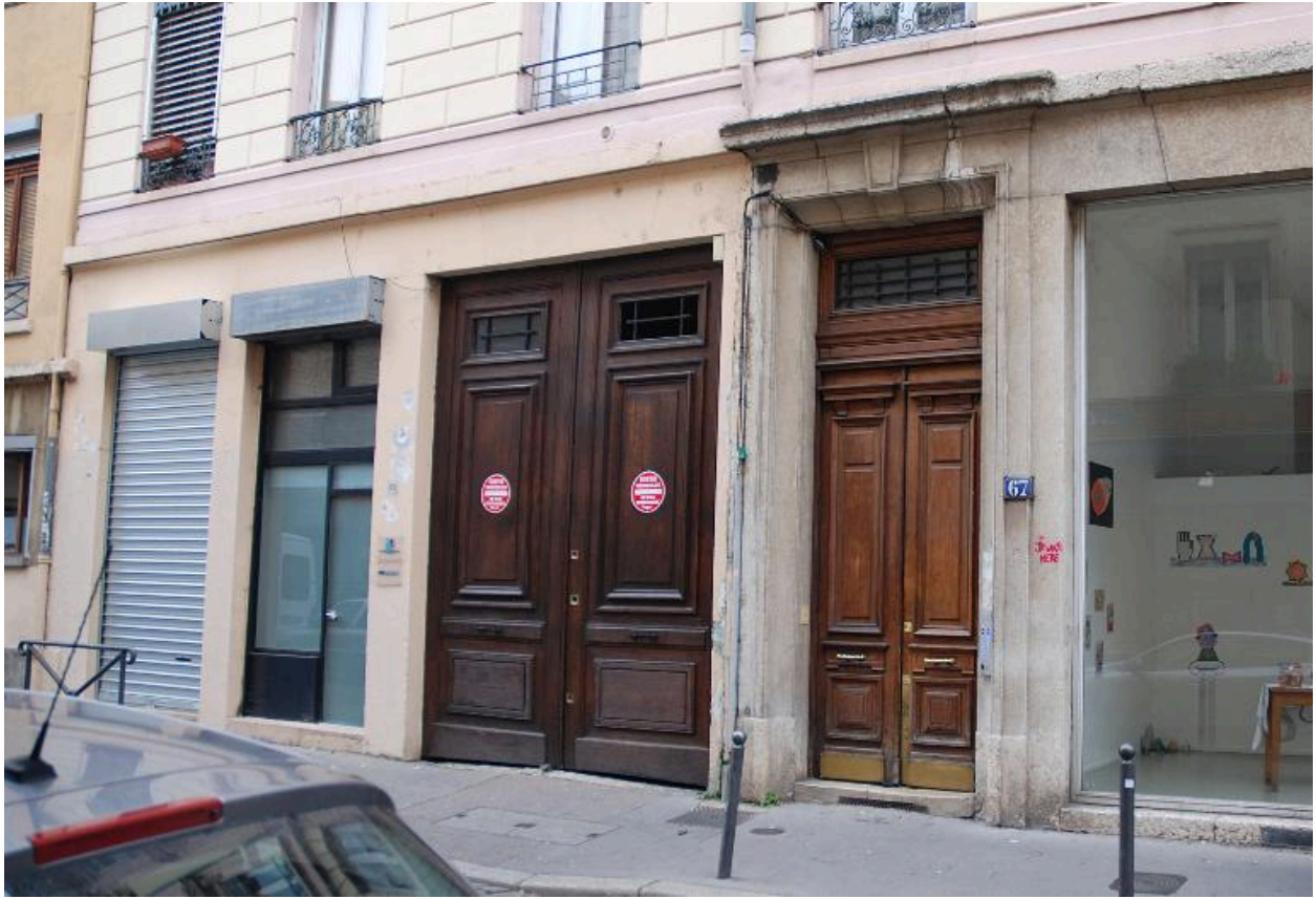
Élévation ouest : porte bâtarde et porte cochère juxtaposées