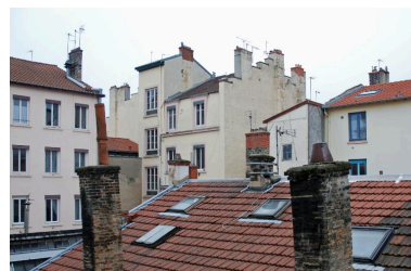
Elévation postérieure, vue lointaine IVR84_20166902293NUCA