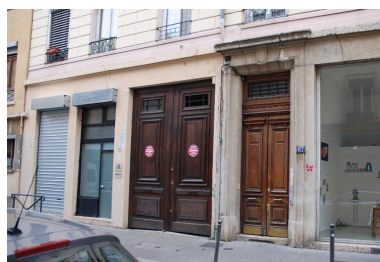
Elévation ouest : porte bâtarde et porte cochère juxtaposées IVR84_20166902288NUCA