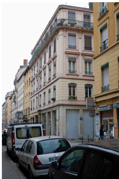
Elévation ouest, rue Sébastien-Gryphe IVR84_20166902285NUCA