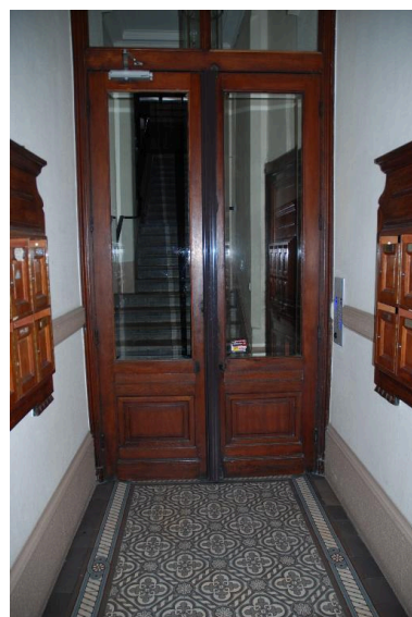
Vue intérieure : le vestibule-sas