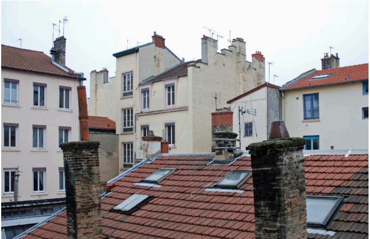
Elévation postérieure, vue lointaine