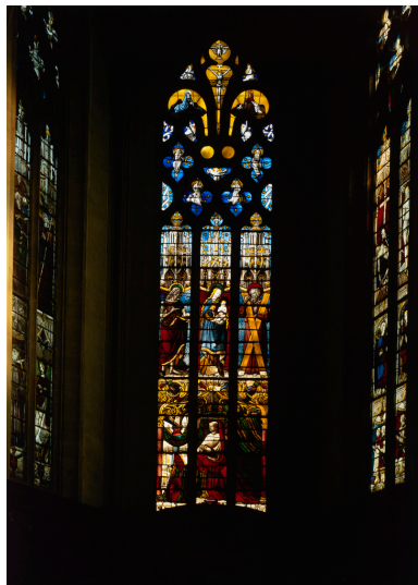
Vue d'ensemble. IVR82_19796900319PA