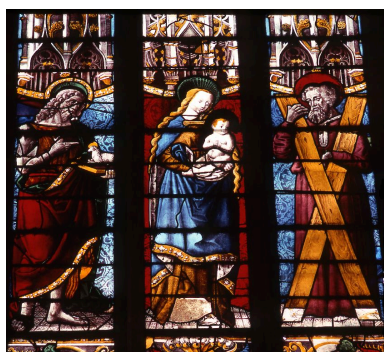
Vitrail 0 IVR82_19806900075ZA