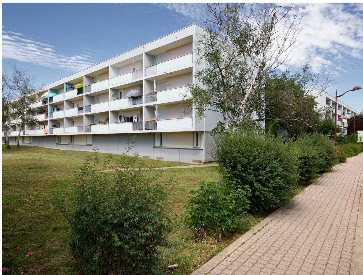
Immeuble collectif à l'angle sud-ouest de la cité du Breuil, depuis l'avenue Pierre-de-Coubertin.