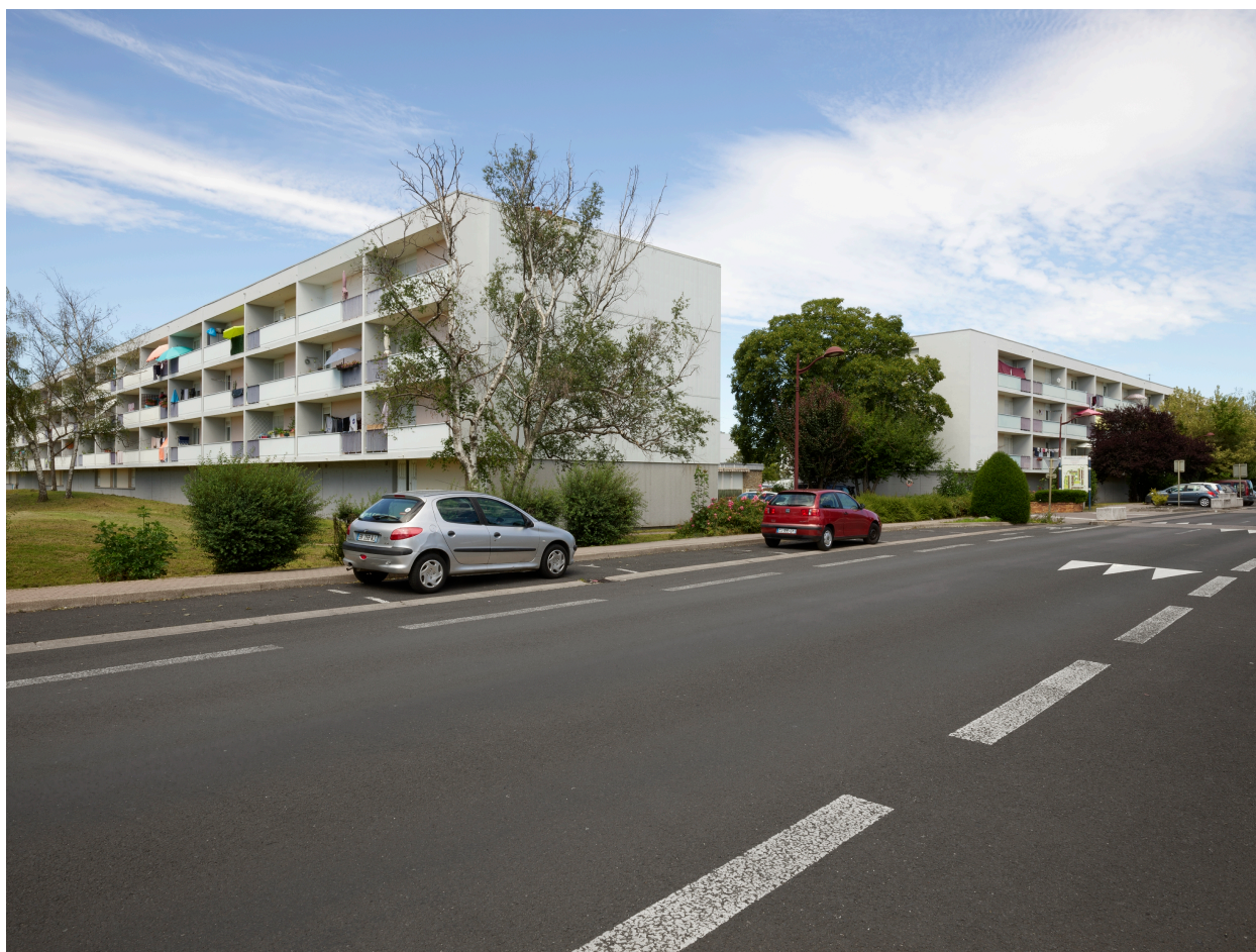
Immeubles collectifs à l'angle sud-ouest de la cité du Breuil, depuis l'avenue Pierre-de-Coubertin.