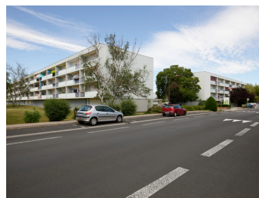
Immeubles collectifs à l'angle sud-ouest de la cité du Breuil, depuis l'avenue Pierre-de-Coubertin. IVR84_20206300936NUC4A