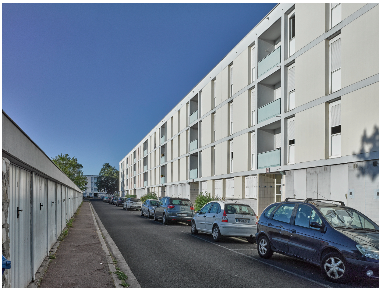
Vue de la partie est – nord-est de la cité, avec les garages et les entrées d'immeuble.