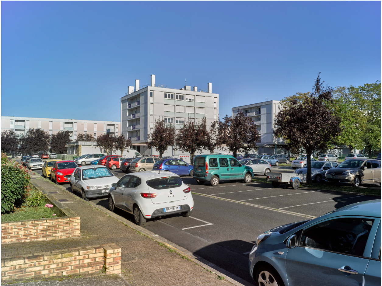
Espace intérieur de la cité du Breuil, côté ouest.