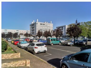
Espace intérieur de la cité du Breuil, côté ouest. IVR84_20206300931NUC4A