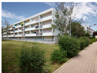
Immeuble collectif à l'angle sud-ouest de la cité du Breuil, depuis l'avenue Pierre-de-Coubertin.