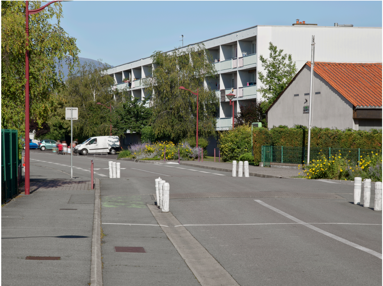
Vue de l'immeuble collectif formant la limite sud de la cité depuis l'avenue Pierre-de-Coubertin.