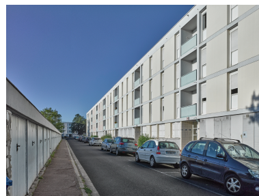
Vue de la partie est - nord-est de la cité, avec les garages et les entrées d'immeuble. IVR84_20206300933NUC4A