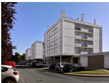
Ensemble des trois petites "tours" du centre de la cité, côté ouest. IVR84_20206300932NUC4A