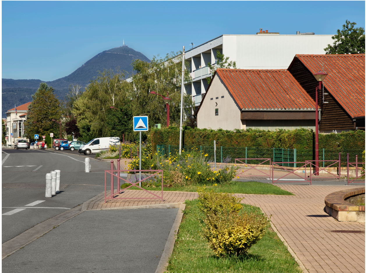
Vue d'un immeuble collectif formant la limite sud de la cité depuis l'avenue Pierre-de-Coubertin ; à l'arrière-plan, le puy de Dôme.