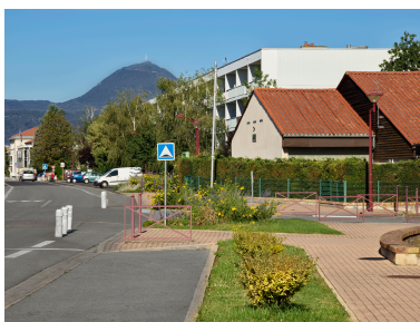
Vue d'un immeuble collectif formant la limite sud de la cité depuis l'avenue Pierre-de-Coubertin ; à l'arrière-plan, le puy de Dôme. IVR84_20206300934NUC4A