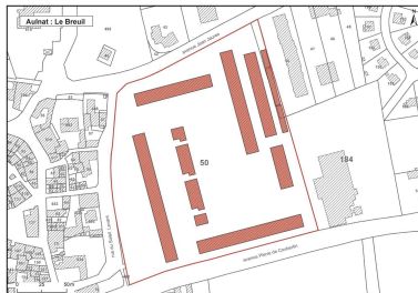
Plan des différents bâtiments d'origine de la cité. IVR84_20216301295NUDA