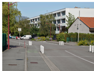
Vue de l'immeuble collectif formant la limite sud de la cité depuis l'avenue Pierre-de-Coubertin. IVR84_20206300935NUC4A