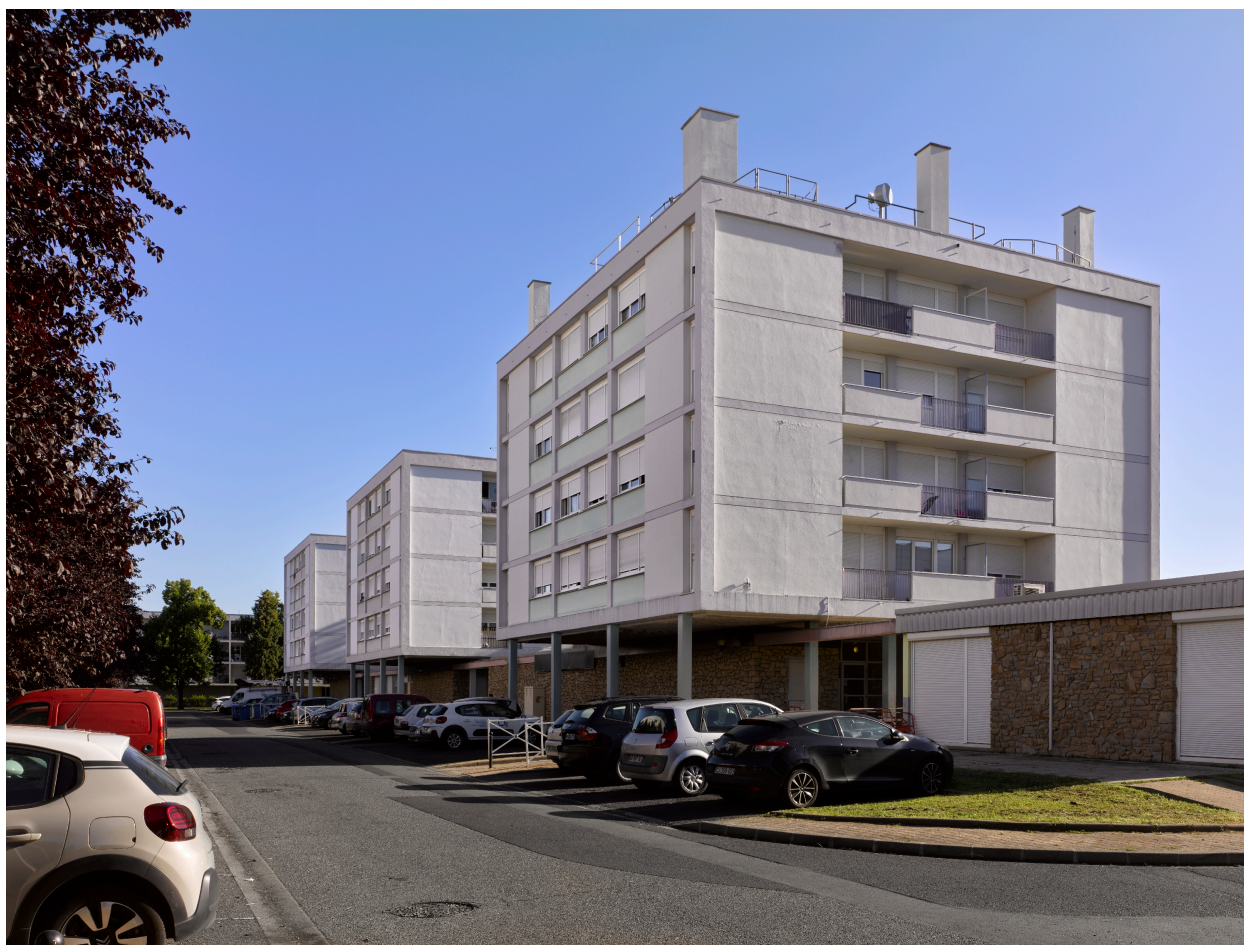
Ensemble des trois petites "tours" du centre de la cité, côté ouest.