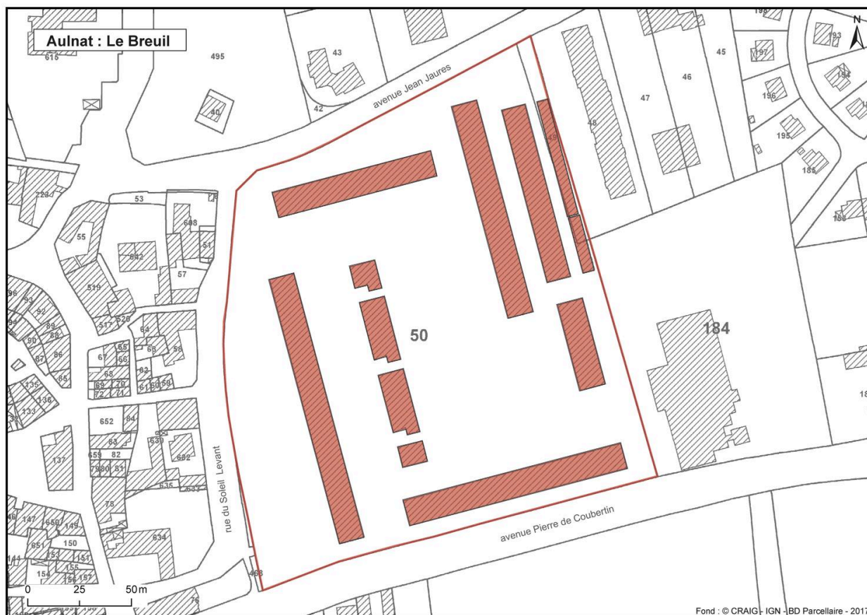
Plan des différents bâtiments d'origine de la cité.