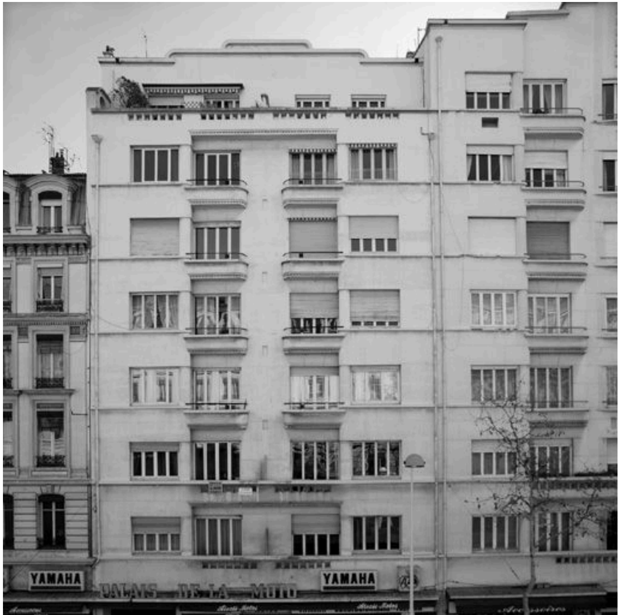
Vue générale de l'élévation