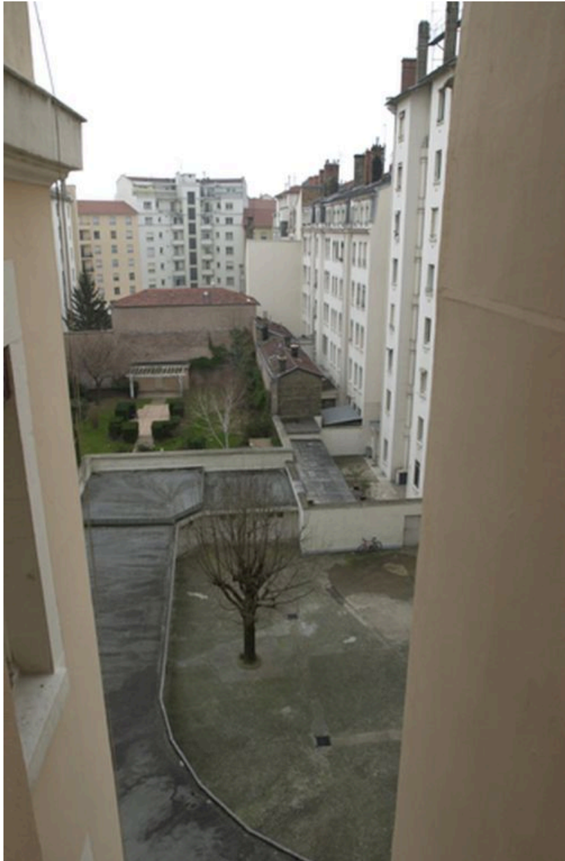
Vue de la cour et des garages depuis le 56 cours Gambetta