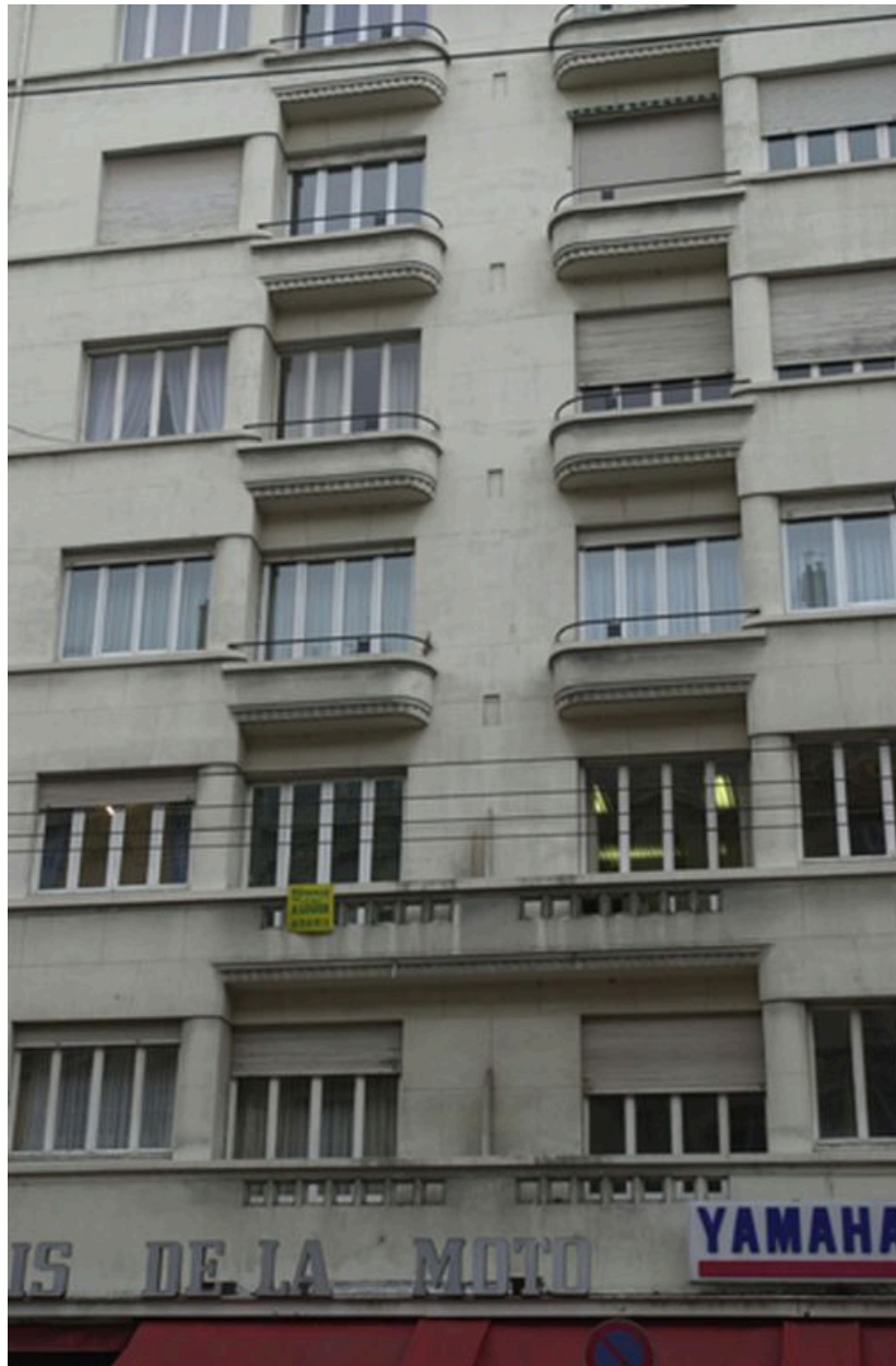
Détail de la façade sur rue