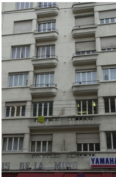
Détail de la façade sur rue IVR82_20046904309NUC