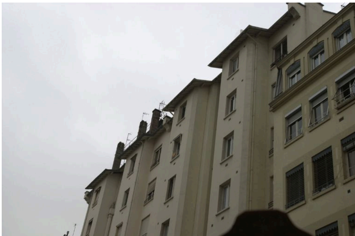
Elévation postérieure depuis le 56, cours Gambetta