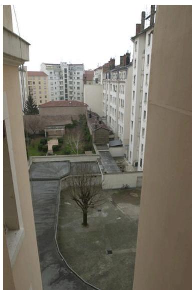
Vue de la cour et des garages depuis le 56 cours Gambetta IVR82_20046904311NUC