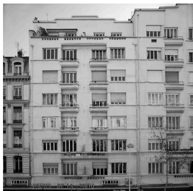
Vue générale de l'élévation IVR82_20046904308NUC