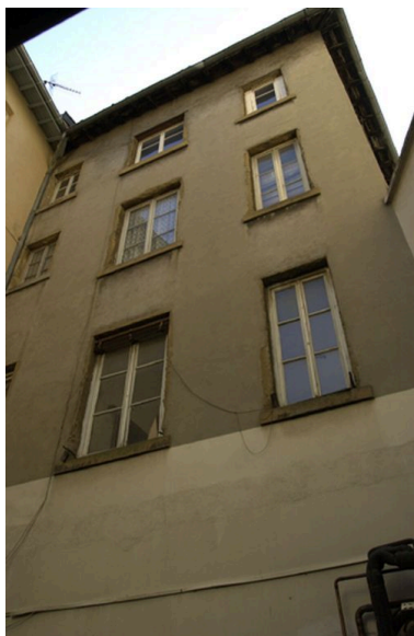
Elévation sur cour, étages supérieurs IVR82_20046904450NUCA