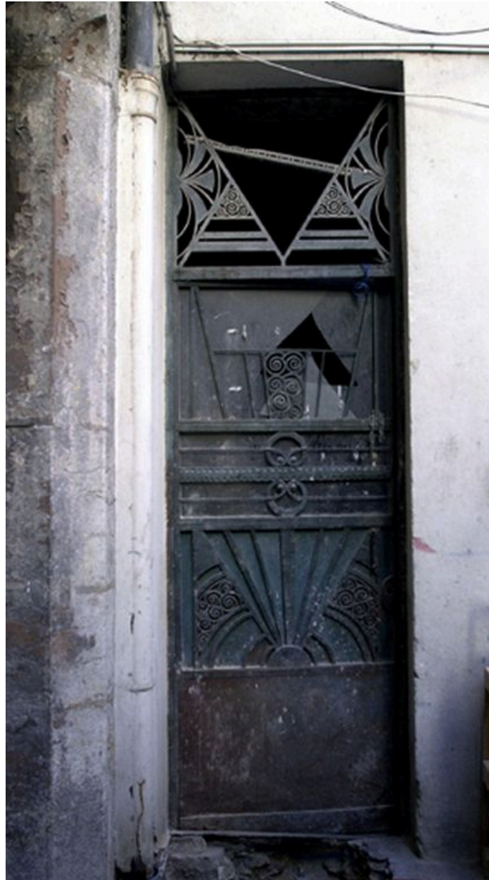
Vue de la porte d'entrée sur cour