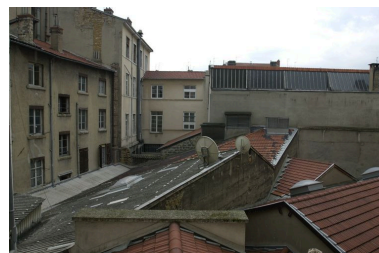
Elévation sur cour depuis l'immeuble 7 place Gabriel-Péri IVR82_20026902775NUCA