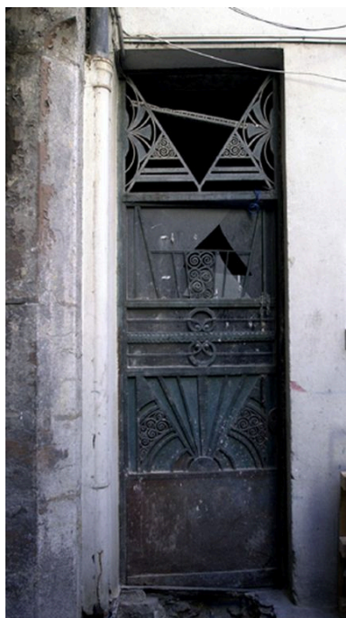
Vue de la porte d'entrée sur cour IVR82_20046904432NUCA