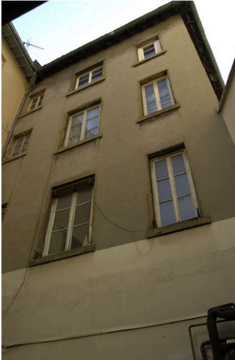
Elévation sur cour, étages supérieurs