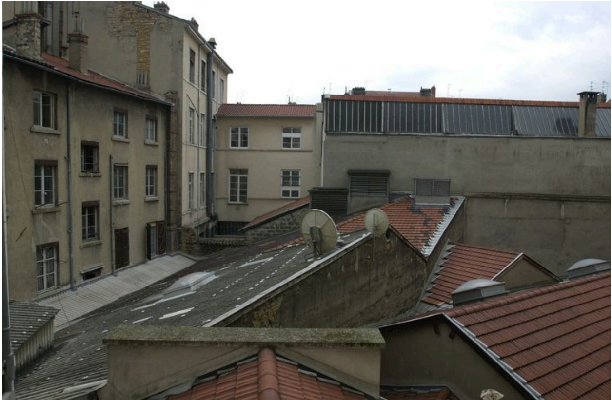
Elévation sur cour depuis l'immeuble 7 place Gabriel-Péri