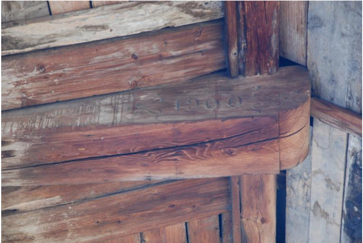
Détail de la date gravée sur un débord d'entrait.