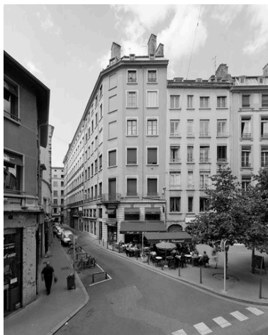
Vue générale depuis la rue Paul-Chenavard IVR82_20056902670V