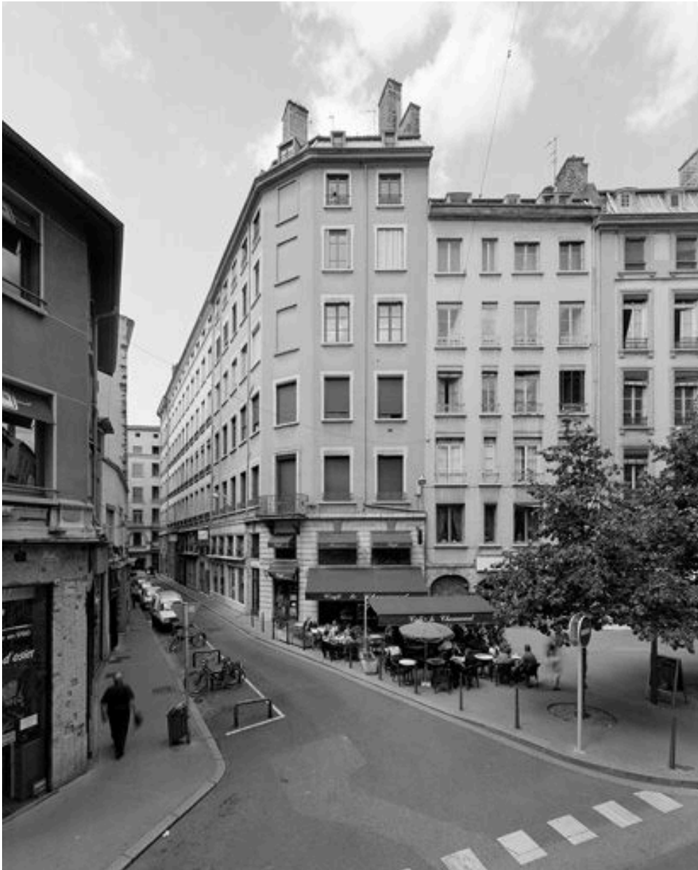
Vue générale depuis la rue Paul-Chenavard