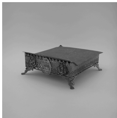
Vue d'ensemble de trois quarts du pupitre d'autel.