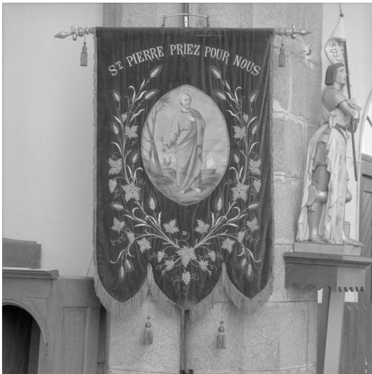
Vue d'ensemble de la bannière de procession de saint Pierre.