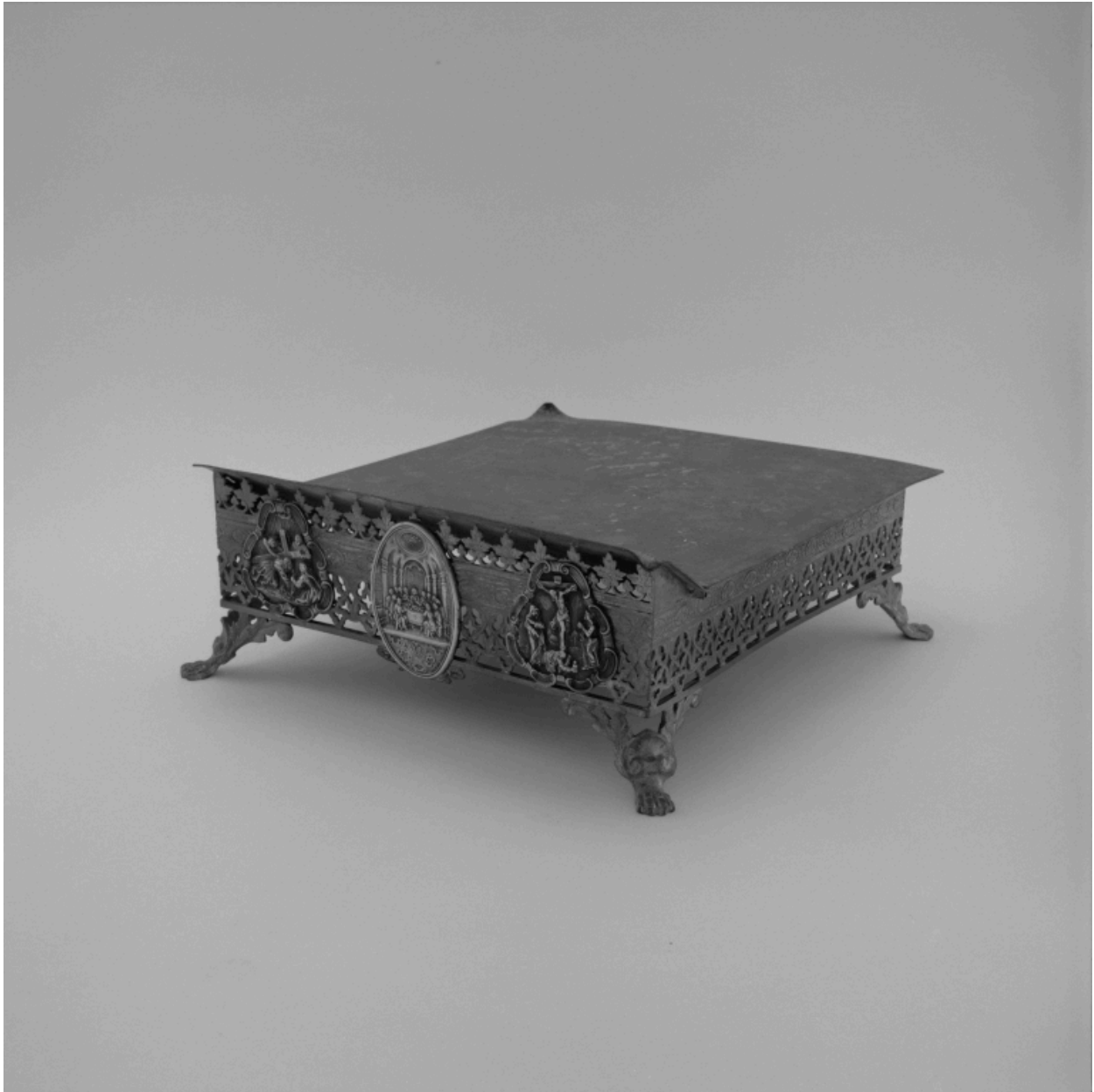
Vue d'ensemble de trois quarts du pupitre d'autel.