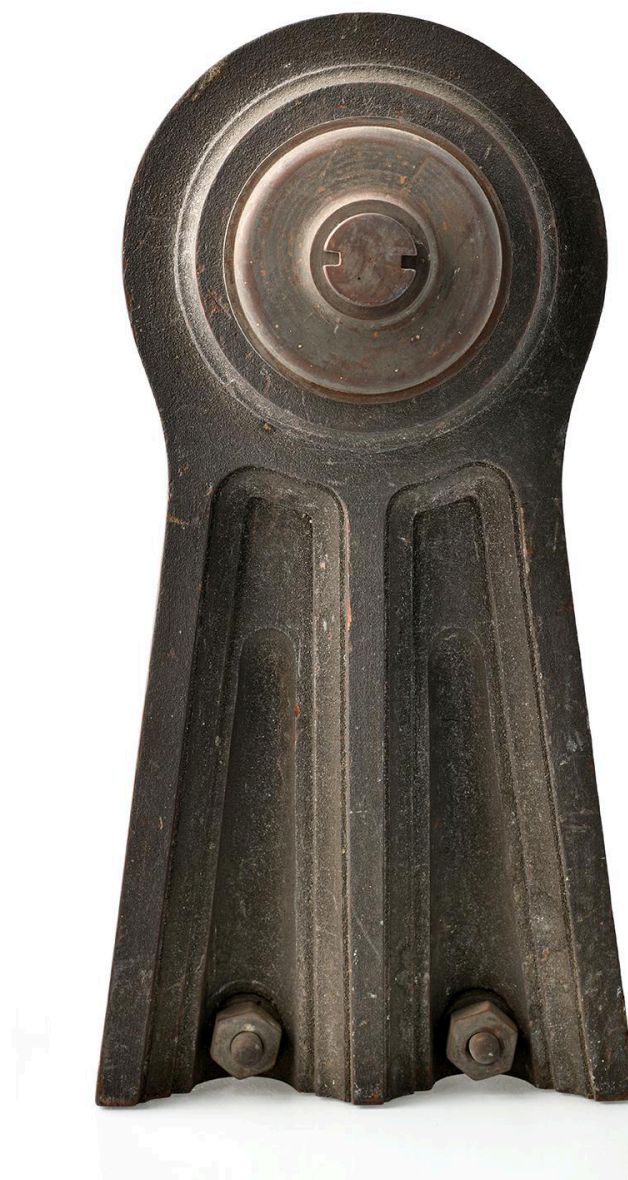
Balancier, vue 1