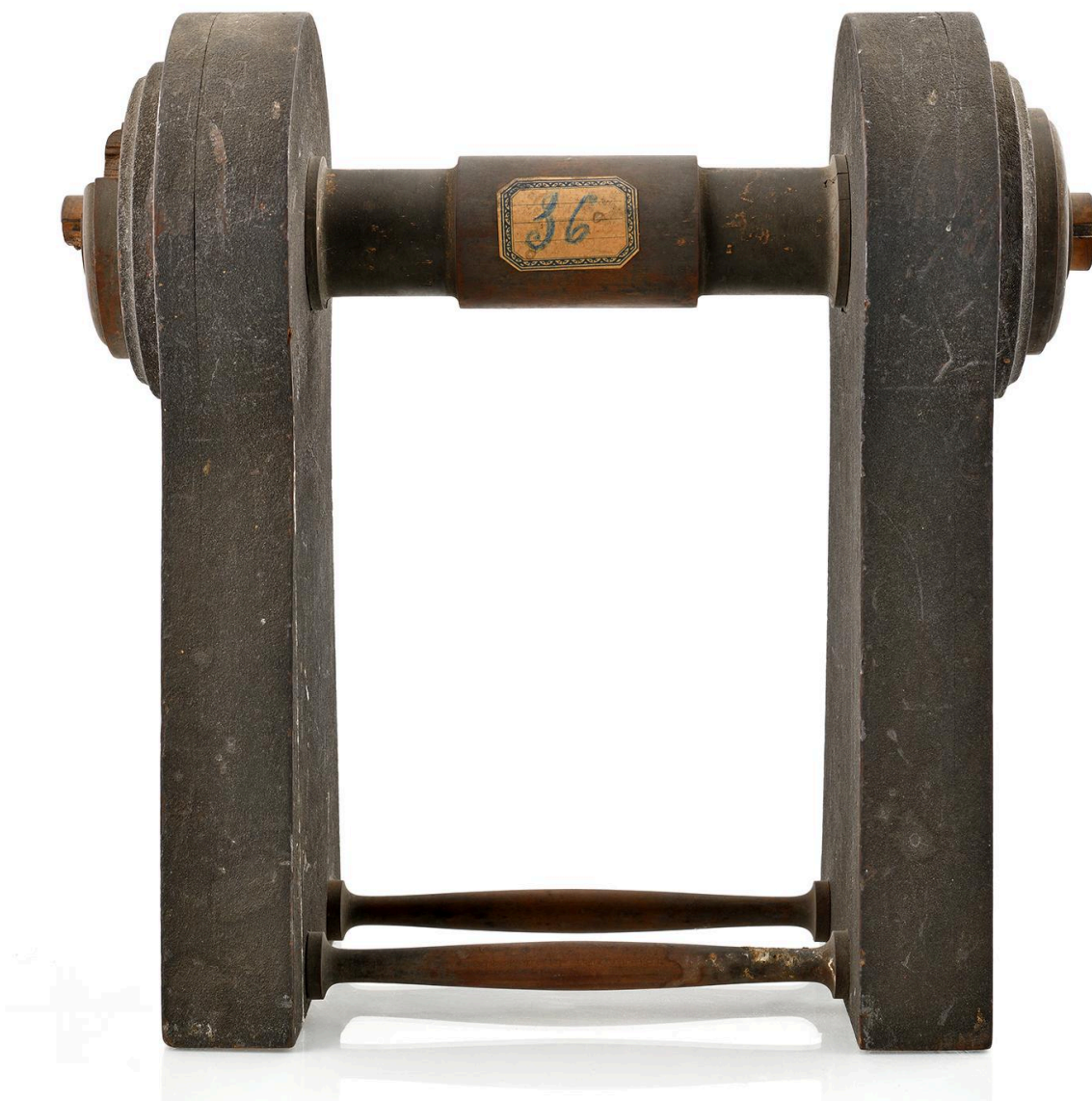
Balancier, vue 3