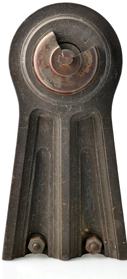
Balancier, vue 2