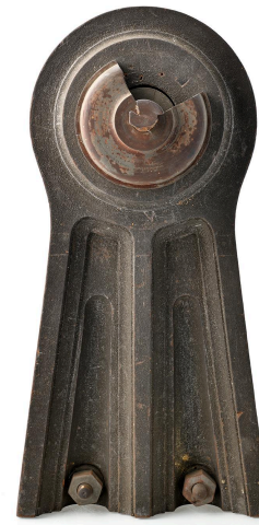
Balancier, vue 2 IVR84_20256901778NUCA