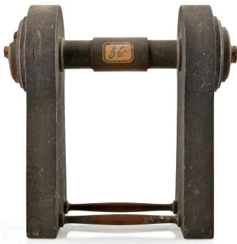
Balancier, vue 3 IVR84_20256901776NUCA