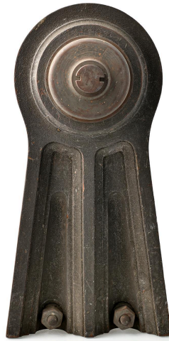
Balancier, vue 1 IVR84_20256901777NUCA