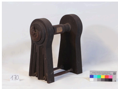
IVR84_20256901259NUCA