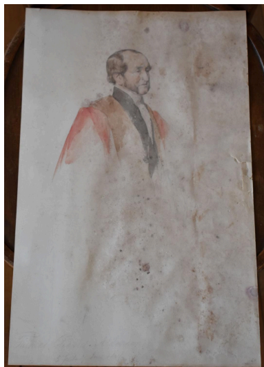
Vue générale IVR84_20226300545NUCA