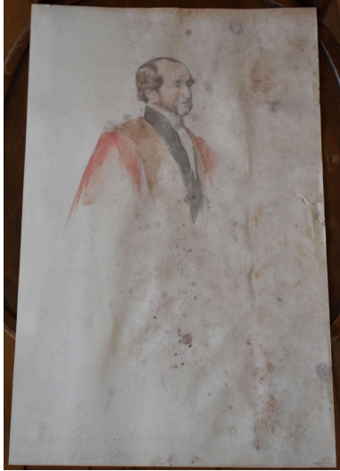
Vue générale IVR84_20226300545NUCA