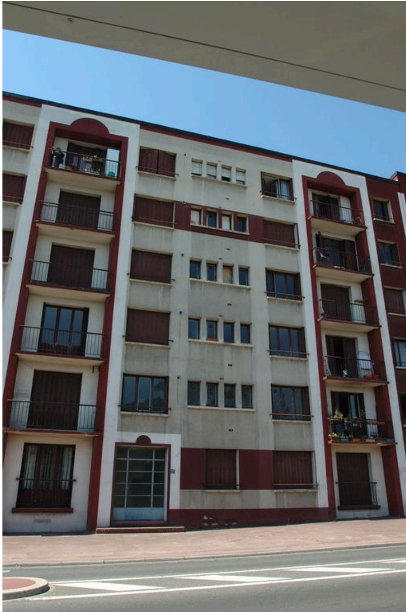
Détail de la façade sur rue.