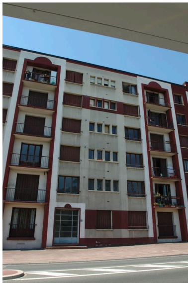
Détail de la façade sur rue. IVR82_20126902786NUCA