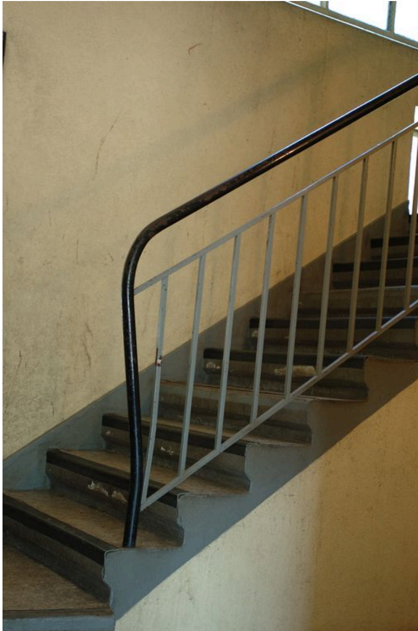
Détail de la rampe d'escalier du n°21.