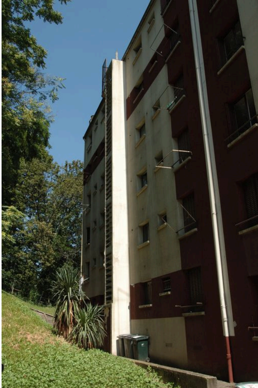
Détail du revers (élévation ouest).