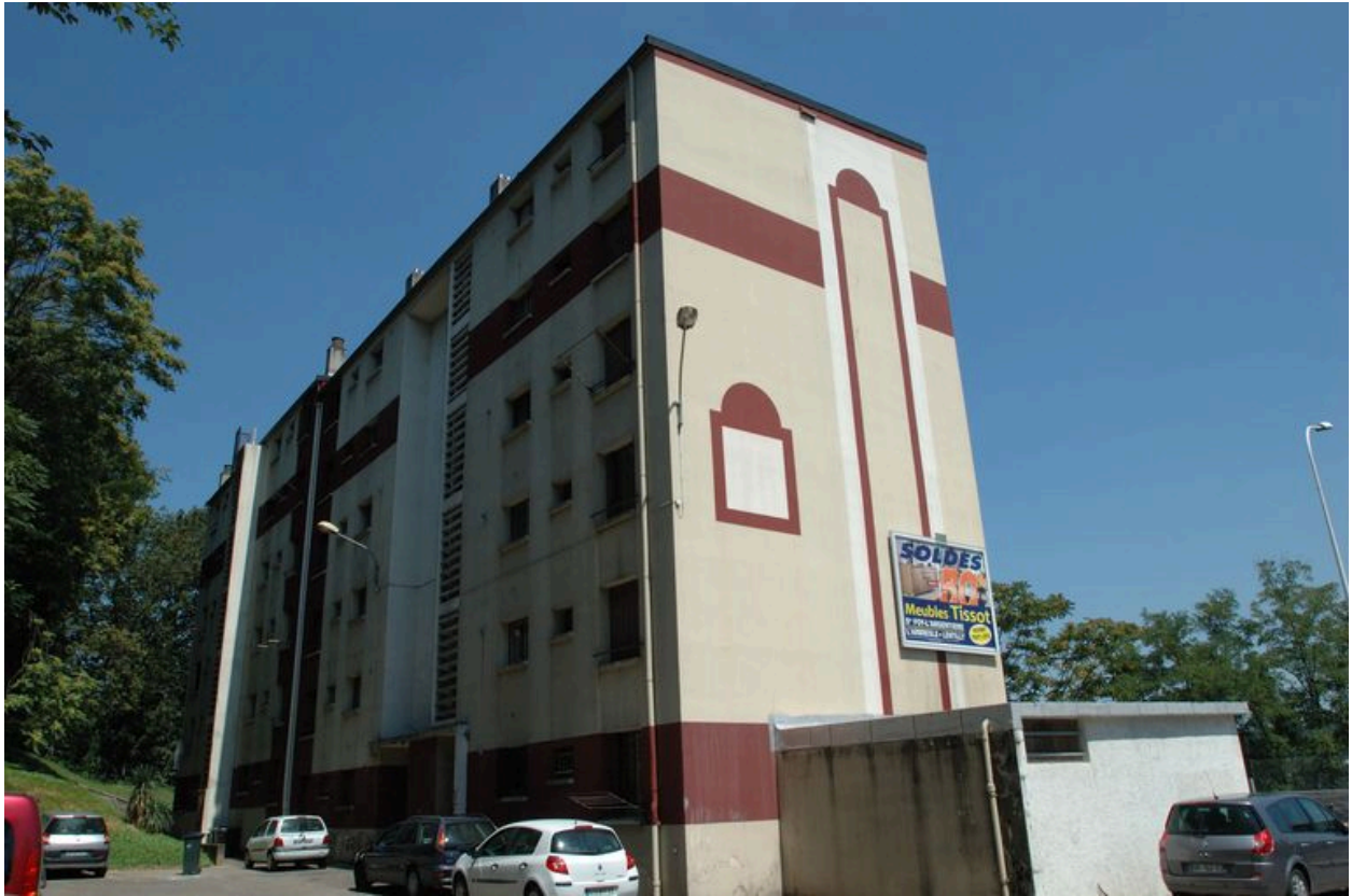
Vue du revers.