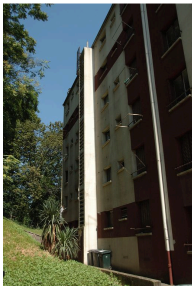
Détail du revers (élévation ouest).