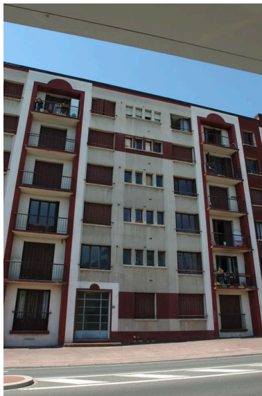
Détail de la façade sur rue. IVR82_20126902786NUCA