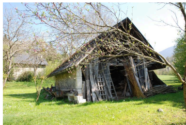
Vue d'ensemble du bâtiment abritant le four à pain et le pressoir.