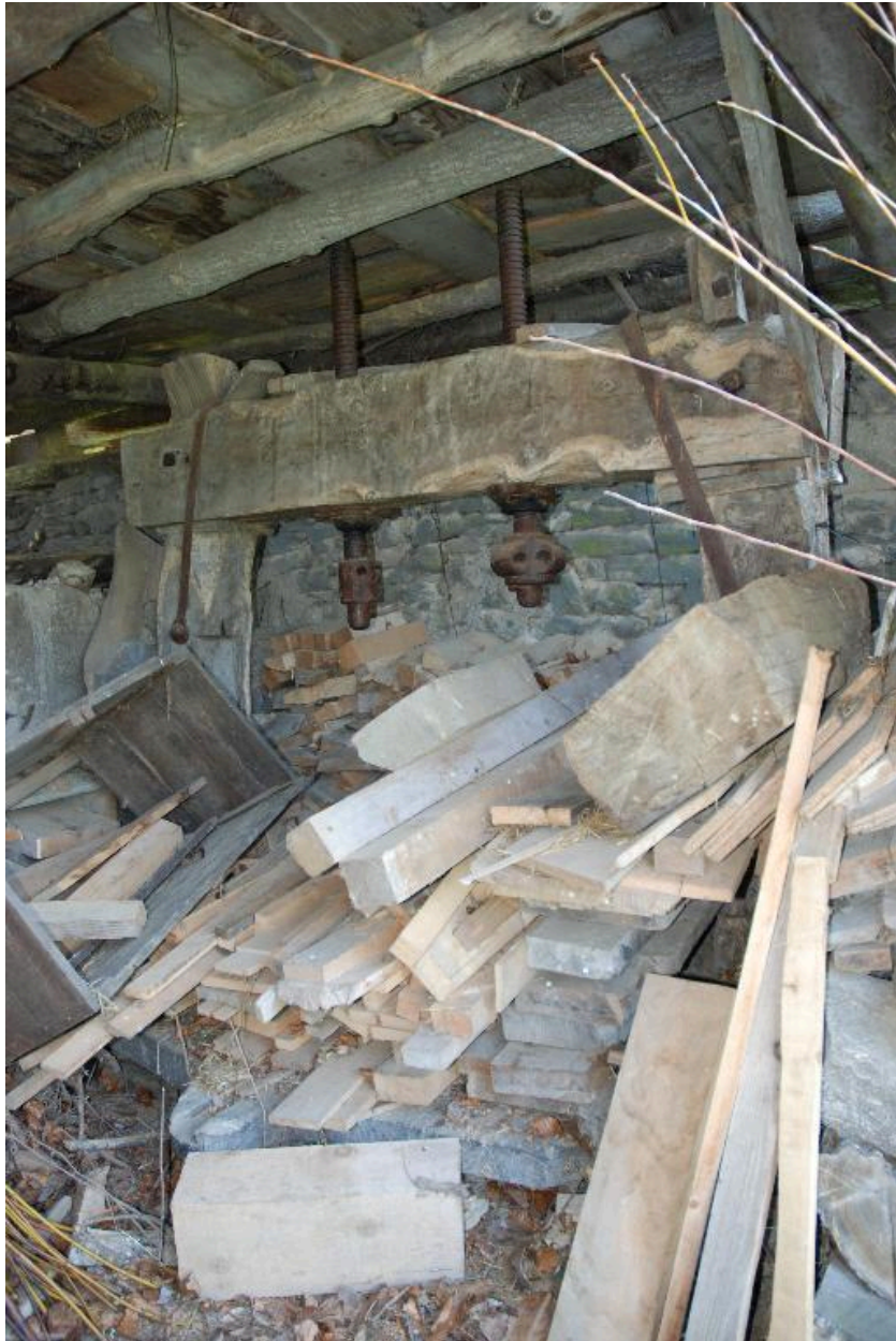
Vue partielle du pressoir.