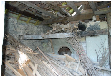
Vue partielle du four à pain.