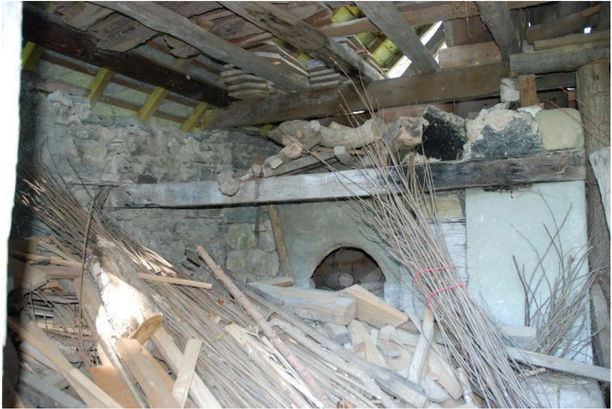
Vue partielle du four à pain.