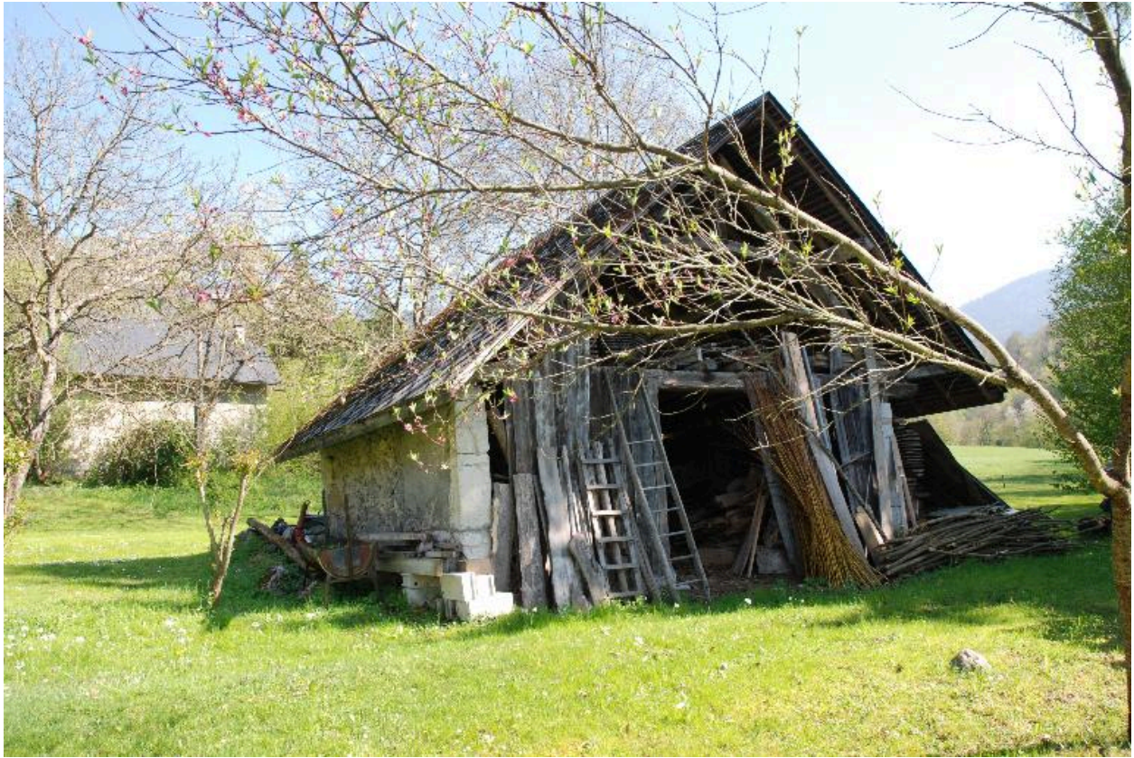
Vue d'ensemble du bâtiment abritant le four à pain et le pressoir.