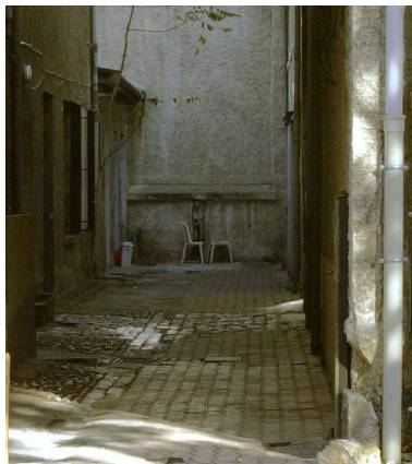
Vue depuis l'entrée du passage couvert IVR82_20086900710NUCA