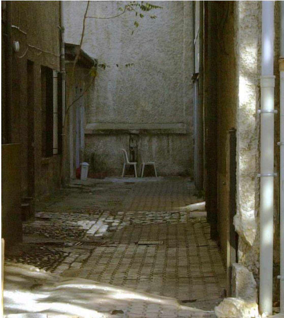
Vue depuis l'entrée du passage couvert