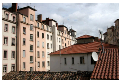
Élévation postérieure depuis un immeuble avenue Jean-Jaurès IVR82_20046904609NUCA