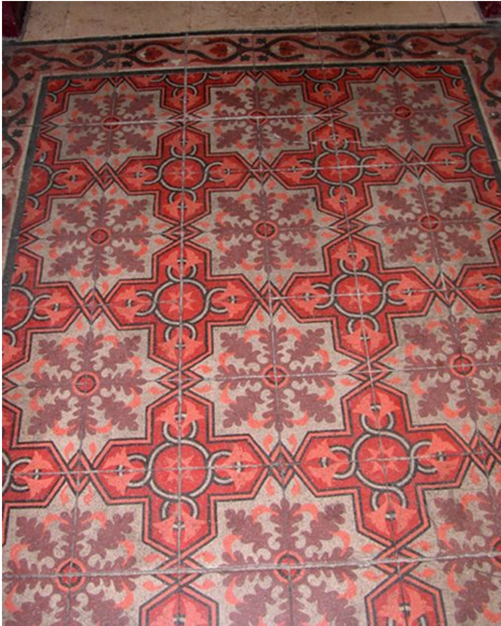
Carrelage en ciment moulé du vestibule