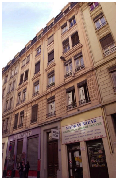
Élévation principale