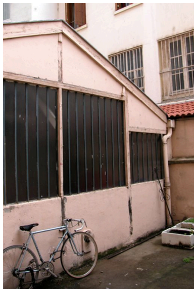
Atelier à gauche de la cour : imprimerie La Gryphe IVR82_20046904185NUCA