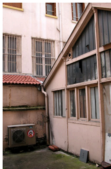
Atelier à droite de la cour : ancienne menuiserie IVR82_20046904184NUCA