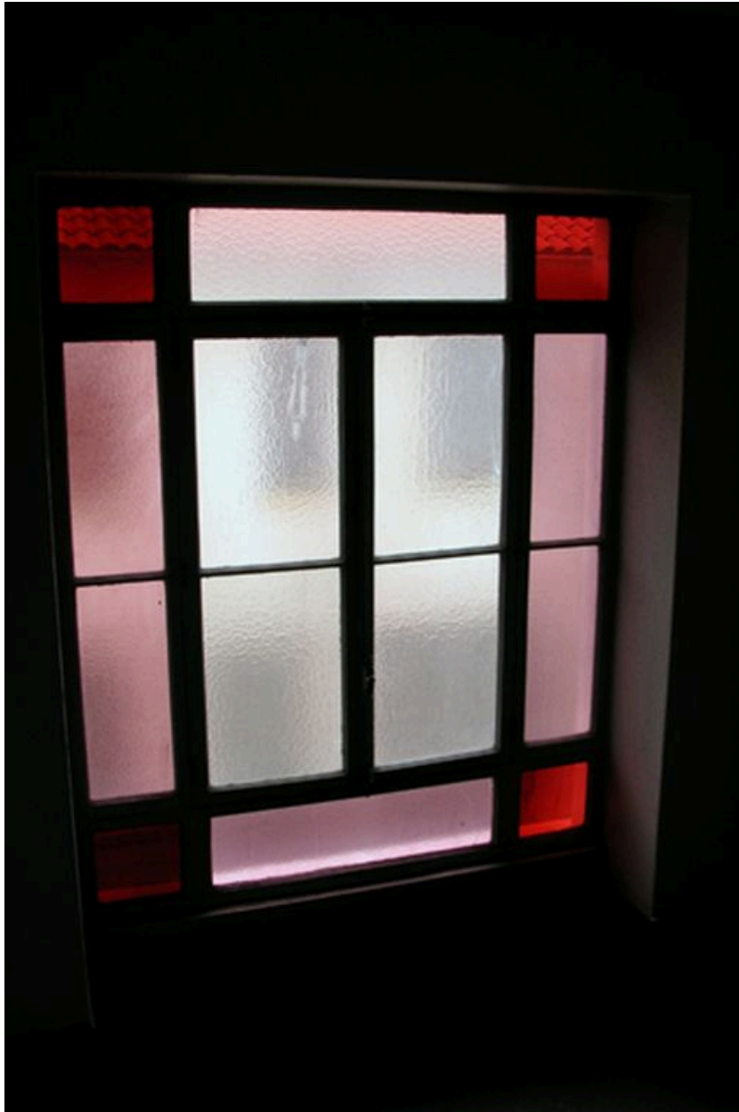
Fenêtre de la cage d'escalier