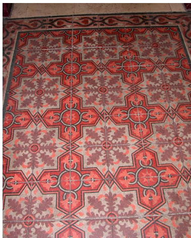
Carrelage en ciment moulé du vestibule