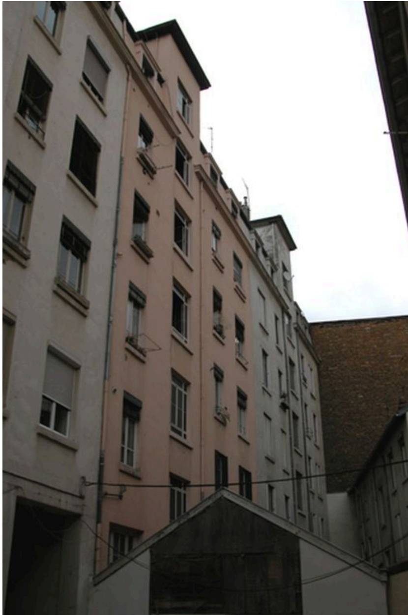
Elévation postérieure depuis AD 37