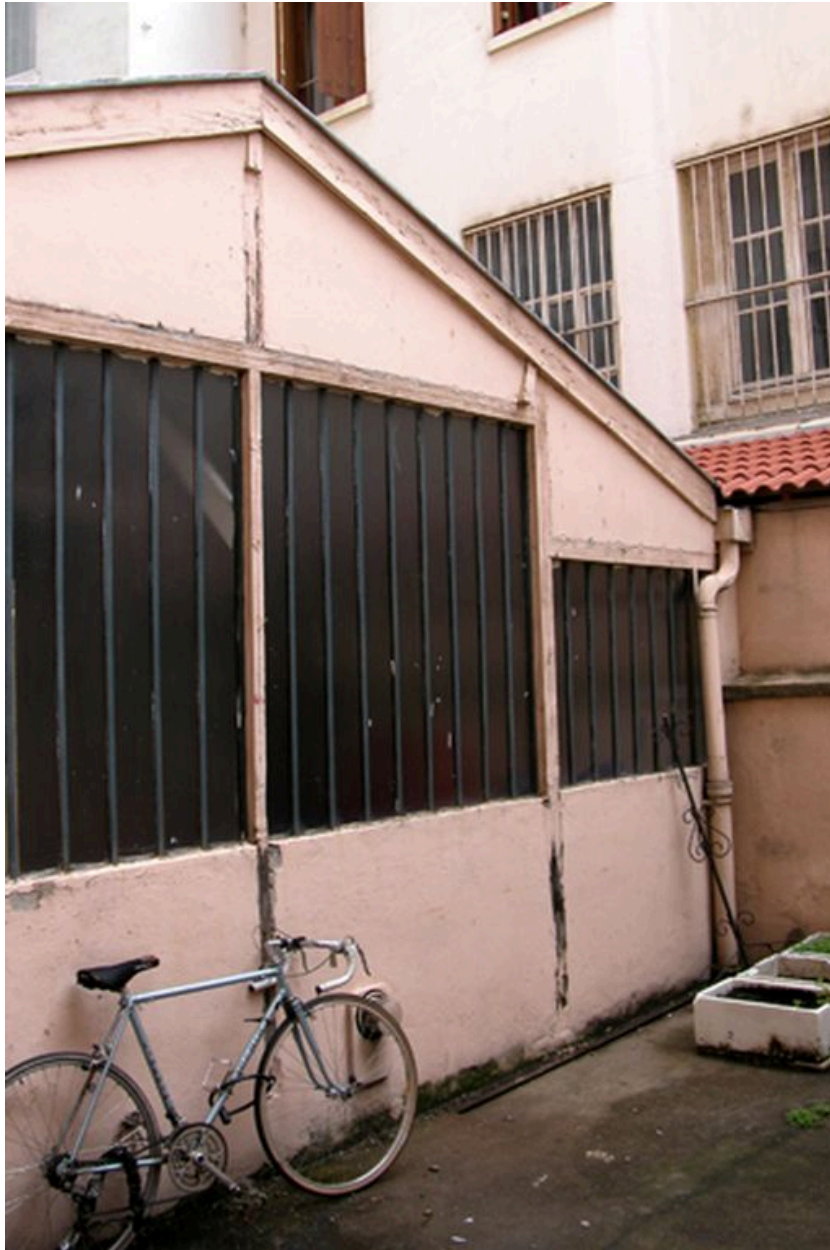
Atelier à gauche de la cour : imprimerie La Gryphe