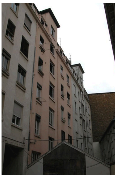
Élévation postérieure depuis AD 37 IVR82_20046904196NUCA