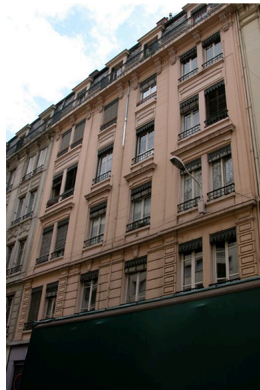
Détail de l'élévation sur rue