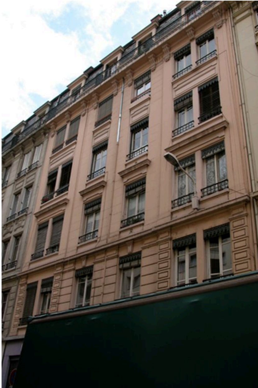
Détail de l'élévation sur rue