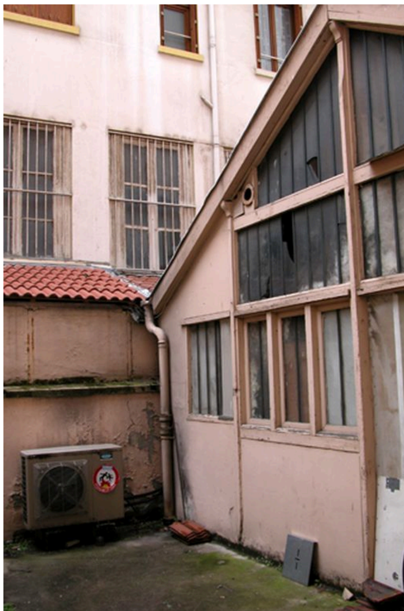
Atelier à droite de la cour : ancienne menuiserie