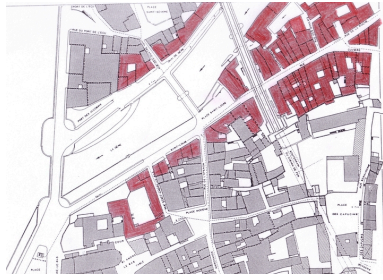
Plan Raymond, rue de la Roche et place Saint Louis vers chemin de fer, 1891 (1) IVR82_20123800195NUCA