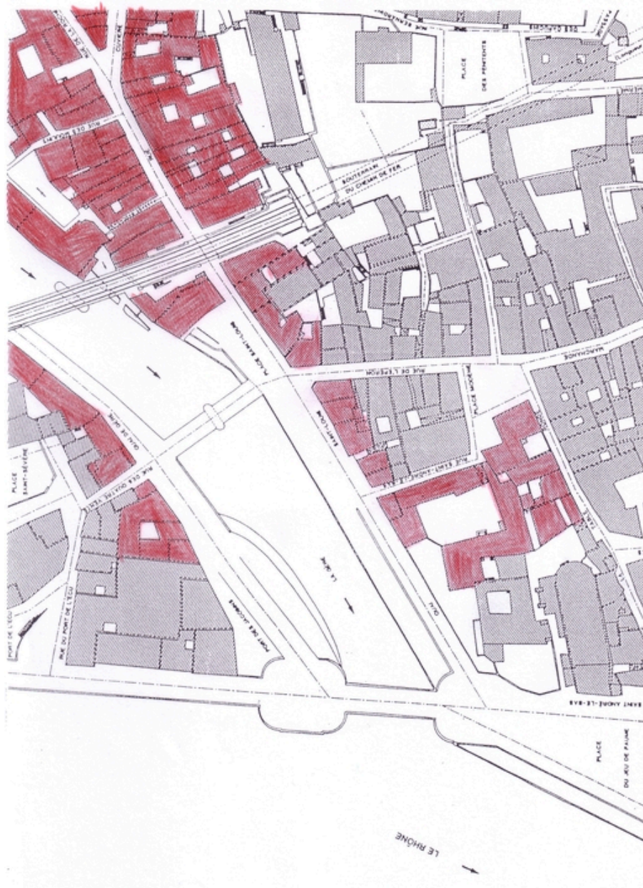
Plan Raymond, rue de la Roche, place Saint-Louis, 1875 (1)