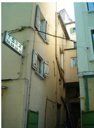
Façade latérale droite IVR82_20123800182NUCA