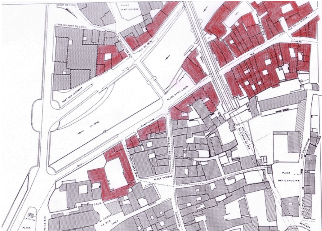
Plan Raymond, rue de la Roche et place Saint Louis vers chemin de fer, 1891 (1)