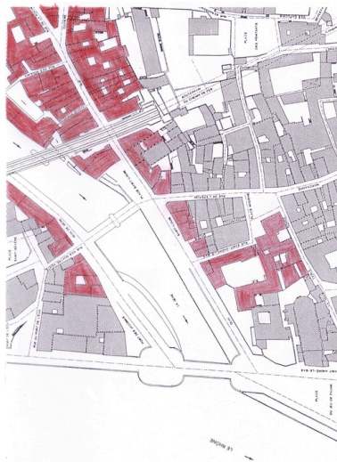
Plan Raymond, rue de la Roche, place Saint-Louis, 1875 (1)