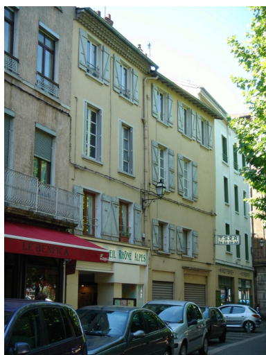
Façade sur rue IVR82_20123800181NUCA