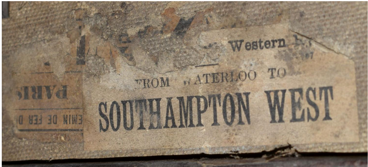
Détail - étiquette transports chemins de fer (sur l'extérieur de la boîte)