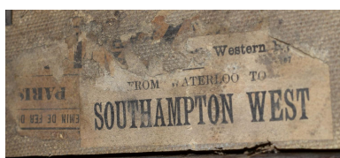
Détail - étiquette transports chemins de fer (sur l'extérieur de la boîte)