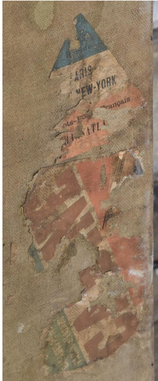
Détail - étiquette transport transatlantique (sur l'extérieur de la boîte)