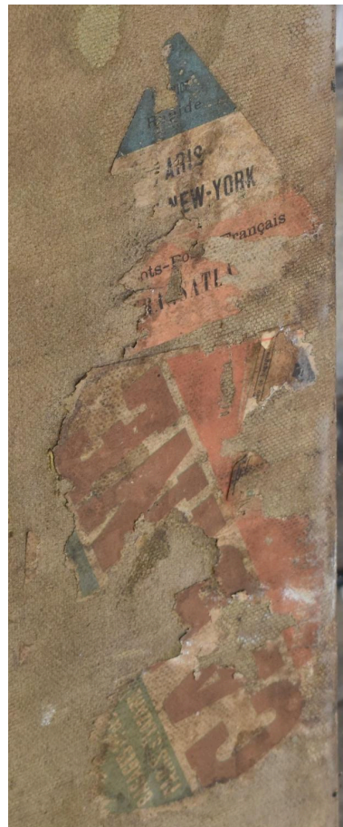
Détail - étiquette transport transatlantique (sur l'extérieur de la boîte) IVR84_20226300744NUCA