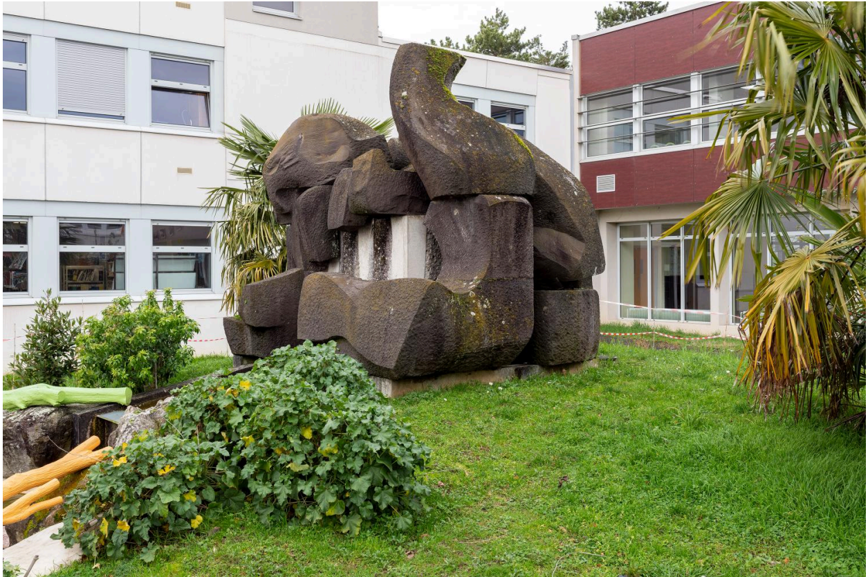
Vue de côté.