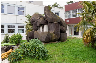
Vue de côté. IVR84_20216900244NUCA