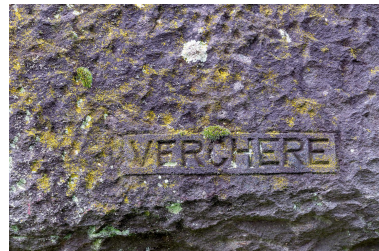
Signature.