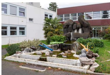
Vue d'ensemble. IVR84_20216900242NUCA