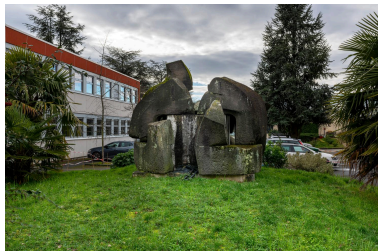
Vue de dos. IVR84_20216900245NUCAQ