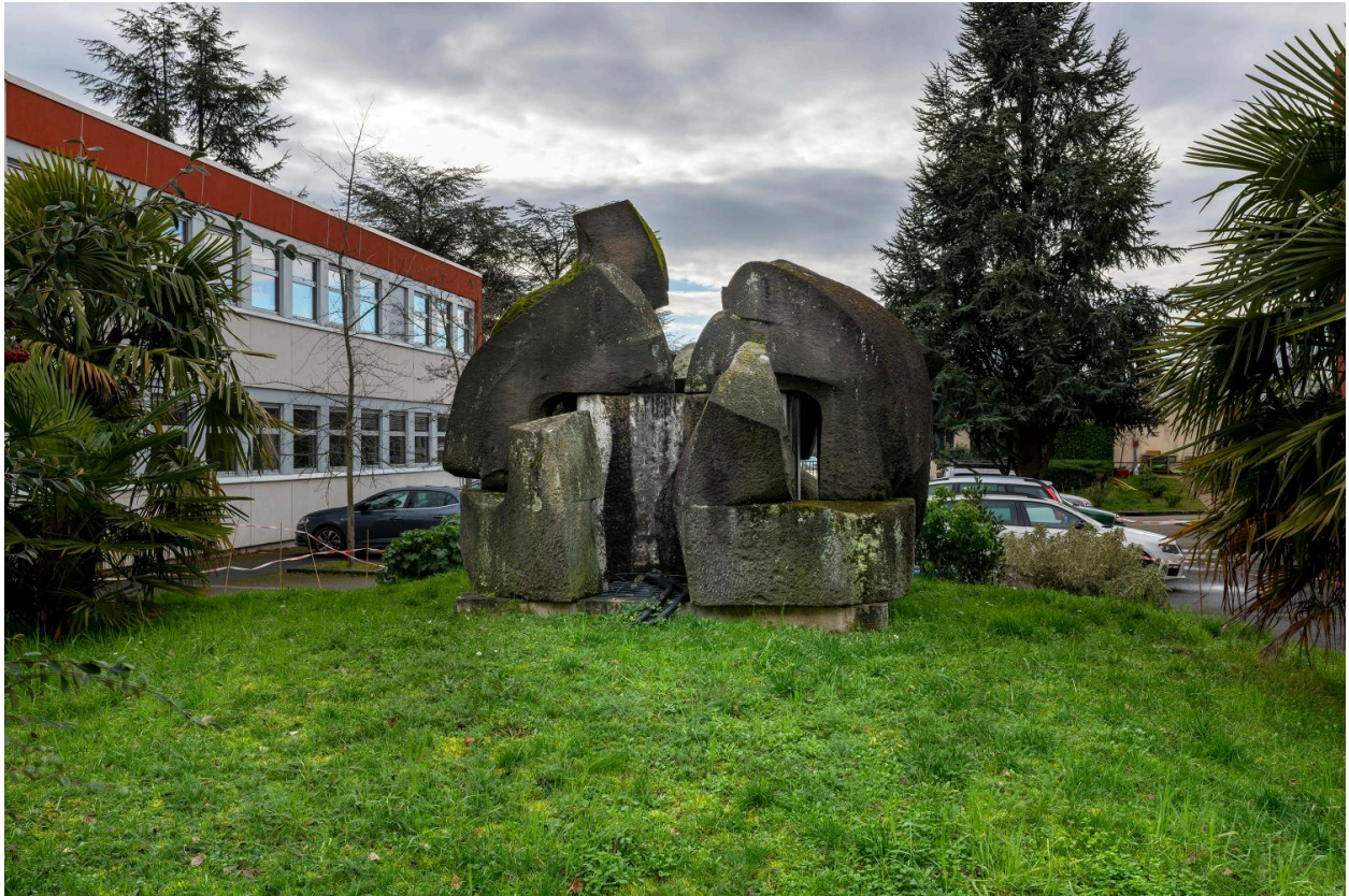
Vue de dos.