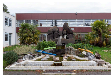
Vue de face. IVR84_20216900243NUCA