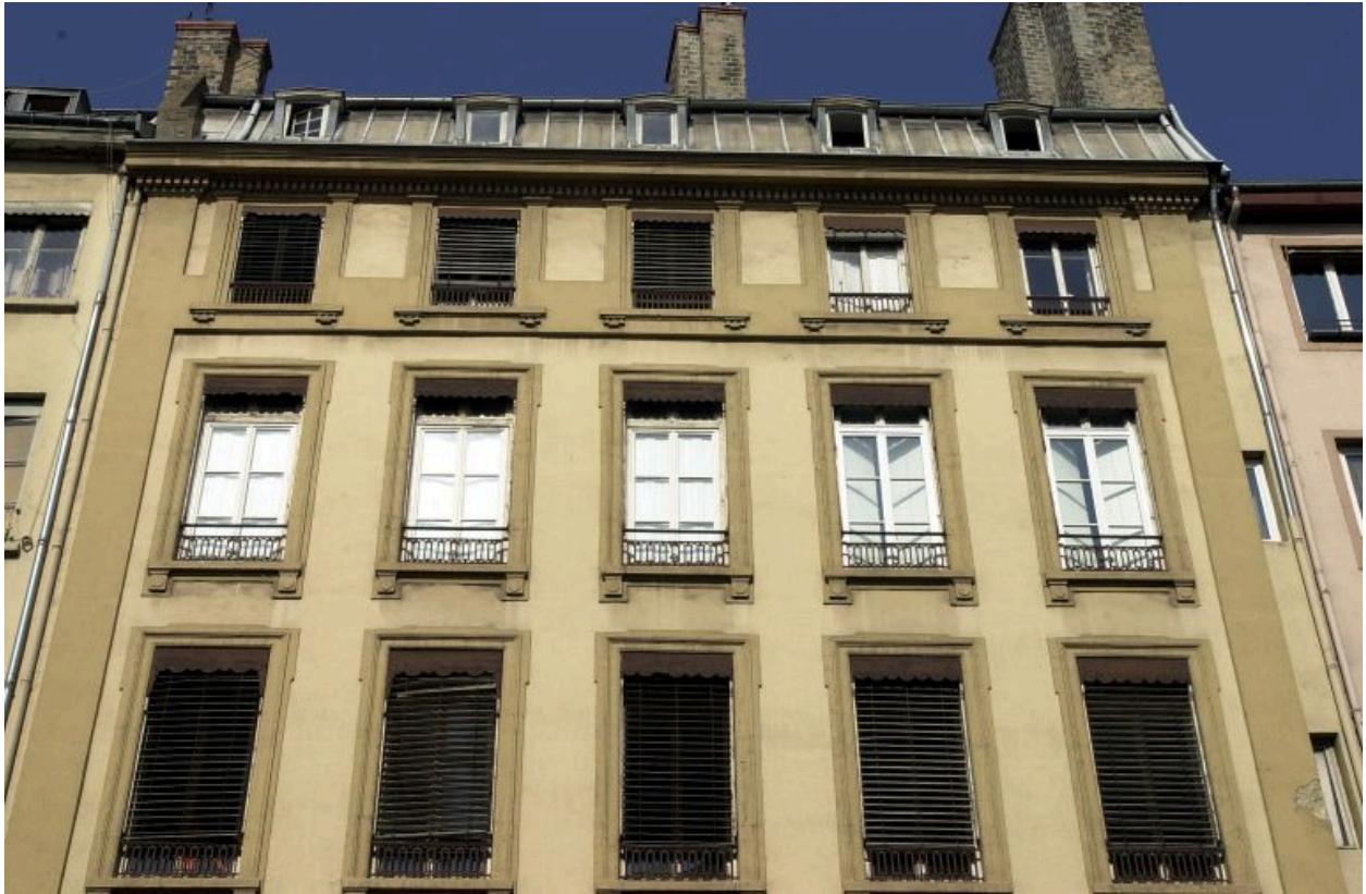
Façade, détail des étages carrés