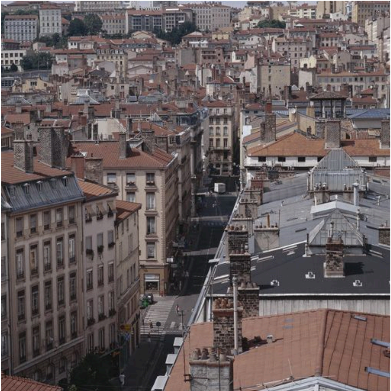
Vue générale de situation depuis la tour nord de la collégiale Saint-Nizier