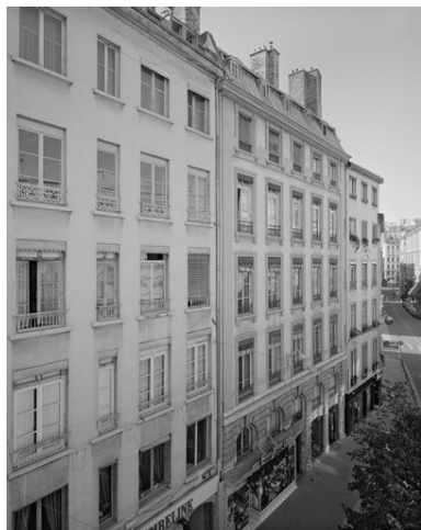
Vue générale de la façade IVR82_20056901743V

Plan-masse des deux anciens immeubles, extrait de : Plans géométriques (...) de la rente noble de labbaye royale de Saint- Pierre, 1755-1756, feuille 20 IVR82_20056900438NUCA