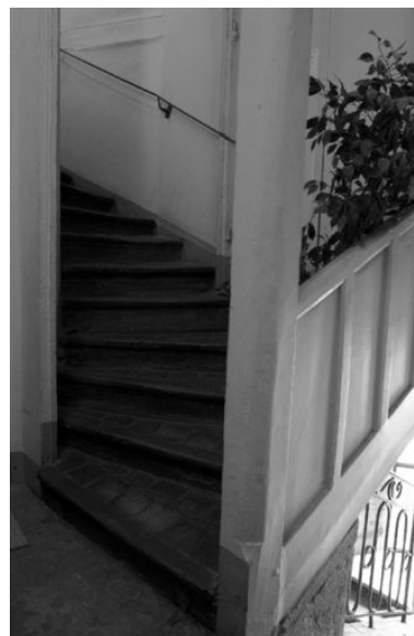
Petit escalier desservant l'étage de combles, au sommet du grand