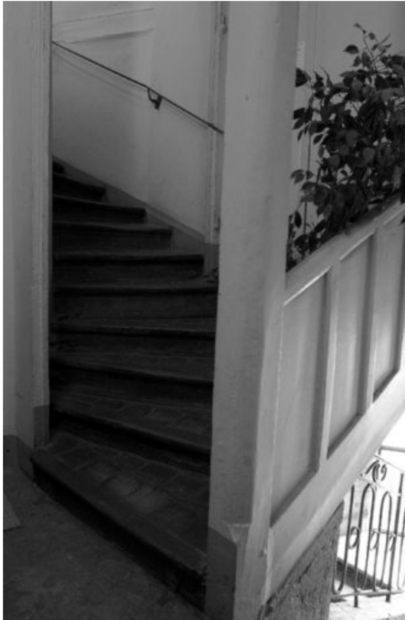
Petit escalier desservant l'étage de combles, au sommet du grand