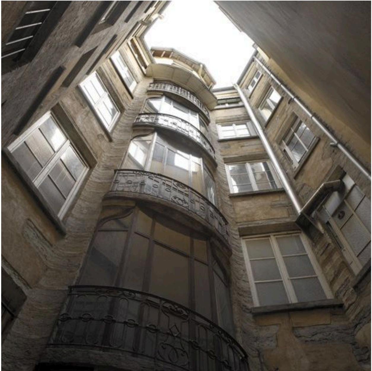
Vue générale par-dessous des élévations sur cour