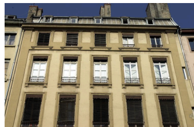
Façade, détail des étages carrés IVR82_20036901480NUCA