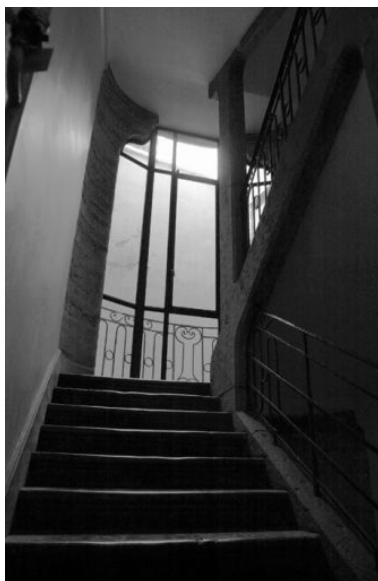
Escalier, vue vers un repos IVR82_20036901482NUC