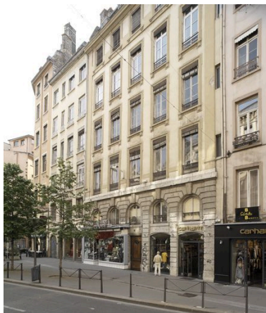
Vue générale de la façade depuis le sol