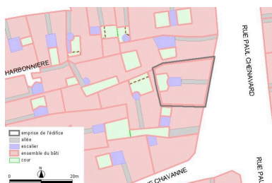
Plan-masse, d'après le système urbain de référence, version 1999 IVR82_20056902698NUDA