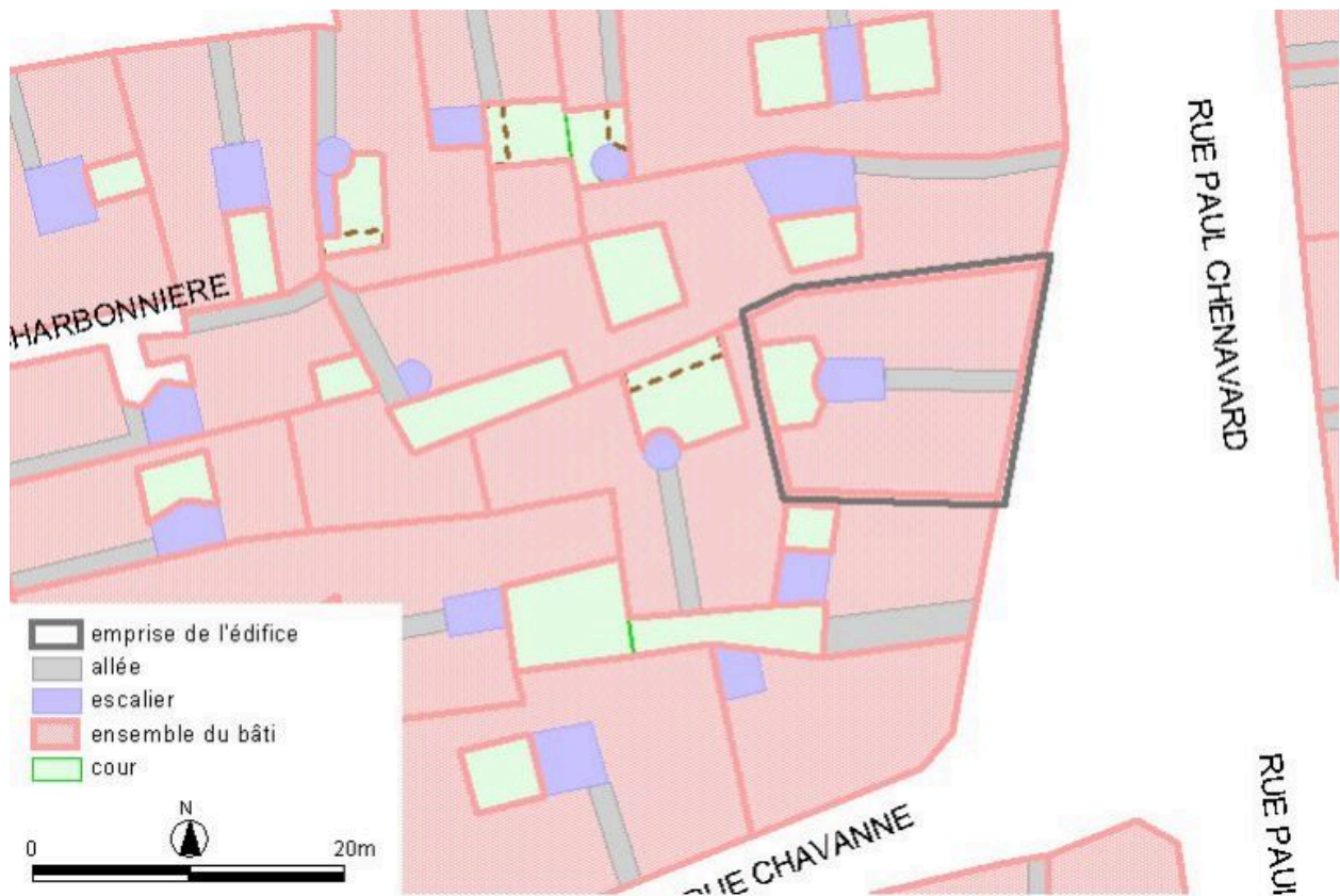
Plan-masse, d'après le système urbain de référence, version 1999