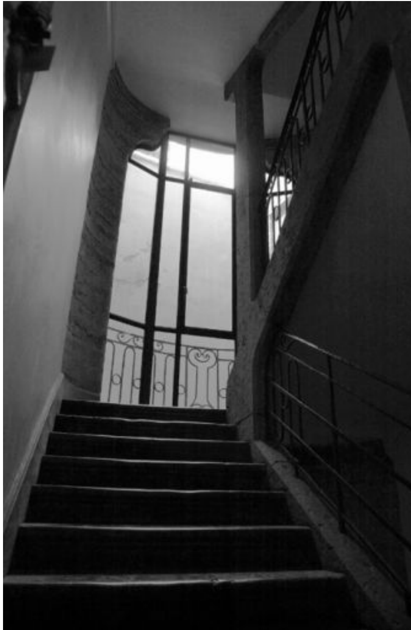
Escalier, vue vers un repos