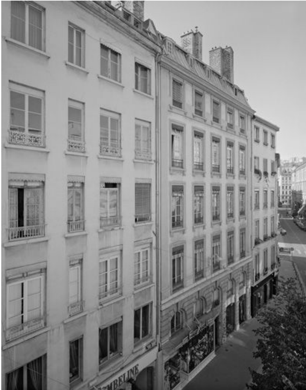
Vue générale de la façade