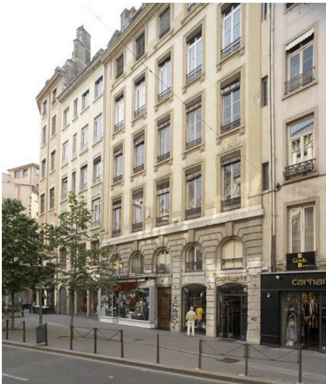
Vue générale de la façade depuis le sol