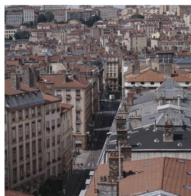
Vue générale de situation depuis la tour nord de la collégiale Saint-Nizier IVR82_20056901768XA