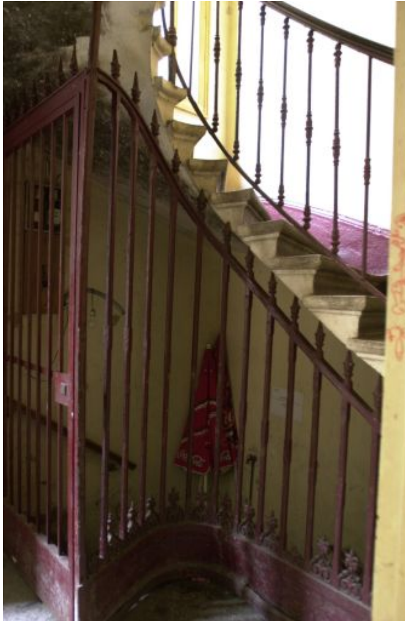
Détail de la grille fermant l'entrée de la cave, 9 cours Charlemagne