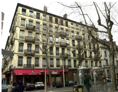
Elévation, 25 cours Suchet IVR82_20016901241NUCA