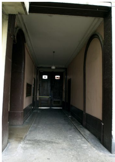
Passage couvert du 9 cours Charlemagne, depuis la cour