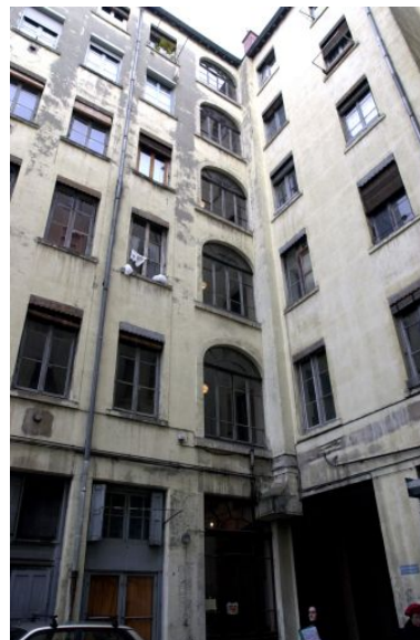
Vue de la travée d'escalier du 25 cours Suchet depuis l'angle sud-ouest de la cour IVR82_20016901245NUCA