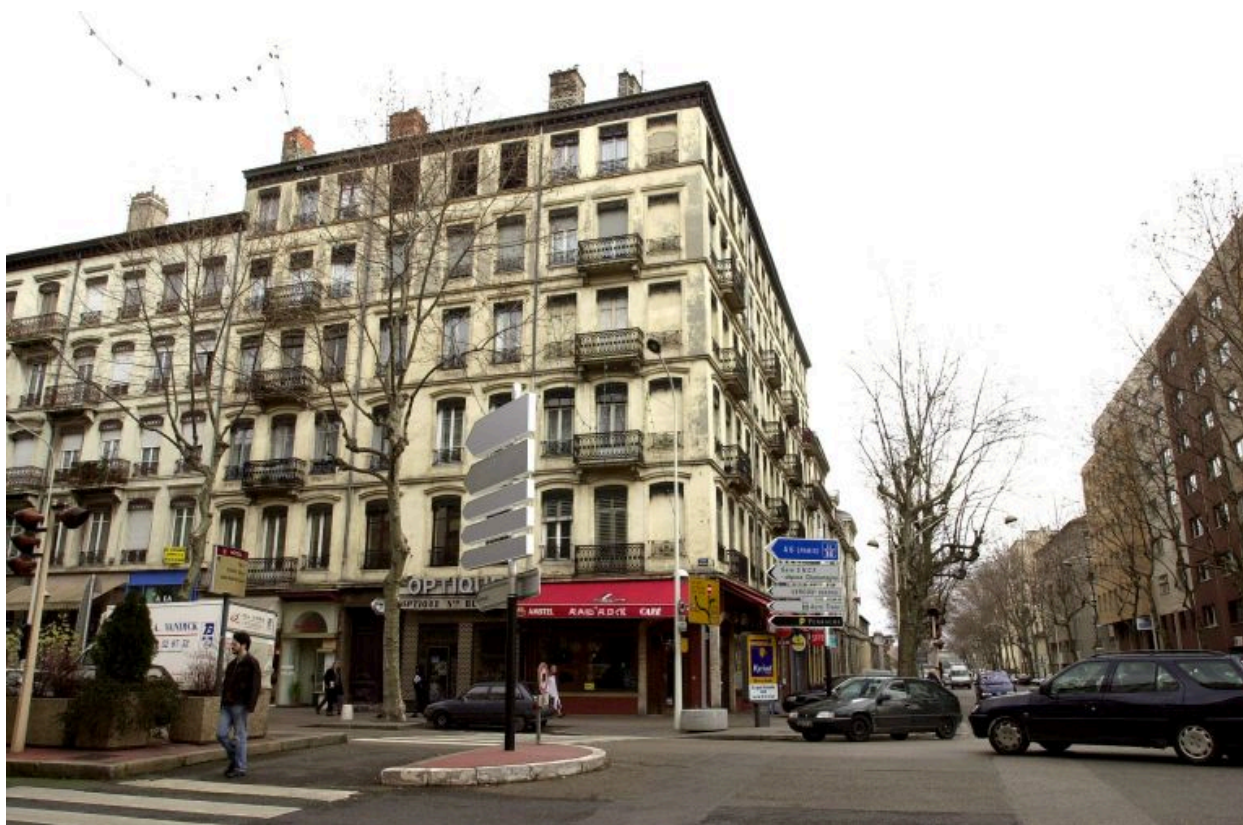
Vue générale depuis l'ouest