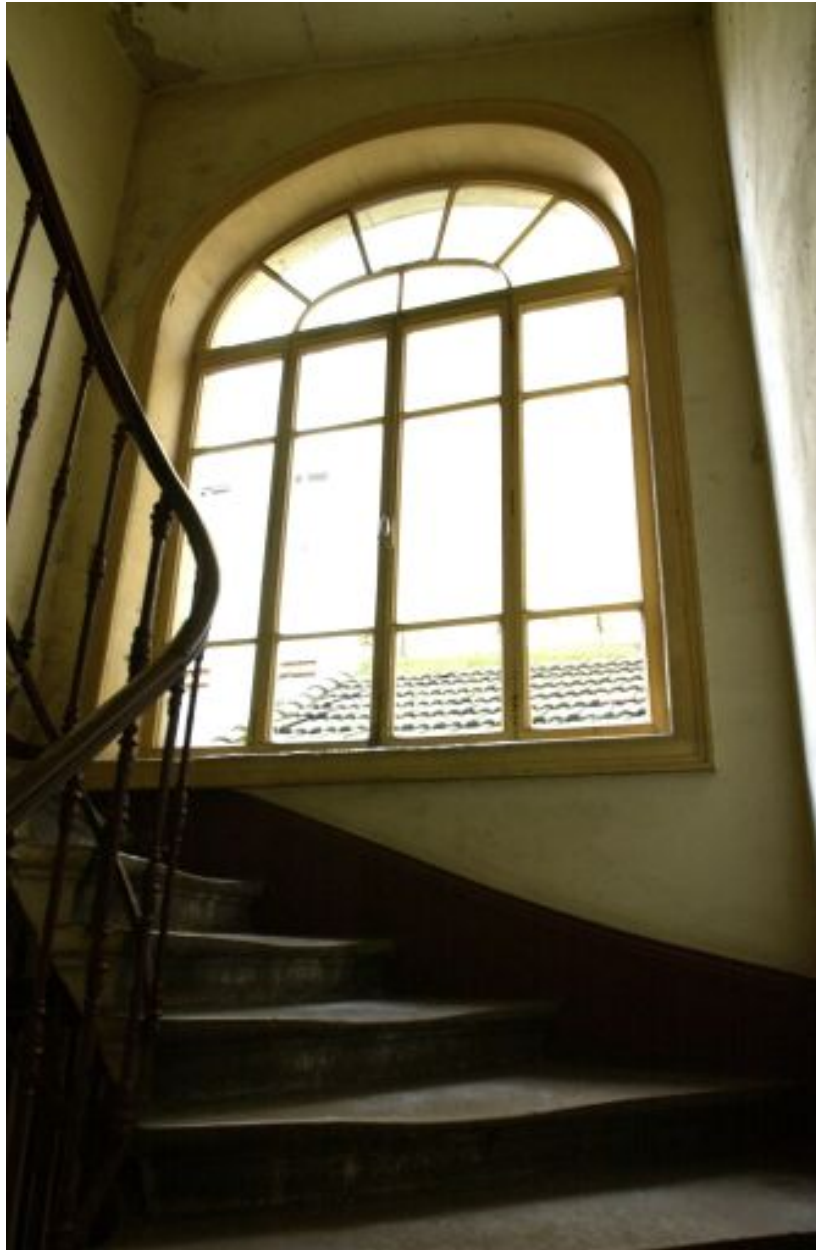
Détail de la fenêtre de la cage d'escalier, 9 cours Charlemagne