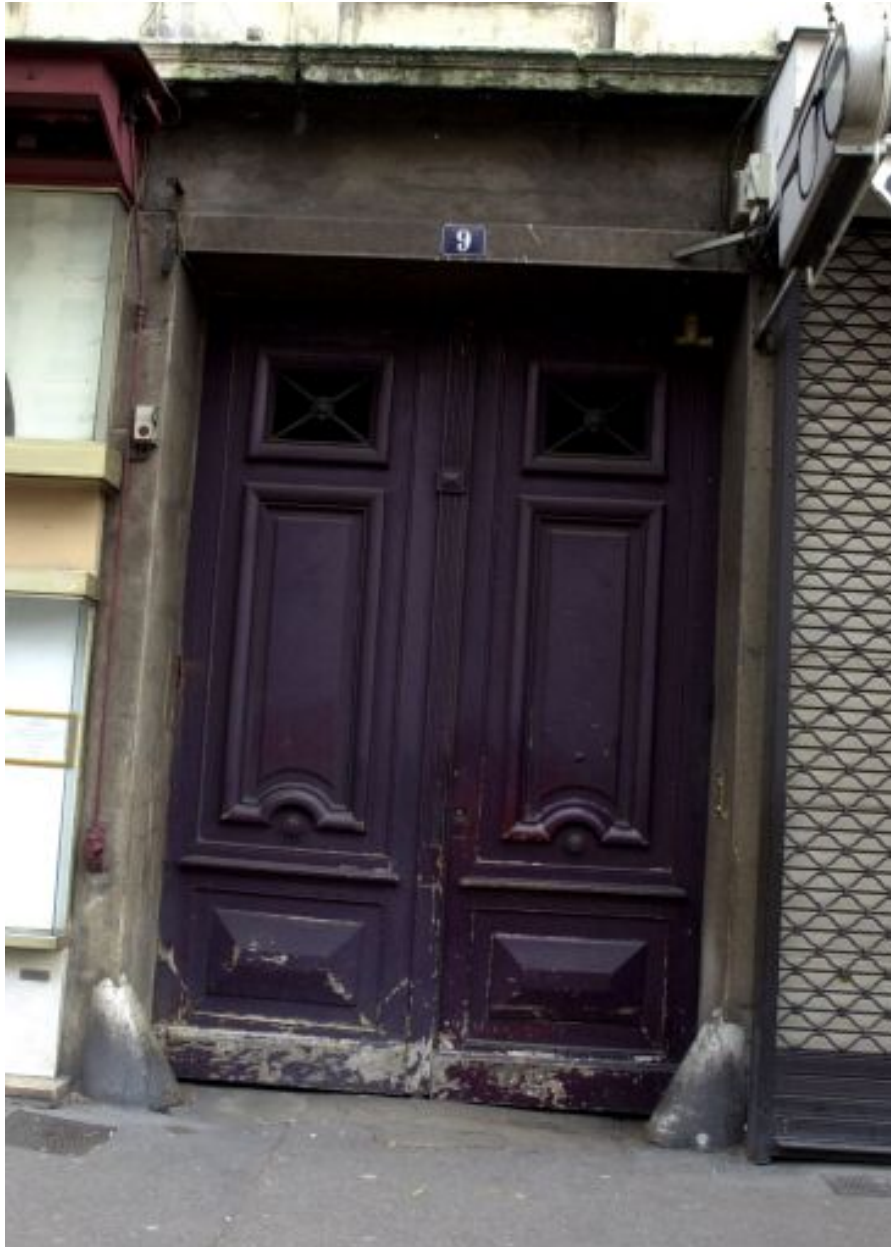
Porte d'entrée, 9 cours Charlemagne