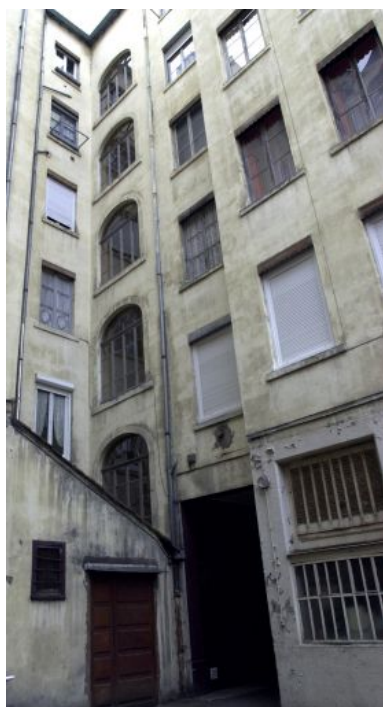
Vue de la travée d'escalier du 9 cours Charlemagne depuis l'angle sud-est de la cour