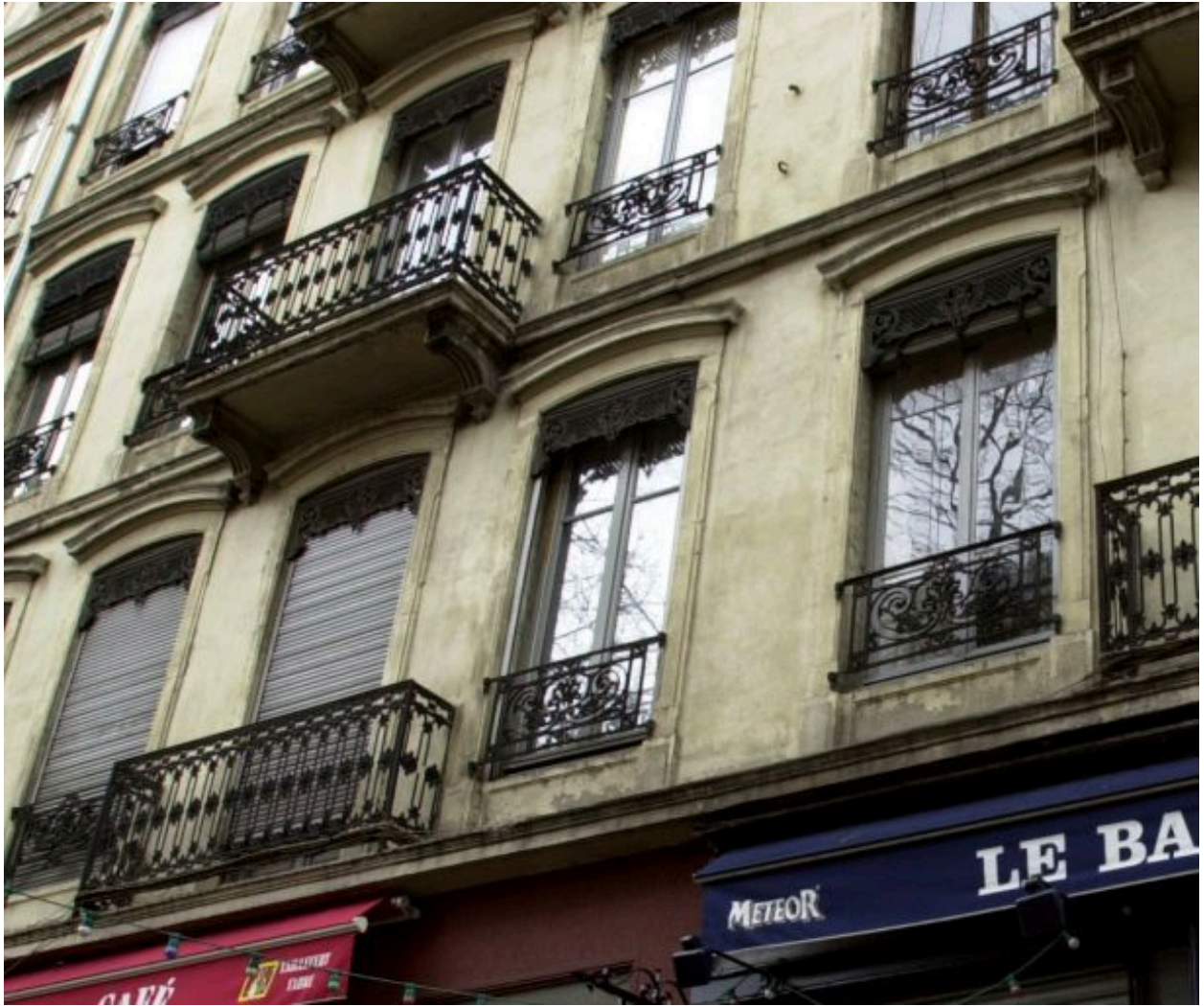
Détail des fenêtres, 25 cours Suchet