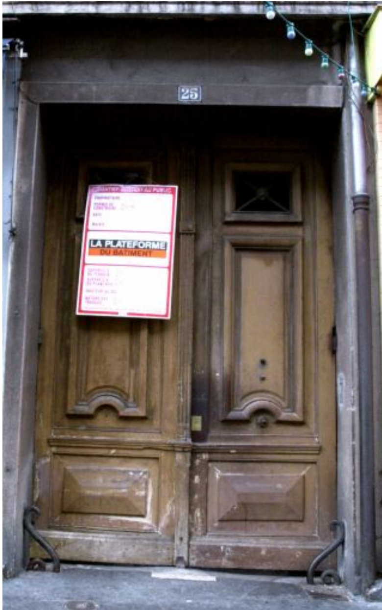
Porte d'entrée, 25 cours Suchet