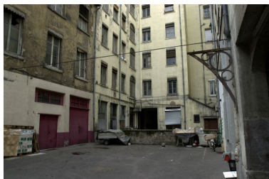
Elévation postérieure du 25 cours Suchet