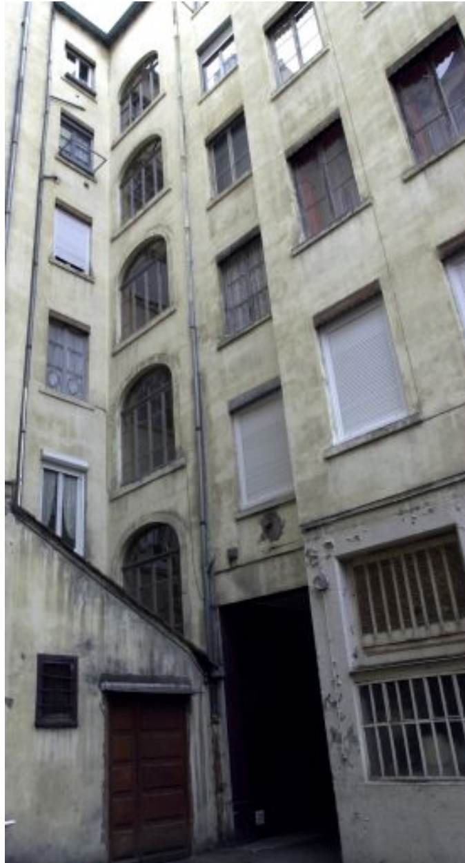
Vue de la travée d'escalier du 9 cours Charlemagne depuis l'angle sud-est de la cour