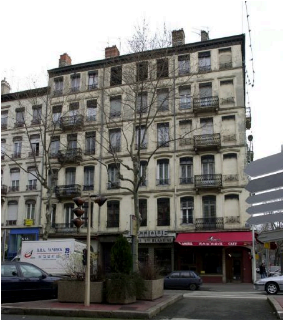
Elévation, 9 cours Charlemagne