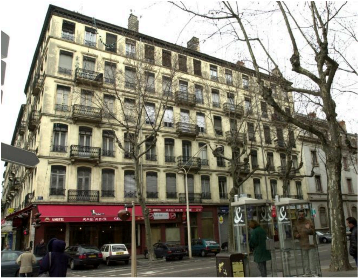
Elévation, 25 cours Suchet