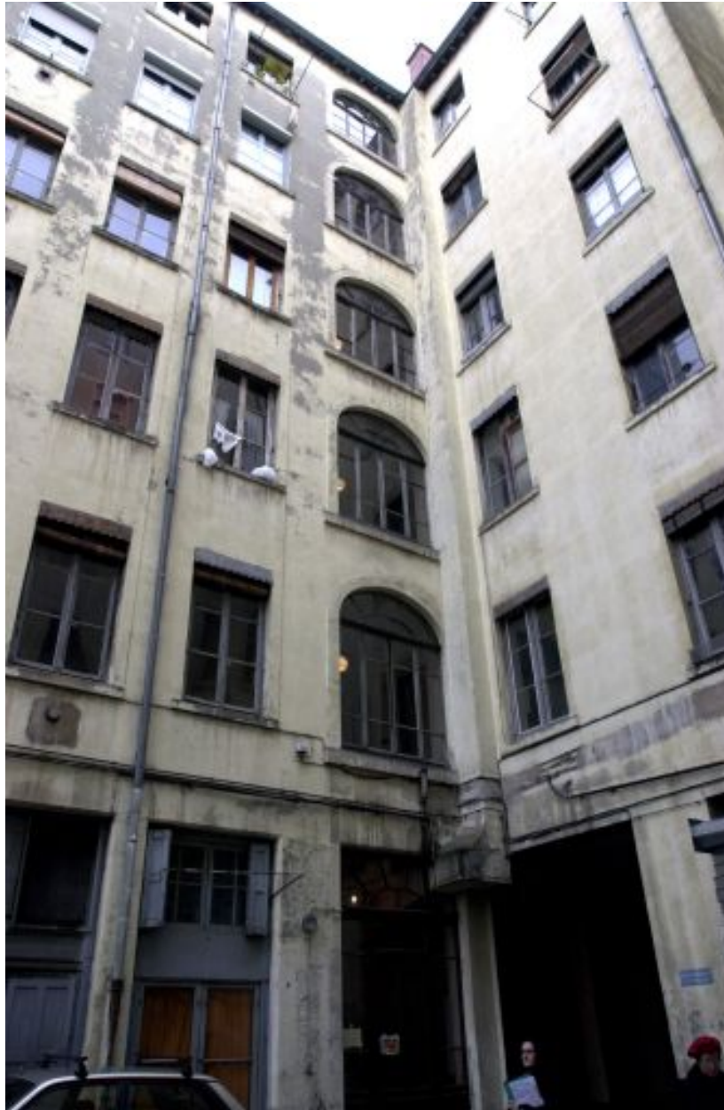
Vue de la travée d'escalier du 25 cours Suchet depuis l'angle sud-ouest de la cour