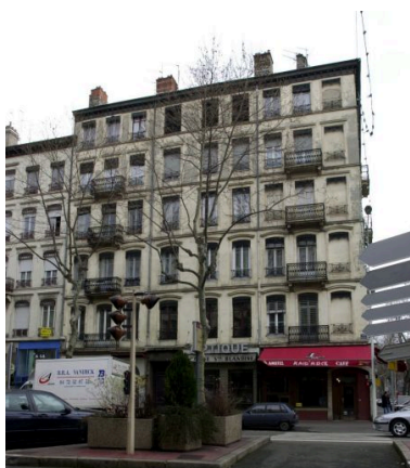
Elévation, 9 cours Charlemagne IVR82_20016901252NUCA