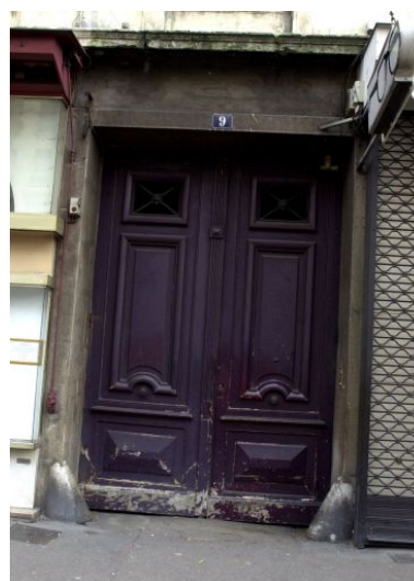
Porte d'entrée, 9 cours Charlemagne IVR82_20016901254NUCA