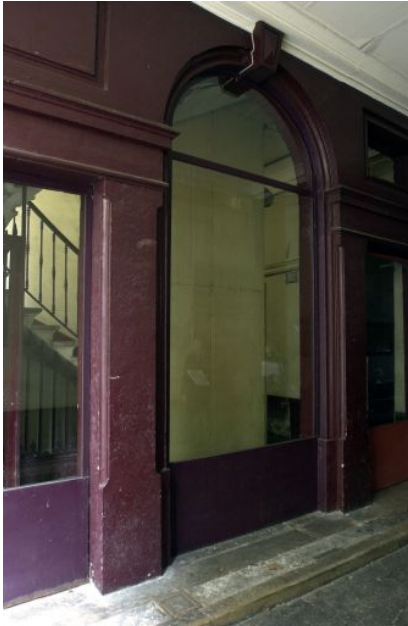
Entrée de la cage d'escalier du 9 cours Charlemagne