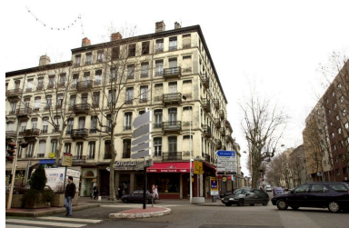
Vue générale depuis l'ouest IVR82_20016901251NUCA