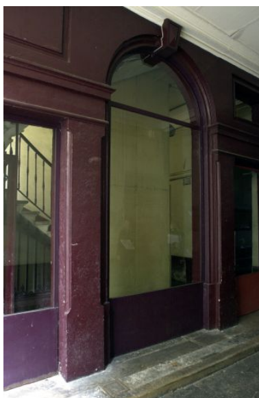
Entrée de la cage d'escalier du 9 cours Charlemagne