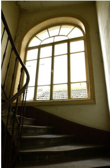
Détail de la fenêtre de la cage d'escalier, 9 cours Charlemagne