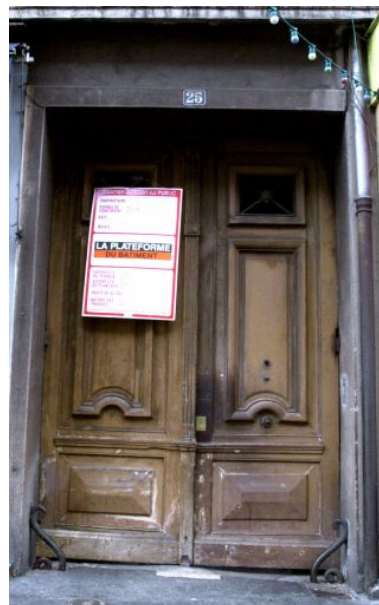
Porte d'entrée, 25 cours Suchet IVR82_20016901243NUCA