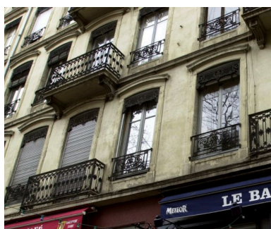
Détail des fenêtres, 25 cours Suchet IVR82_20016901242NUCA