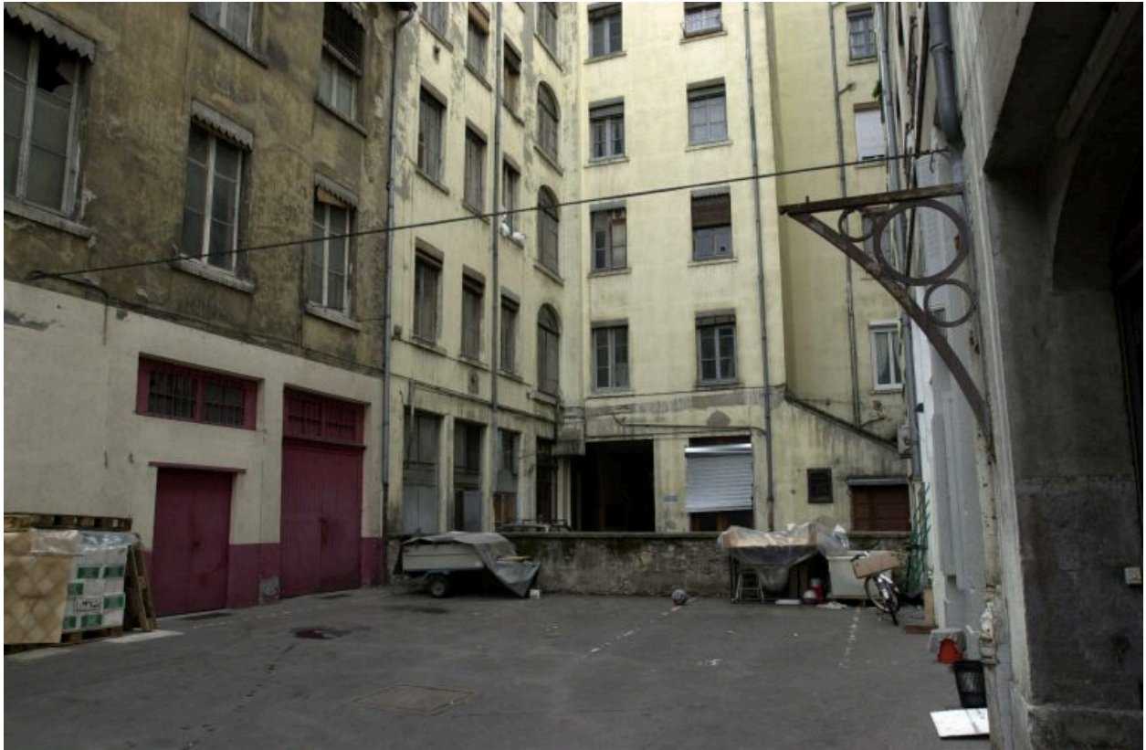
Elévation postérieure du 25 cours Suchet