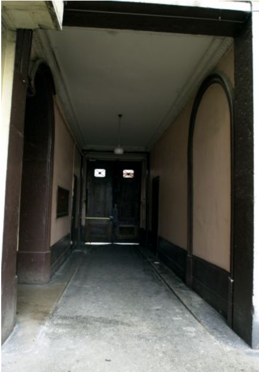
Passage couvert du 9 cours Charlemagne, depuis la cour