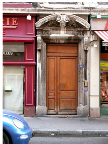
Façade principale, porte IVR82_20046900999NUCA