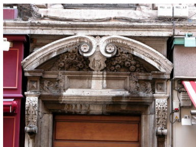
Façade principale, détail de la porte