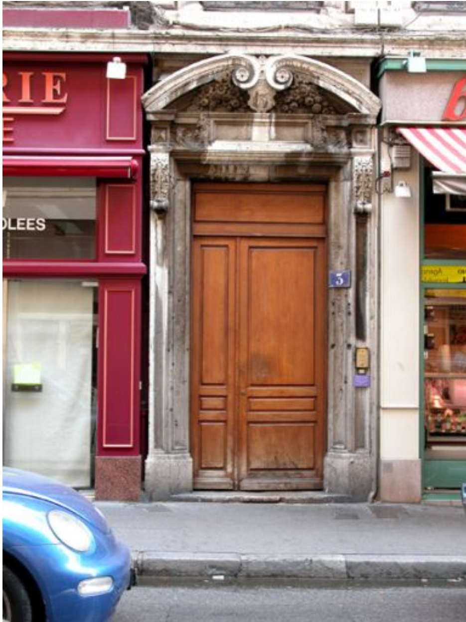
Façade principale, porte