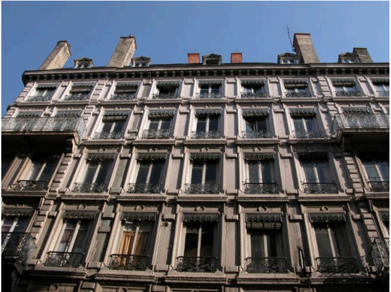
Façade principale rue Grenette, vue par-dessous