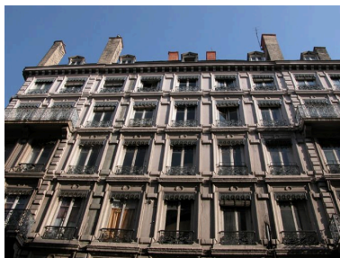
Façade principale rue Grenette, vue par-dessous