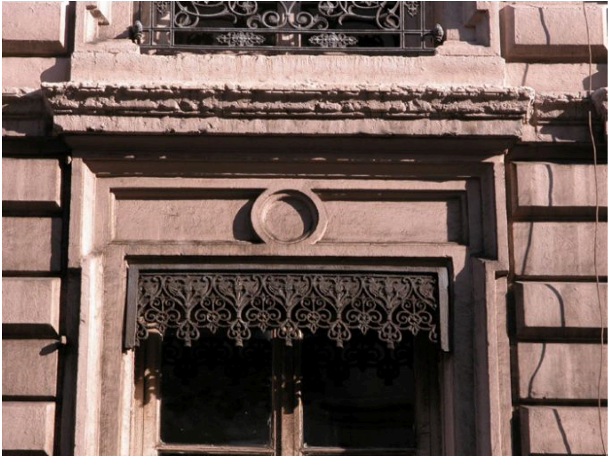
Façade principale, 2e niveau, détail de la fenêtre centrale