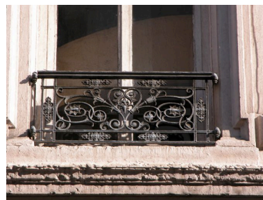
Façade principale, 3e niveau, détail de la fenêtre centrale IVR82_20046905702NUCA