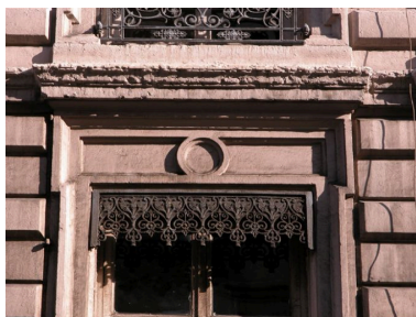
Façade principale, 2e niveau, détail de la fenêtre centrale