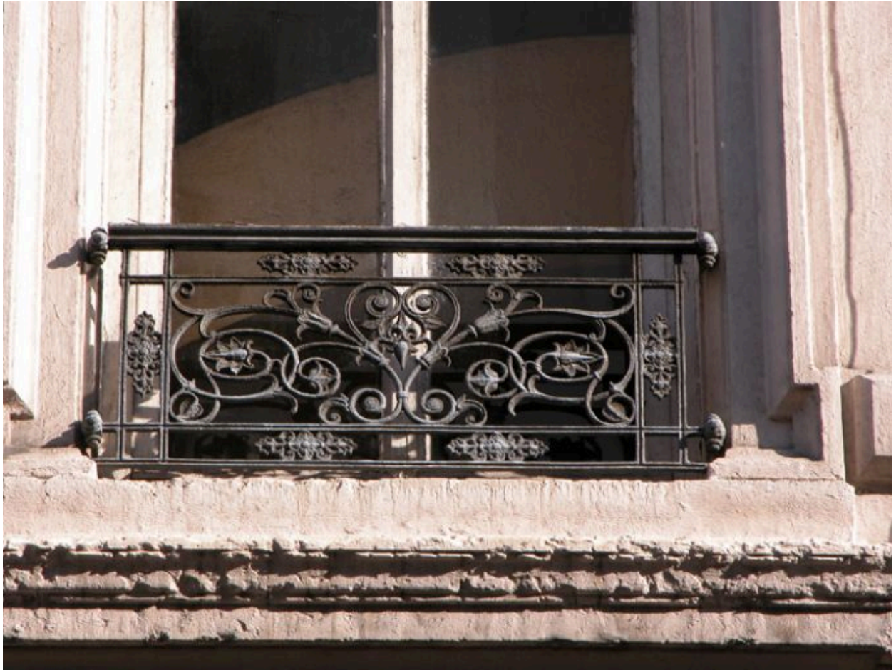
Façade principale, 3e niveau, détail de la fenêtre centrale