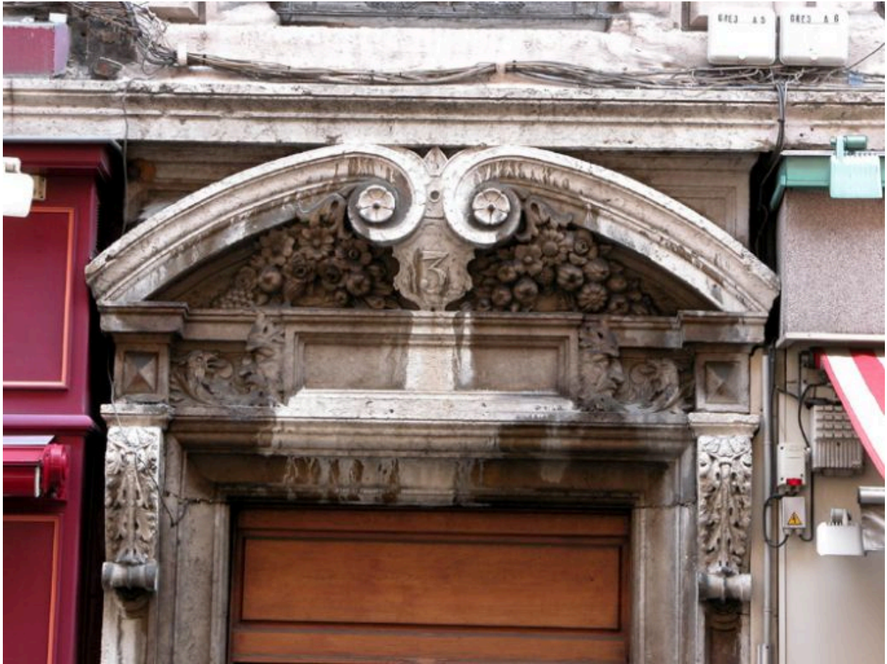
Façade principale, détail de la porte