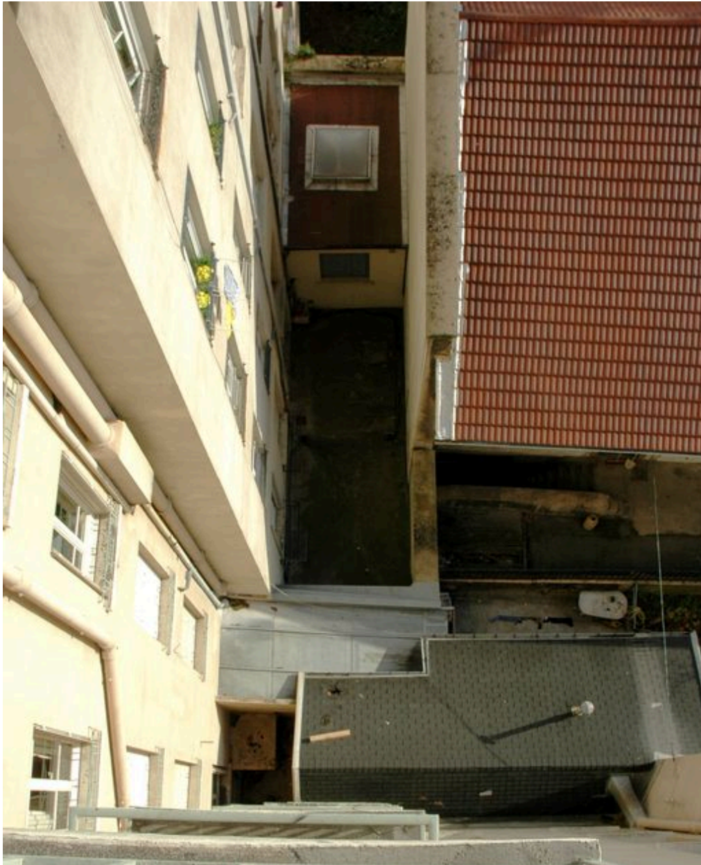
La cour vue depuis le 279 rue de Créqui