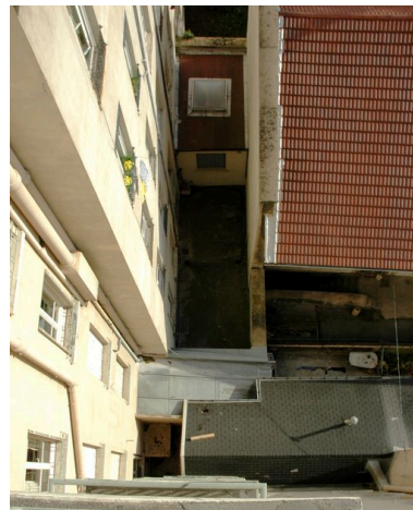
La cour vue depuis le 279 rue de Créqui IVR82_20076900448NUCA