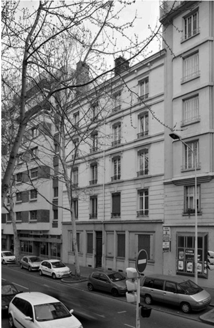
Vue générale depuis le nord-ouest