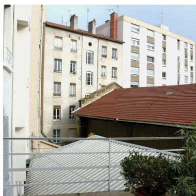
Elévation postérieure IVR82_20076900357NUCA