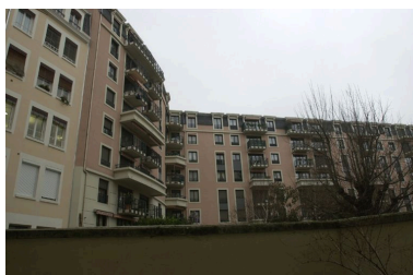
Vue de l'élévation postérieure depuis l'escalier du 3, avenue Jean-Jaurès IVR82_20046904329NUCA