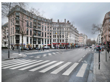
Vue générale depuis le nord IVR84_20186900184NUCAQ