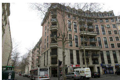
Vue générale de l'élévation sur la place Victor-Basch