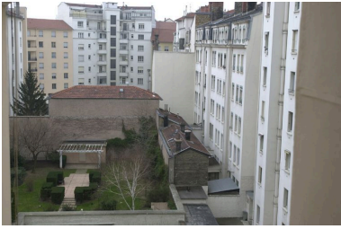
Vue du jardin depuis l'escalier du 56, cours Gambetta