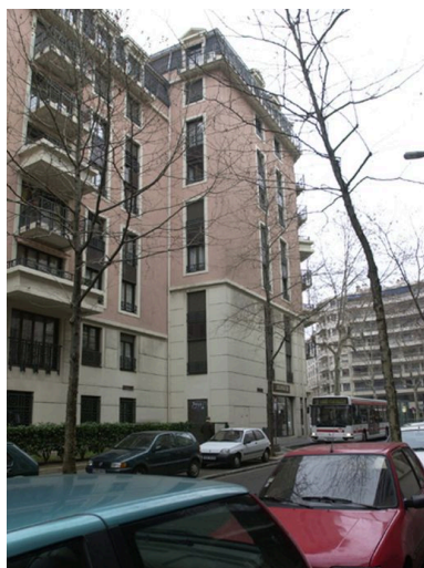
Elévation sur la rue Jean- Marie-Chavant depuis le sud IVR82_20046904328NUCA