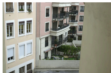
Vue sur le jardin depuis l'escalier du 3, avenue Jean-Jaurès IVR82_20046904330NUCA