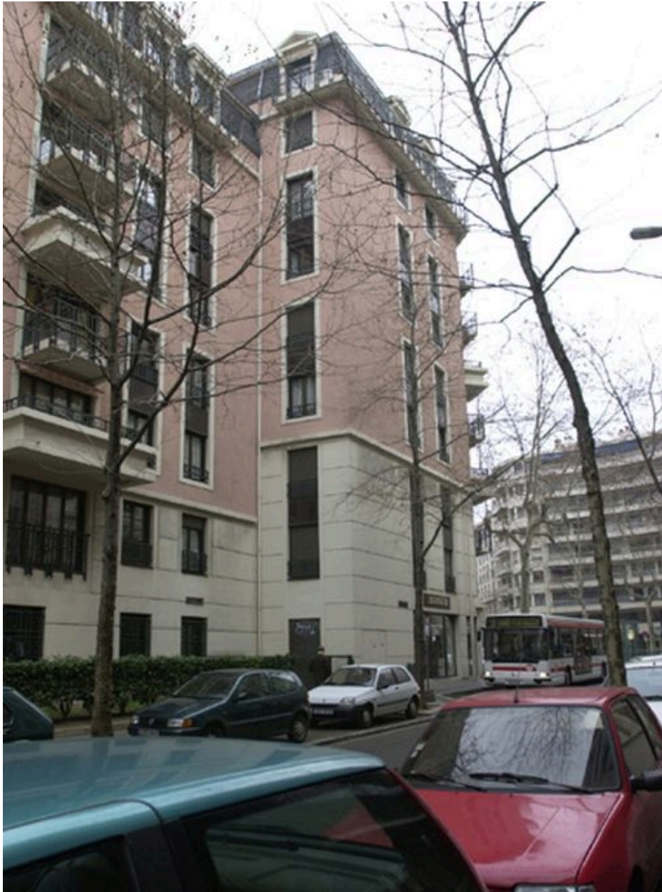
Elévation sur la rue Jean-Marie-Chavant depuis le sud