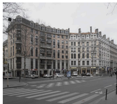
Elévation place Victor-Basch