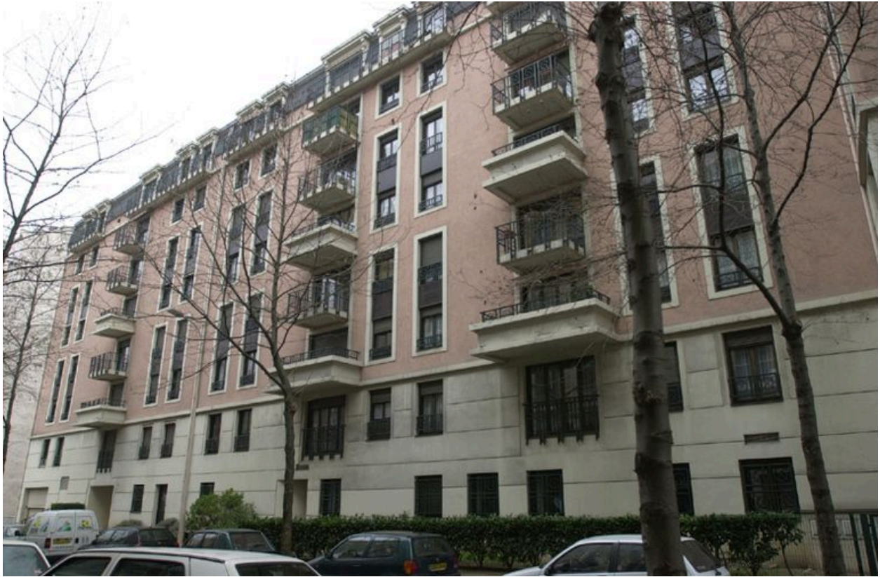
Elévation sur la rue Jean-Marie-Chavant (2)