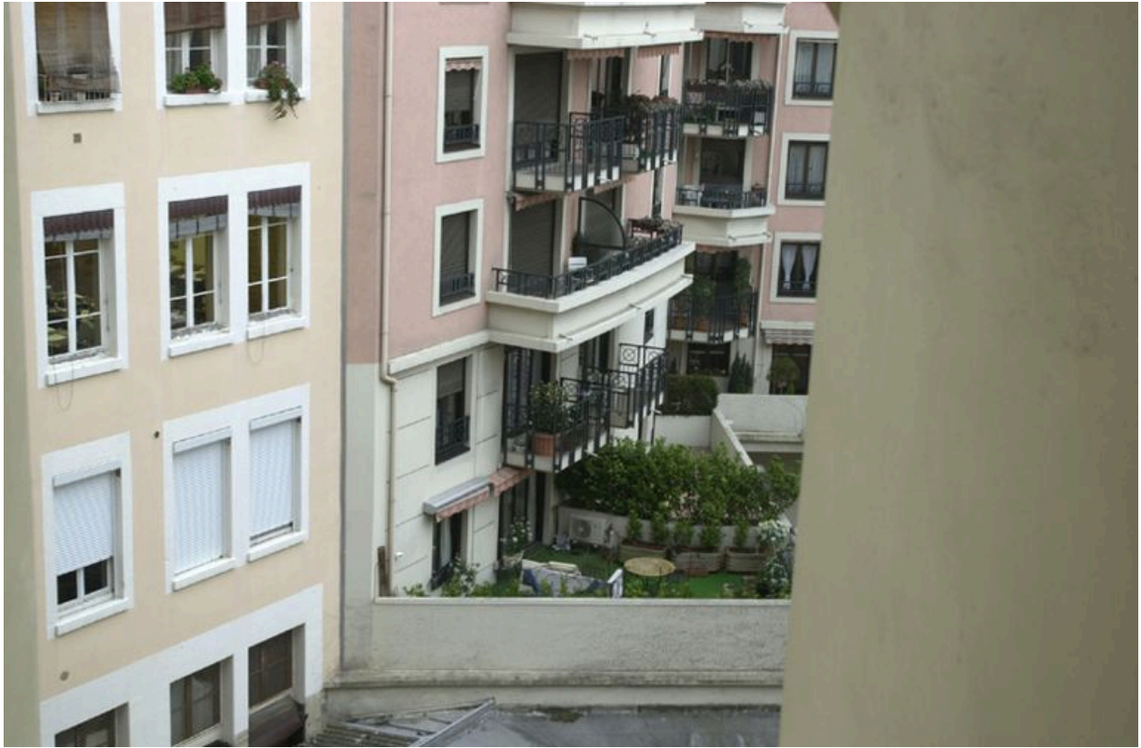
Vue sur le jardin depuis l'escalier du 3, avenue Jean-Jaurès