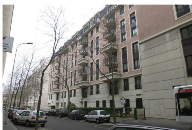
Elévation sur la rue Jean-Marie-Chavant IVR82_20046904326NUCA