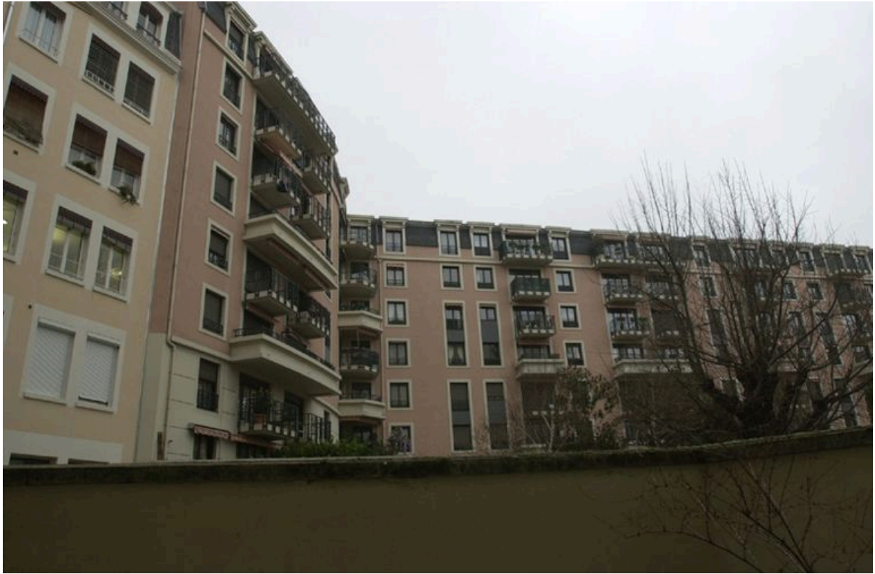
Vue de l'élévation postérieure depuis l'escalier du 3, avenue Jean-Jaurès