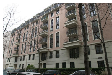
Elévation sur la rue Jean-Marie-Chavant (2) IVR82_20046904327NUCA