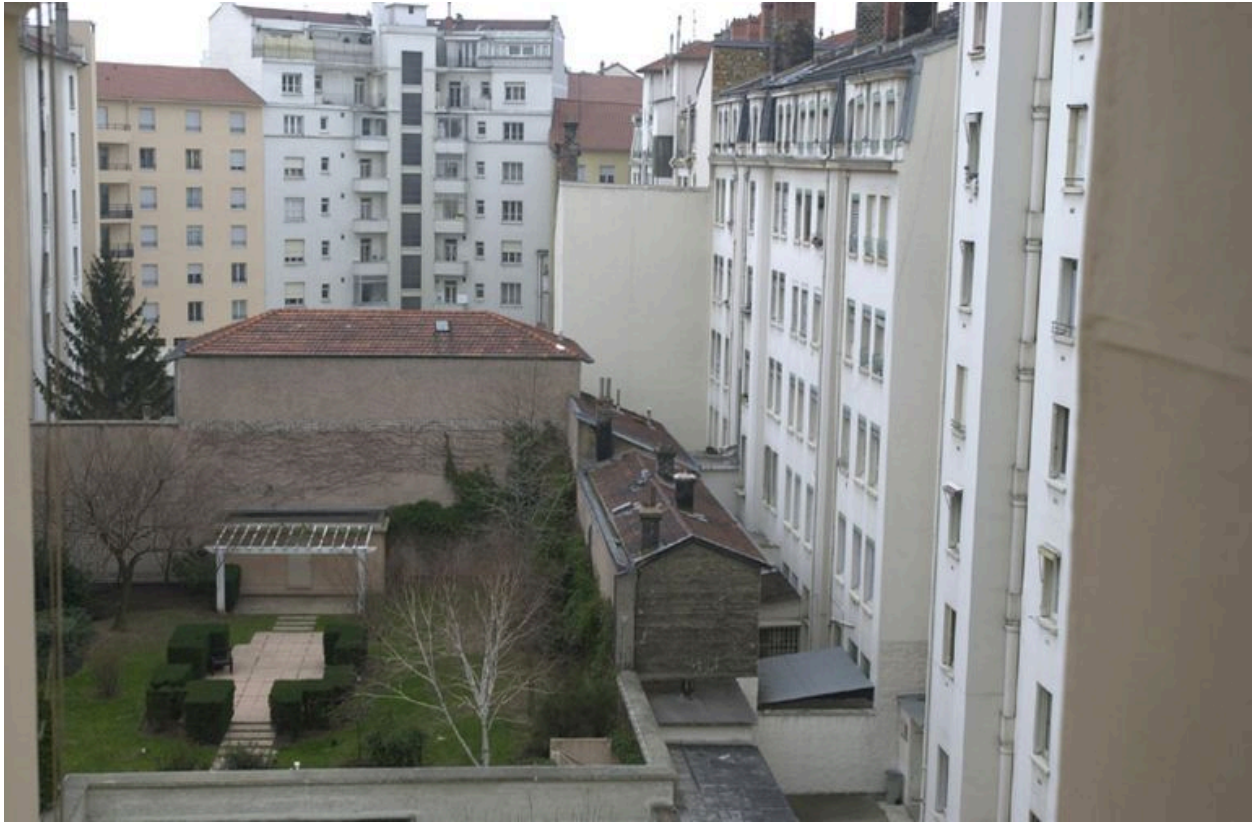
Vue du jardin depuis l'escalier du 56, cours Gambetta