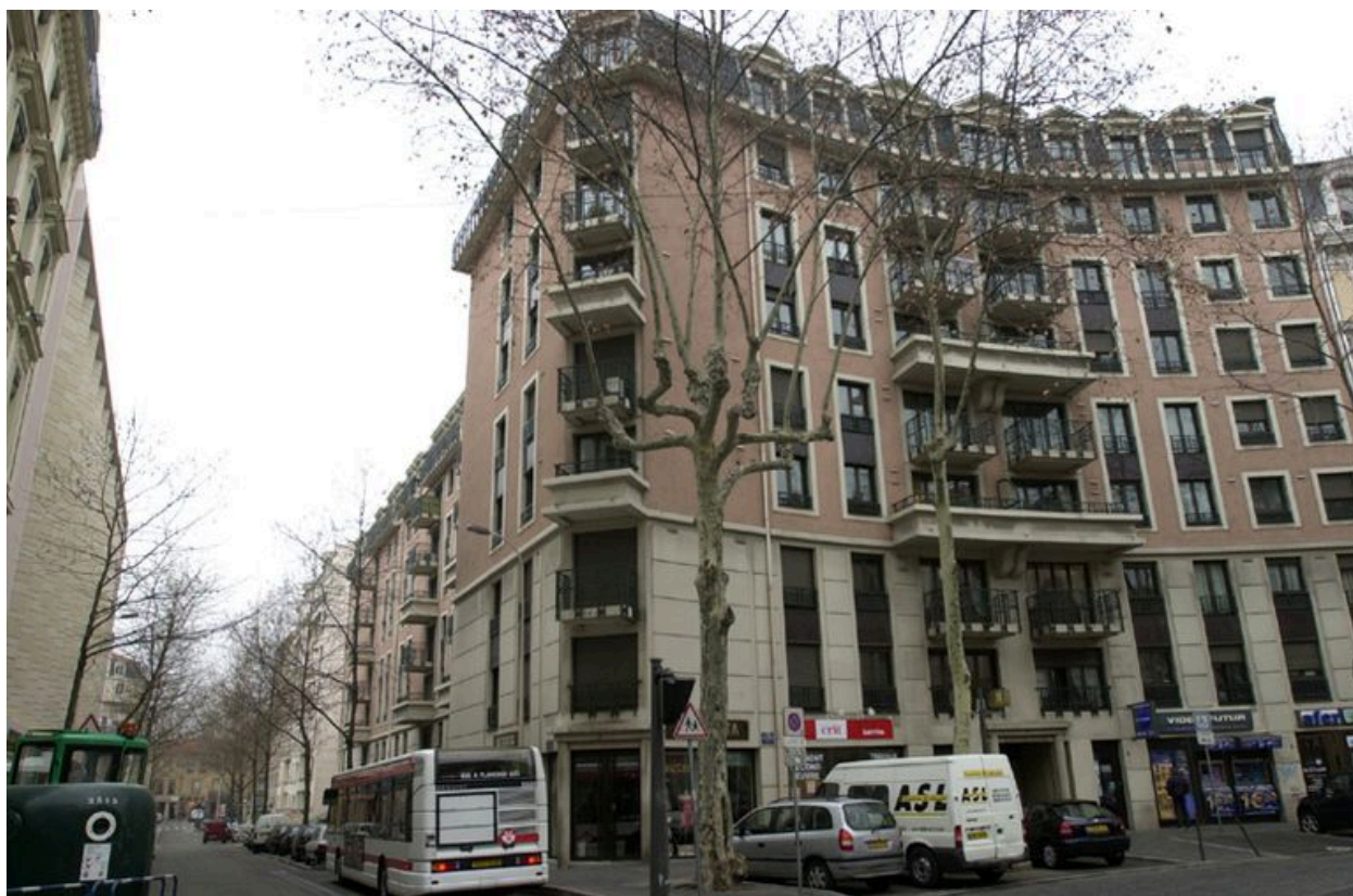
Vue générale de l'élévation sur la place Victor-Basch