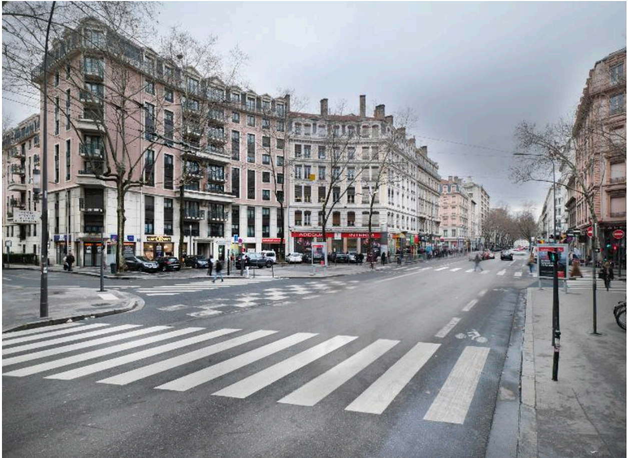
Vue générale depuis le nord