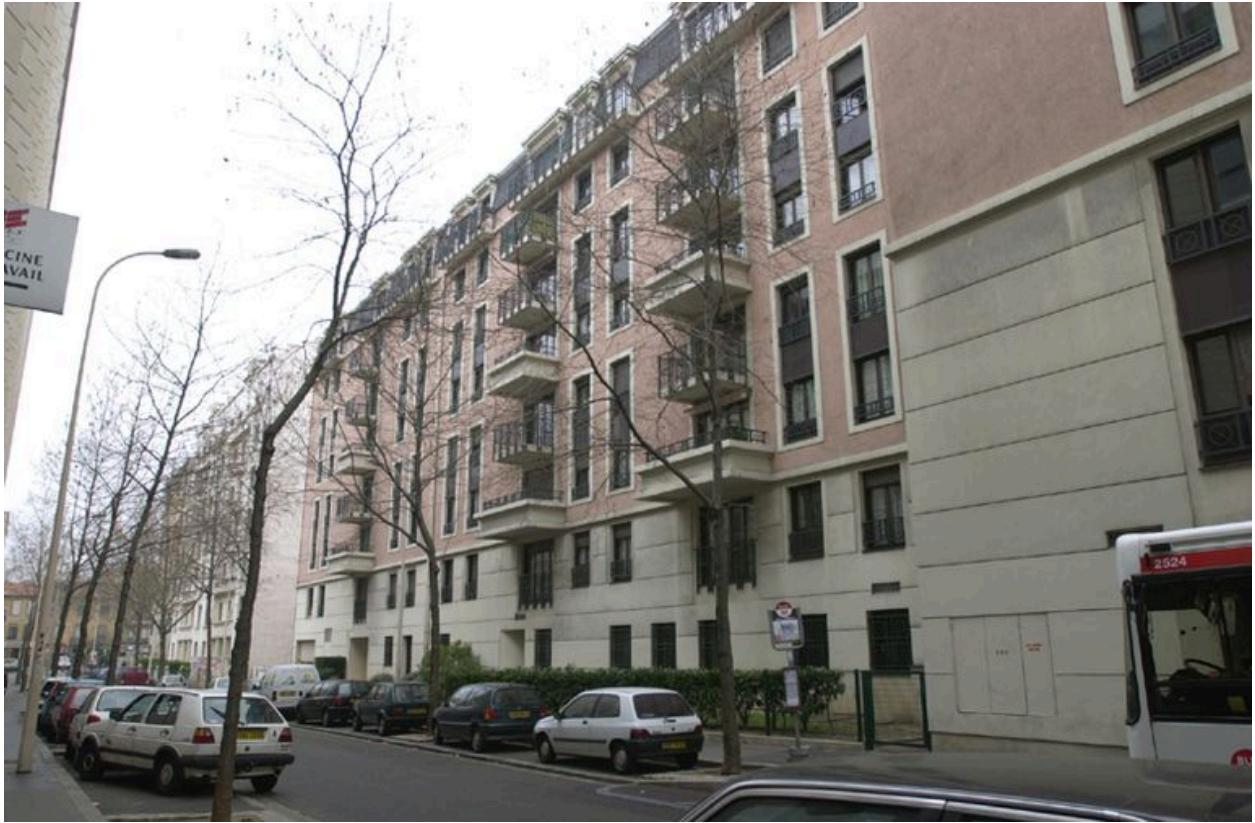
Élévation sur la rue Jean-Marie-Chavant