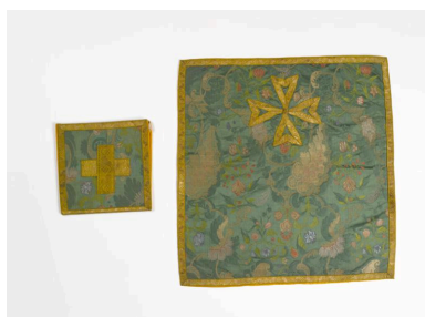
Vue générale du voile de calice et de la bourse de corporal. IVR83_20136300385NUC4A