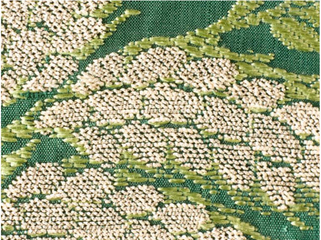
Vue de détail d'un orfroi : trame de frisé argent.