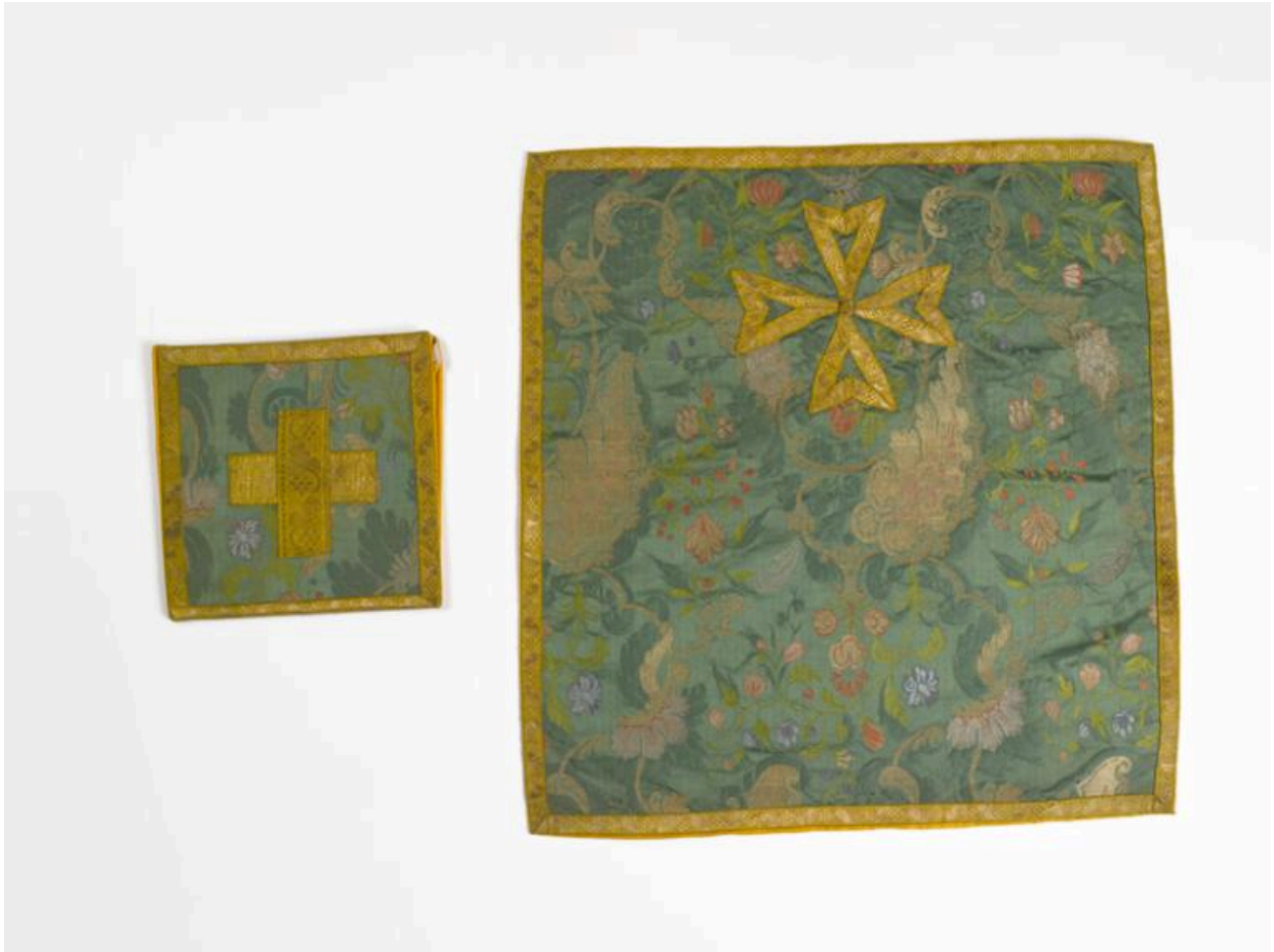
Vue générale du voile de calice et de la bourse de corporal.