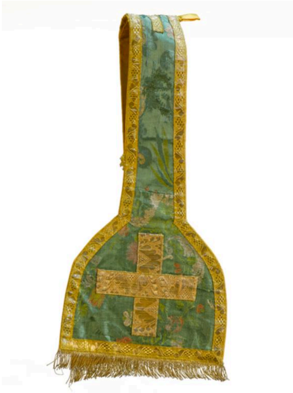
vue générale du manipule