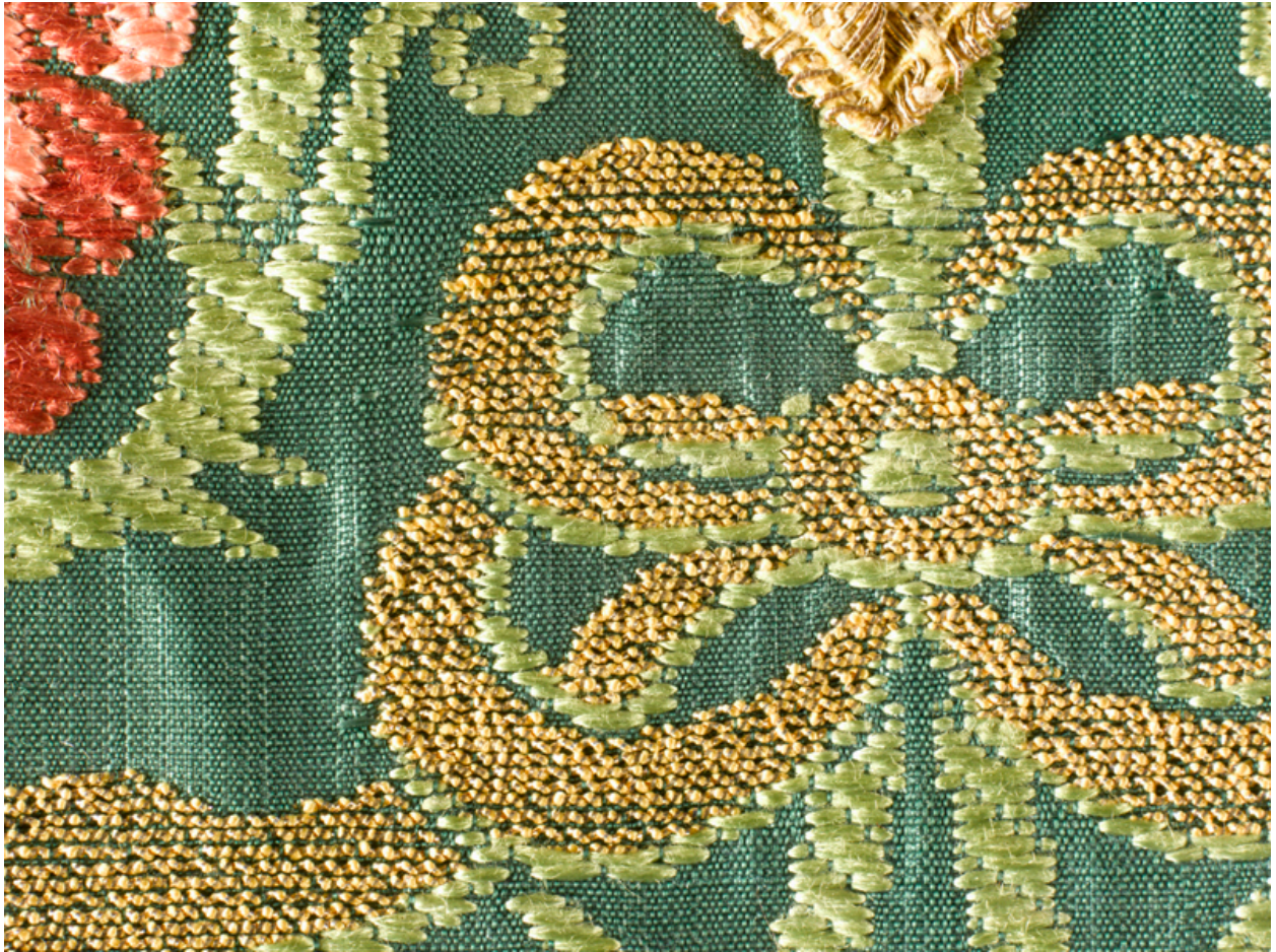
Vue de détail de l'orfroi dorsal : frisé doré et détail de filé.