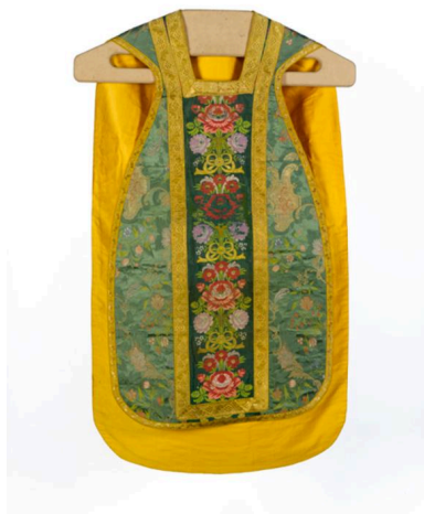
Vue générale du devant de la chasuble. IVR83_20136300359NUC4A