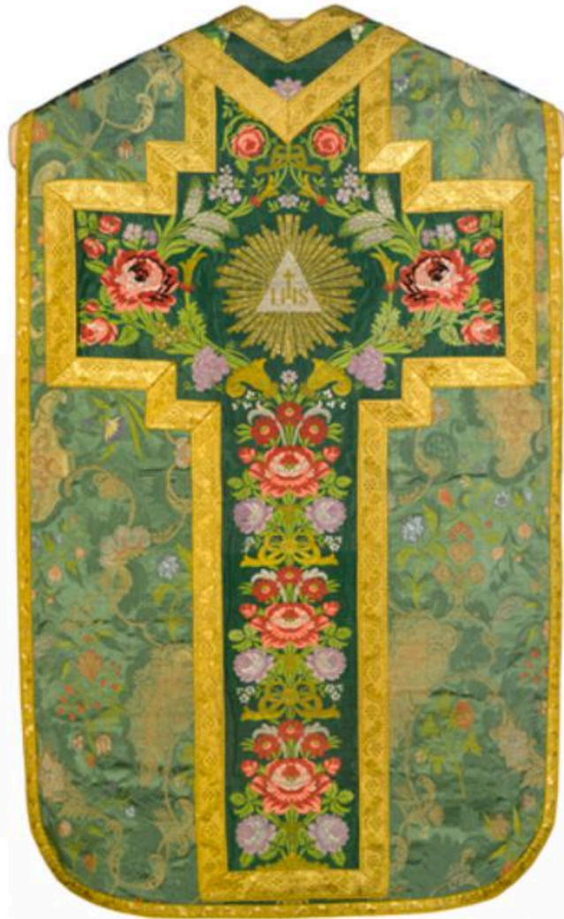
Vue générale du dos de la chasuble.