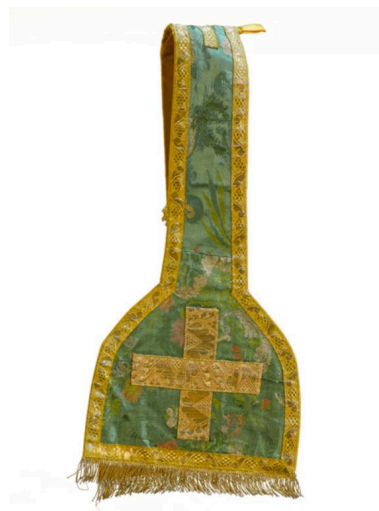
vue générale du manipule IVR83_20136300377NUC4A