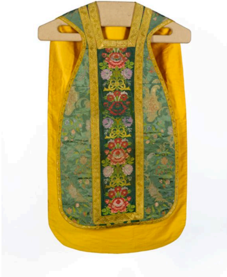
Vue générale du devant de la chasuble.