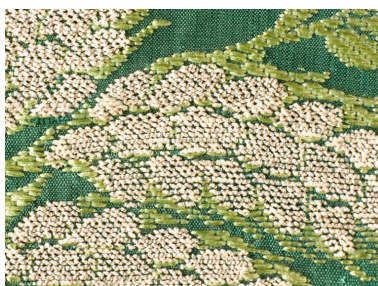
Vue de détail d'un orfroi : trame de frisé argent. IVR83_20136300361NUC4A