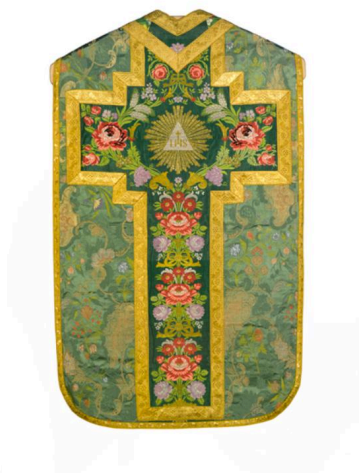
Vue générale du dos de la chasuble.