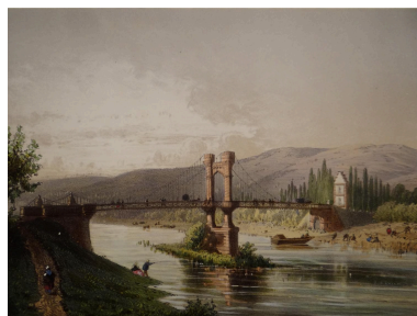
Détail IVR84_20216301000NUCA