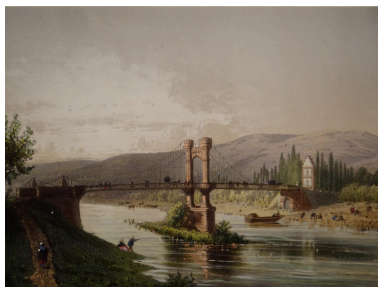
Détail IVR84_20216301000NUCA