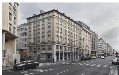
Vue de situation depuis l'ouest IVR84_20186901178NUCAQ