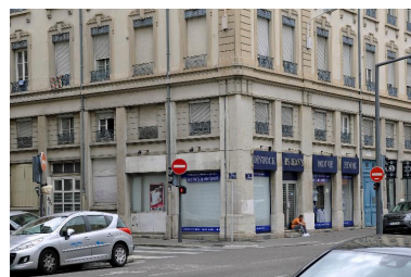
Détail du soubassement, rez-de- chaussée commercial et entresol