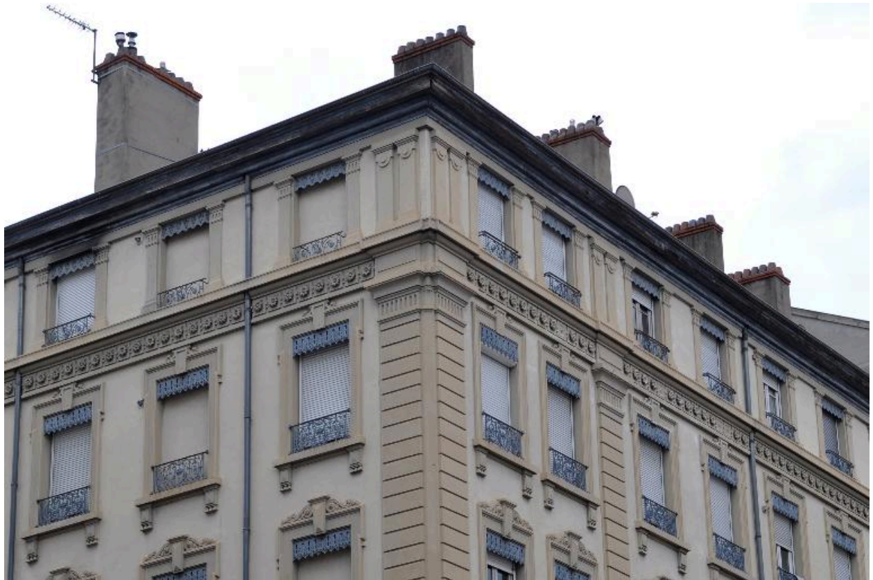
Détail du couronnement et décor de l'angle