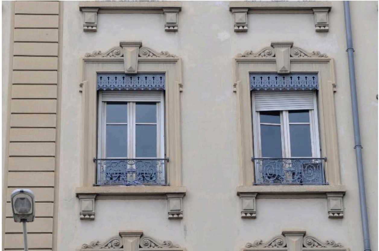
Détail du décor de deux baies du deuxième étage carré