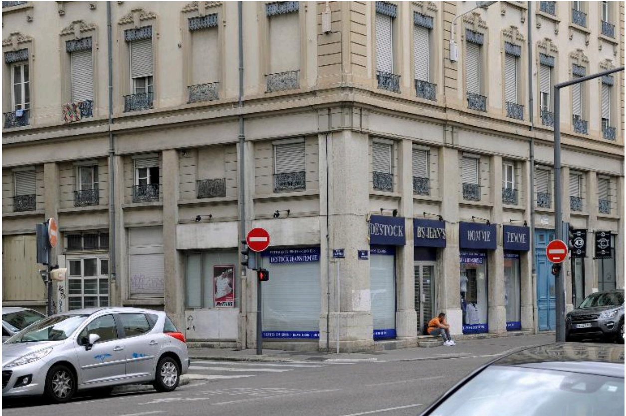
Détail du soubassement, rez-de-chaussée commercial et entresol