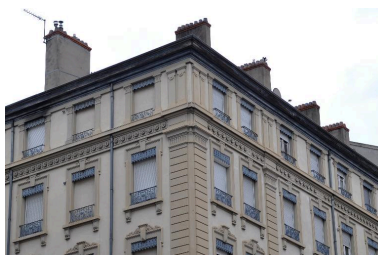
Détail du couronnement et décor de l'angle IVR84_20176901452NUCA