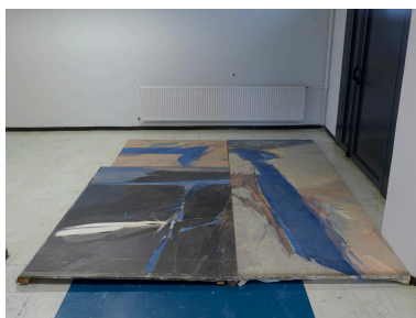
Vue de l'œuvre déposée.