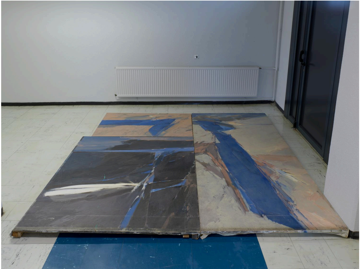
Vue de l'œuvre déposée.